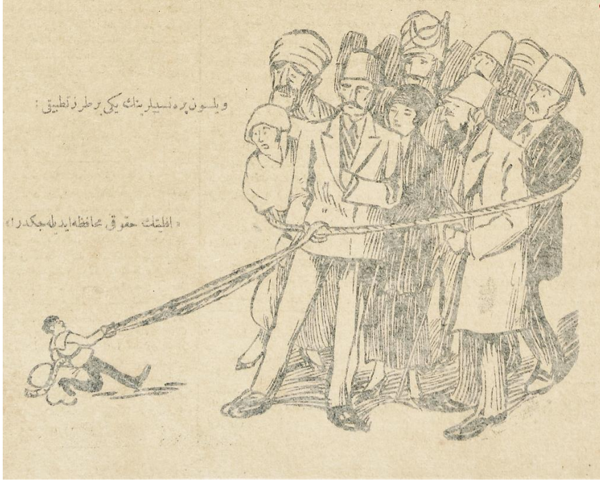
Karikatür-2: Wilson Prensiplerinin Anadolu'daki Uygulamasının Algılanışı (Wilson Prensipleri'nin yeni bir tarz-ı tatbiki: "Ekalliyetin hukuku muhafaza edilecektir!") (Önal, 2020, s.35-36; Selvi, 2007, s114).

15 Mayıs 1919'daki işgal sırasında Yunan askerleri, İzmir'deki Fransız ve ABD konsolosluklarına da saldırdığı, bir İtalyan tüccarının yirmi bin çuval kükürdünün yağmalandığı, ABD konsolosunun oğlunun yaralandığı anlatılmıştır (Selvi, 2007, s.37). Bunlara bakıldığında Yunanlılar, İzmir'i adeta mezarlığa çevirmişlerdir (Selvi, 2007, s.55).