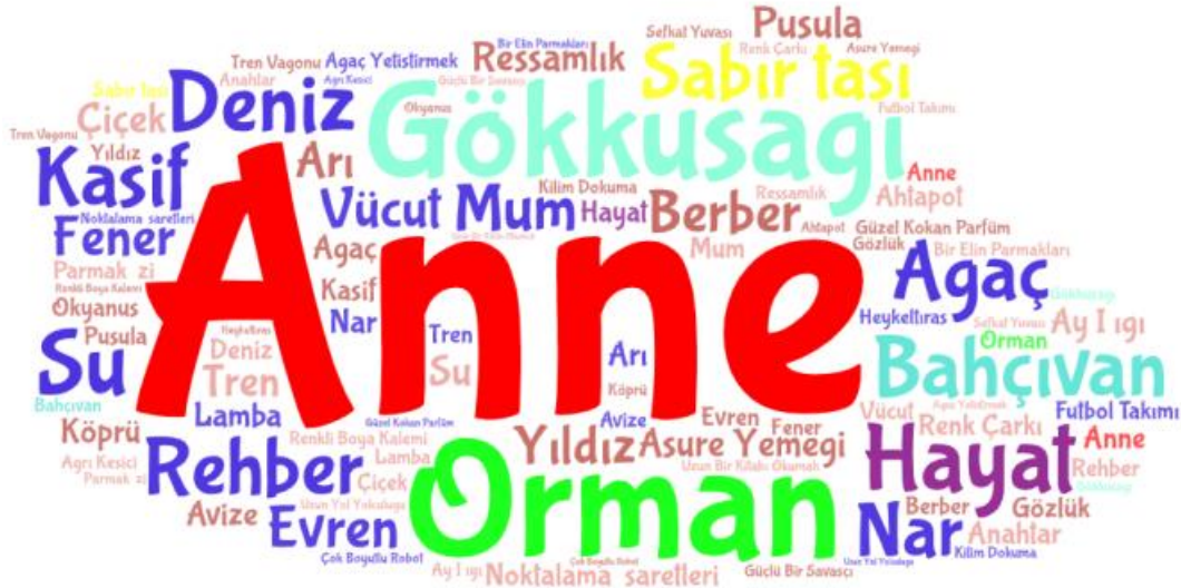
Şekil 1. Katılımcıların Özel Eğitim Öğretmenliğine İlişkin Ürettiği Metaforlara Ait Kelime Bulutu

barındırdığı ve yol gösterici bir misyonunun olduğu görülmektedir. Katılımcıların ürettiği 12 metaforun sıklığının iki, 26 metaforun sıklığının da bir olduğu görülmektedir.