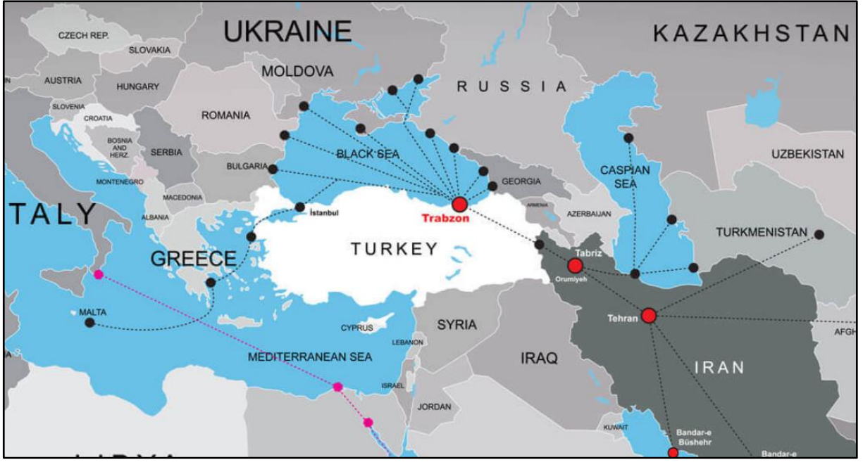
Şekil 1. Trabzon Limanı Konumu ve Hinterlandı (URL-5)

Trabzon Limanı konumu itibari Batum, Sochi, Poti, Novorossiysk, Samsun, Rize ve Hopa limanlarına komşudur. İşletme hakkı devri yöntemi ile 2003 yılında Albayrak Turizm AŞ'ye 30 yıllığına özelleştirilen Trabzon Limanı halihazırda Türkiye'de uluslararası düzeyde faaliyet gösteren 180 tane liman ve kıyı tesisi içerisinde Borsaya açılan tek liman konumundadır. Günümüzde ise anılan liman, konteyner, kuru dökme yük, Ro-Ro, sıvı dökme yük elleçleme kapasitesi ile kırkambar liman özelliği taşımaktadır (URL-1).