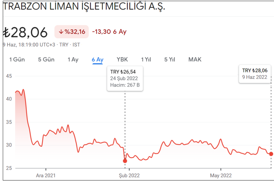
Şekil 2. Trabzon Limanı Hisse Senedi Hareketleri

Şekil 2’de görüldüğü üzere son altı aylık dönemde Trabzon Limanı hisse senedi fiyatının en düşük olduğu seviye, Rusya’nın Ukrayna’ya yönelik başlatmış olduğu askeri müdahalenin olduğu 24 Şubat 2022 tarihidir. Hisse senedi fiyatı 23 Şubat 2022 tarihinde 29,48 TL iken, yaklaşık %10 düşüşle 24 Şubat 2022 tarihinde 26,54 TL olmuştur. Ancak, savaşın başlamasından sonraki süreçte şoku kısa sürede atlatan hisse senedi fiyatları artış eğilimine geçmiştir. Dalgalı bir seyir izleyen hisse senedi fiyatları 9 Haziran 2022 itibari ile 28,06 TL’dir.