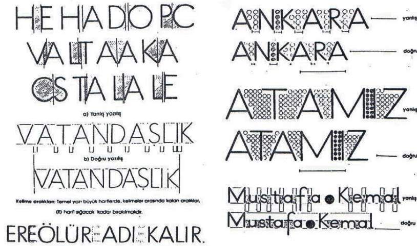
Şekil 5: TTKB Dik Temel Yazıda Harf ve Kelime Aralıkları