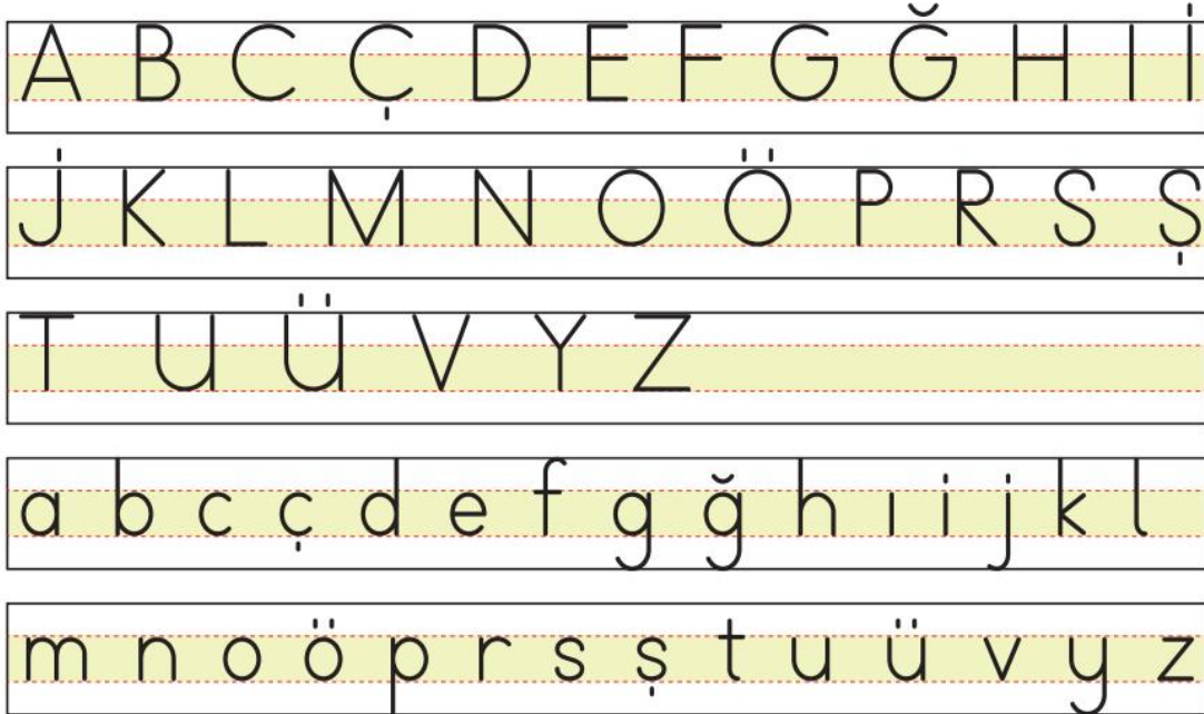
Şekil 2: TTKB Dik Temel Harfler

İlk okuma yazmada kullanılacak büyük-küçük dik temel harfler, örnek olarak Türkçe Dersi Öğretim Programı’nda verilmiş olup Şekil 2’de gösterilmiştir.