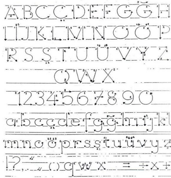
Şekil 4: TTKB Dik Temel Yazı Yazılış Yönleri