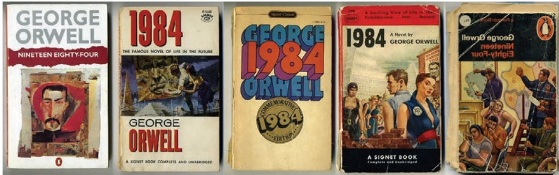
Görsel 1. 1984 Romani İçin Hazırlanmış Kapak Çalışmaları.

Yurttaşların “Zafer” konutları’nda yaşamakta olduğu ana bölgede evler yıkık dökük ve bakımsızdır. Ancak çocuklar için hazırlanmış tarih kitabında eski mekanlardan bahsedilirken çok daha kötü ve zor koşullarda yaşandığı belirtilir. Bu açıklama gerçeği yansıtmayan suni bir açıklamadır. Okunan gazetelerden izlenen yayınlara her şeye yönetimin ilgili birimleri karar vermektedir. Tarih istendiği şekilde yeniden yazılmakta; sorgulamaya imkân verilmemektedir. Bu görevleri üstlenen