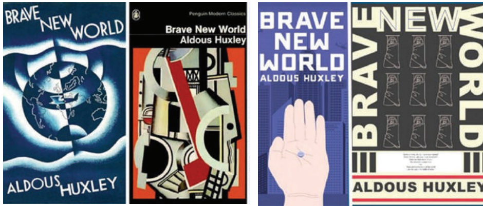
Görsel 2. Cesur Yeni Dünya Romanı İçin Hazırlanmış Kapak Çalışmaları.

çöküşlerin anlatıldığı eser için kullanılan “Kendi distopyasını yaratan bir ütopya” ifadesi adeta tek cümlelik bir özet niteliği taşımaktadır. Zıt yaşam biçimleri üzerine kurgulanmış olması ve distopik anlatımı ile 1984 eserine benzer yanlarının bulunmasına karşın, daha yumuşak bir anlatım tercih edilmiştir. 1984 eserinde, yazıldığı dönemin etkisi ile baskıcı yönetim anlayışıyla sağlanmaya çalışılan toplumsal refah, Cesur Yeni Dünya eserinde “yapay mutluluk” ve “kusursuzluk” algısı yaratılarak sağlanmıştır. Eserde kurgulanan Yeni Dünya’da insanlar doğmaz, kuluçka merkezinde üretilir. Alfa, beta, gama, delta ve epsilonlar olarak sınıflandırılırlar ve her bir sınıf farklı özellikler taşır. “Teknoloji” ve “ilerleme” tek gerçek, “duygu” ise uzak durulması gereken bir kavramdır. Mahremiyet ve bireysellikten uzak olan bu dünyadan farklı olarak özgür kalmaya çalışan Ayrık bölge 4 yerlileri ise birçok konuda farklılıklara sahiptir. İnsanlar eski dünyada olduğu gibi doğar ve ilkel bir yaşam sürerler (Huxley, 2017). Kitap için hazırlanmış olarak kapak tasarımları incelendiğinde, insanları sakinleştirmek ve duygu hissetmelerini engellemek için kullanılan haplar ile kurgulanmış-tasarlanmış yeni dünya düzeni