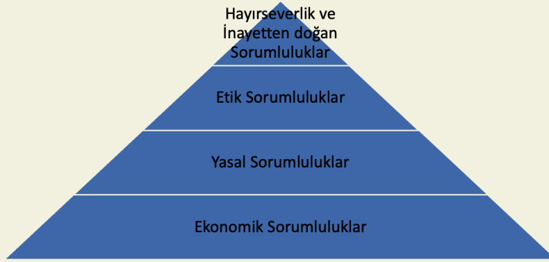
Şekil 4. Carroll'ın KSS piramidi (Carroll, 2016, s. 5)

1979, s. 500' den akt. Gedikçi Öndoğan, 2020). Ancak sonraki dönemlerde yapılan çalışmalarda hayırseverliğin KSS kapsamında ele alınmadığı araştırmalar da görülmektedir (Bkz. Schwartz & Carroll, 2003, s. 503-504; Friedman, 2007, s. 173-174).