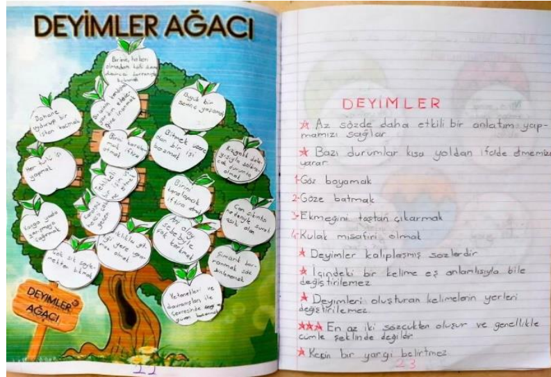
Şekil 2. Ekileşimli Türkçe Defteri