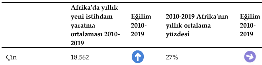
Tablo 1. Afrika’da En Çok İstihdam Sağlayan Yatırımı Yapan Ülkeler ve Afrika’nın Ülkelerin Küresel Yatırımlarındaki Payı, 2010-2019 (%)

2021’deki İsviçre-Afrika iş ortamı ve ilişkileri için hazırlanan rapora göre, Çin’in son 10 yıldaki küresel yatırımlarının yüzde 27’sini Afrika’ya yönelttiği görülmektedir (Tablo 1). İkinci ve üçüncü yatırımcılar ABD ve Fransa’dan olurken, İngiltere’nin beşinci sırada olması dikkat çekmektedir. Bu da İngiltere’nin Afrika’da yatırımı, Çin, Birleşik Arap Emirlikleri, Türkiye, Japonya, Hindistan gibi yükselen güçlere kaybettiğini göstermektedir. 2022 yılının Ocak ayında gerçekleşen İngiltere-Afrika zirvesinde, Başbakan Boris Johnson’ın Afrika’ya milyar dolarlık yatırım sözü vermesinin söz konusu verilerle ve İngiltere’nin yeniden varlığını tesis etmeye çalışması ile bağlantılı olduğu yorumu yapılabilir (Africanbusiness 2022). Ve bu da bizi Afrika’nın, aynı veya farklı aktörlerle yeniden paylaşıldığı sonucuna yönlendirmektedir.