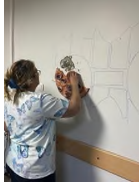
Görsel 19. Montaj, Güzelyurt İlçe Devlet Hastanesi

hasta olduklarında aynı acıyı yaşamaları ve hastaneye gelme nedenlerinin aynı olması sağlıklarına kavuşma istekleri. Bu nedenle de yuvarlak şekiller aynı formdadır. Dikey ve yatay formlar hastaneyi temsil etmek ve dairelerin etrafını sararak hastanenin sağlık problemleri çözebilecek her türlü organizasyona sahip olduğunu, hastayı güvende hissettirme düşüncesi yer almaktadır.