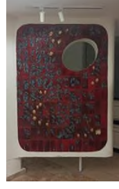
Görsel 5, 6. Füreyâ Koral, Hacettepe Üniversitesi Tıp Fakültesi Hastanesi