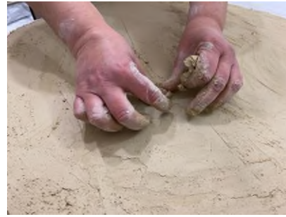
Görsel 17, 18. Güzelyurt İlçe Devlet Hastanesi Uygulama Aşaması