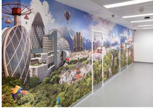
Görsel 2. University College London Hastanesi