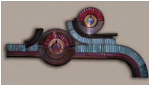
Görsel 13. Tüzüm Kızılcın, Ege Üniversitesi Tıp Fakültesi Hastanesi