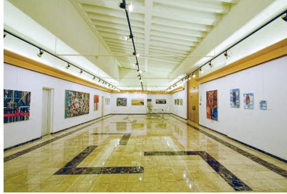
Görsel 4. Hacettepe Hastanesi Ahmet Göğüş Sanat Merkezi

Ülkemizde bazı üniversite hastanelerinde hastaların da rahatça dolaşabilecek mekanlarda sanat galerileri oluşturulmuş ve dönüşümlü olarak sergiler sayesinde sanat ve hasta ilişki sağlanmış olmaktadır. Hacettepe Hastanesi Ahmet Göğüş Sanat Merkezi buna güzel bir örnektir.