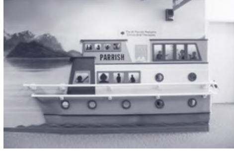
Görsel 3. Üç boyutlu bir gemi, Anchorage AK'deki Alaska Yerli Hizmet Hastanesi'ndeki bir duvarı süslüyor.