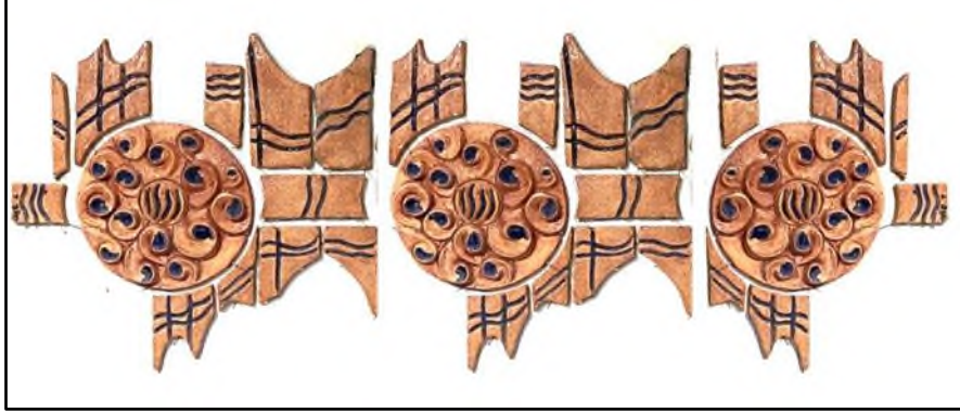
Görsel 16. Güzelyurt İlçe Devlet Hastanesi

Seramik duvar panosu 2022 yılında Güzelyurt İlçe Devlet Hastanesi danışma ve bekleme salonuna tasarlanıp uygulanmıştır. Yaklaşık 3 metrekare alana uygulanan çalışma Aksaray Üniversitesi, Güzelyurt Meslek Yüksek Okulu Mimari Restorasyon Programı öğrencileri ile alanlarında uygulama konusunda tecrübe kazanmaları için birlikte çalışılmıştır.