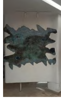
Görsel 9, 10. Cevdet Altuğ, Hacettepe Üniversitesi Tıp Fakültesi Hastanesi