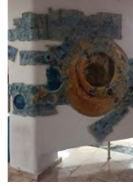
Görsel 7, 8. Atilla Galatalı, Hacettepe Üniversitesi Tıp Fakültesi Hastanesi