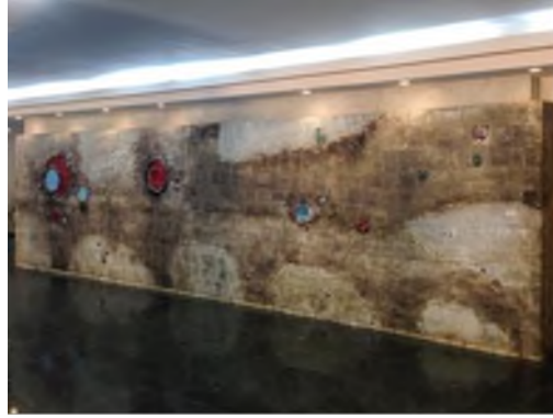
Görsel 12. Cevdet Altuğ, Gülhane Eğitim ve Araştırma Hastanesi

Ankara Gülhane Eğitim Araştırma Hastanesi Yönetim binasının girişinde bulunan Cevdet Altuğ'a ait seramik duvar panosu farklı boyutlarda tekrarlayan dairesel formlardan oluşan bir kompozisyon içermektedir.