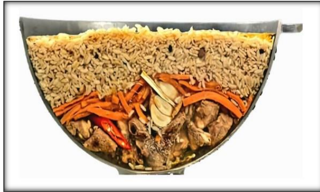
Resim 1: Taşkent düğün pilavı ürün yerleşimi

Toplumun kültürünü yansıtan, bu kültürü tanıtan unsurların başında mutfak kültürü vardır. Her bölgenin mutfak kültürü belli bir dönem olgunlaşma sürecini yaşar ve çeşitli yörelerden beslenir. Tarım ve hayvancılığa elverişli topraklar olan Orta Asya’da yemek kültürü coğrafyanın verdiği imkânlar sayesinde oluşmuştur. Özbek mutfağı da bölgede bulunan çeşitli yörelerin lezzetleriyle zenginleşmiş ve olgunlaşmıştır.