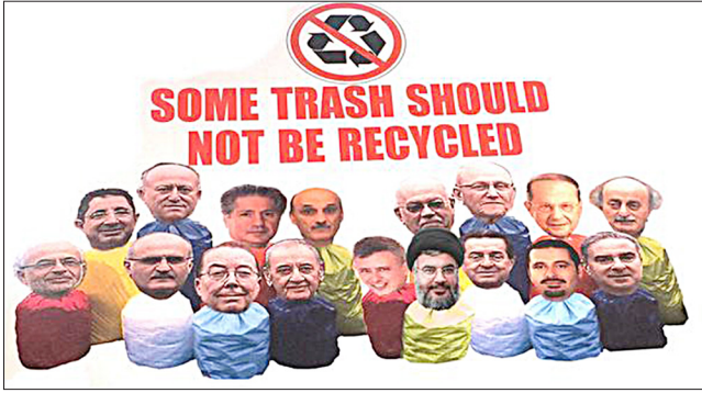
Şekil I: Lübnan Çöp protestolarından bir pankart 48

Tamamen sivil bir hareket vurgusuyla sokağa çıkan protestocular, ülkedeki tüm siyasi aktörlerin sorumlu tutulduğu döviz ve pankartlar kullanarak mezhepler ve ideolojiler üstü bir dil geliştirmiştir. Öncelikle kamu sağlığı açısından ciddi tehdit oluşturan çöplerin ivedilikle toplanması çağrısında bulunan göstericiler, ayrıca yolsuzluk iddialarının soruşturulması, Çevre Bakanı Muhammed Maşnuk'un görevinden istifa etmesi ve siyasi aktörlerin bir araya gelerek Cumhurbaşkanı seçiminde artık bir uzlaşmaya varması taleplerinde bulunmuşlardır.