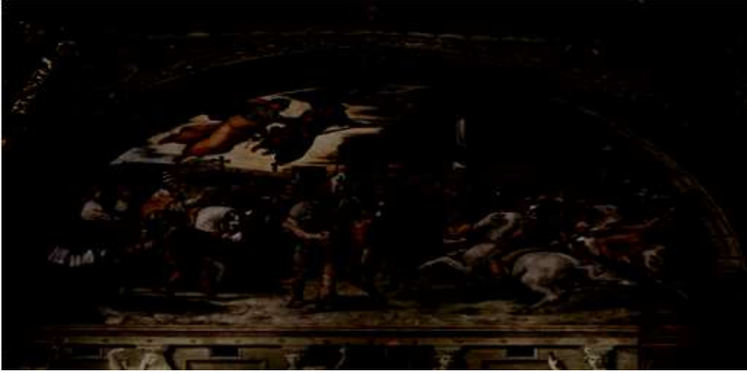
Resim 1. Raphael tarafından çizilen "Attila'nın geri çekilmesi" adlı ünlü tablo 5

olayları ayrıntılı bir biçimde anlatmıştır. Sidonius Apollinaris İmparator Avitus'a (455-456) yazdığı övgü dolu şiirinde Galya Seferi ile ilgili olarak "barbarların tümü kuzeyden bir anda Galya'ya döküldü" dizelerine yer vermiştir. Antakyalı İshak'ın eserinde de Hunların İstanbul kuşatmaları hakkında bilgi verilmektedir. Diyakoz Paul'un verdiği bilgilerde de Galya Seferi İtalya tarihinin bir dönüm noktası olarak anlatılmıştır. Attila ve savaşa katılan diğer tarafları İtalya'nın bir döneminden başka bir dönemine geçişte birer figür olarak gösterilmişler, Papa Leo ve Aziz Sverianus ise asıl kahramanlar olarak addedilmişlerdir 3 . Diyakoz Paul'un verdiği bilgilerde Attila'nın Galya seferine giderken yanında Papaz Oktor adlı birini götürdüğünü söylemesi Türk kültür tarihi açısından son derece önemlidir 4 . Bu bilgiden de anlaşılan Attila'nın Galya Seferi'ni aynı zamanda kiliseye karşı bir faaliyet olarak gerçekleştirmiş olmasıdır. Bu nedenle Galya seferi dünya tarihinde askeri yönünün yanı sıra din, psikoloji ve sanat yönleri ile de ses getirmiştir.