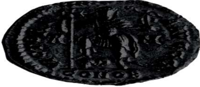
Resim 3. Ravenna'da III. Valentinianus adına basılmış altın bir solidi 22 .

toprak sahipleri aristokrasinin tek hâkimi olmuşlardır ki bunlar aynı zamanda imparatorluk topraklarındaki Galya'nın da tek hâkimi haline gelmişlerdir 21 .