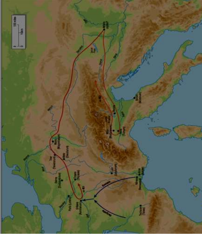
Resim 5. Attila'nın 451 ve 452 yıllarındaki Batı seferlerini gösteren harita 68

sağlayamadıkları için kesin bir zafer getirmemiştir. Ancak hem Attila hem de Aetius sefere başlamadan önceki hedeflerini gerçekleştirme olanağını da bulmuşlardır. Ayrıca bu sefer ve savaş Batı'nın dimağında her zaman canlı tutulmuş ve bunun gelecek nesillere aktarımı sanat eserleri ve efsanelerle yüzyıllarca taşınarak derin ve bir o kadar da korkunç bir Attila algısının oluşmasına zemin hazırlanmıştır.