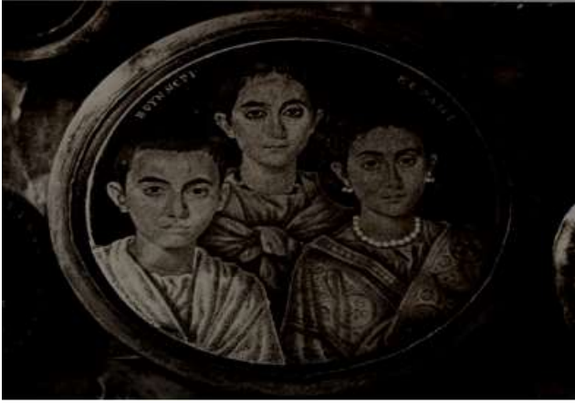
Resim 2. V. yüzyıldan kalma haç ortasındaki madalyonda muhtemelen Gallia Placidia ve iki çocuğu (III. Valentinianus ve Honoria) temsil edilmektedir. (Museo Civica dell’Eta Cristiana, Brescia, İtalya) 18

Batı Roma İmparatorluğu’nda III. Valentinianus dönemi aslında görünmez, etkisiz bir imparatorun dönemi olarak görülmüştür. Çağdaş kaynaklar Aetius’un fikirlerinin ve faaliyetlerinin egemen olduğu yönünde hemfikirdirler. Bu nedenle Valentinianus’un bir lutlama sırasında Aetius’u sağ ve sol elini kesmek suretiyle öldürdüğünü ve Sidonius Apollinaris’in verdiği bilgilere göre de bu hamlenin imparatorluğun sonunu getirdiği bilinmektedir 19 . Ancak Ernst Stein’in ortaya attığı teze göre de Aetius başından beri aristokrasinin gücünü kullanarak imparatora karşı bir tavır takınmış ve bu durum imparatorluğun sonunu getirmiştir 20 . Stein, Aetius’un politikasını şu şekilde açıklamaktadır: Zengin toprak sahiplerini imparatorluğa karşı kıskırtarak imparatorluk hazinesinin boş kalmasını sağlayan Aetius böylece orduyu tamamen elinde tutabilmiştir. Ancak ordudaki diğer komutanlara çok fazla güvenemeyeceği için Hunlarla olan dostluğunu kullanarak kendine özgü bir ordu da oluşturmuştur. Bu da onun imparatorluk içindeki kudretini arttırmıştır. 450 ‘li yıllarda artık bu büyük