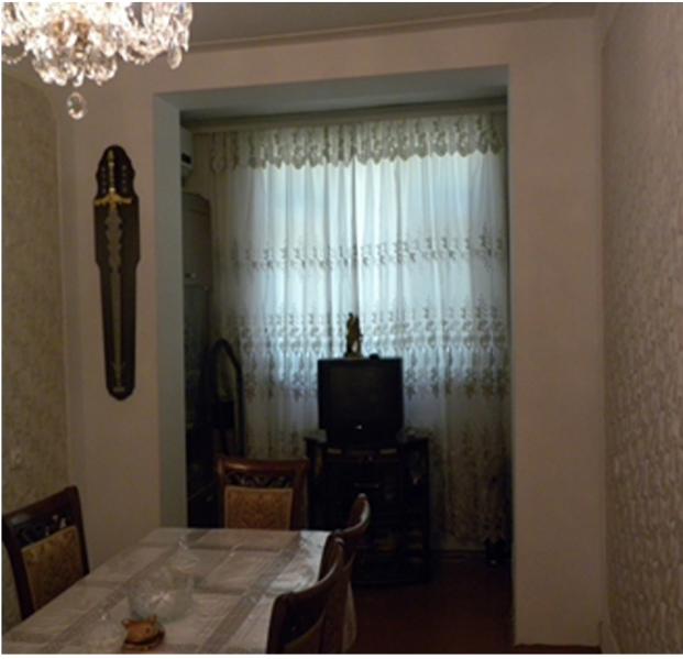
Görsel 22. Kruşçev Dönemi Konutu

1950'li yılların yavaş yavaş sonlarına gelindiğinde Stalin döneminde neoklasik tarzda uygulanan yapıların boyutlarında keskin değişimler yaşandı. Kütleli olarak dikey yöndeki yüksek yapılar daha alçak ve genişleyen yapılara dönüştü. Yüksek kuleli konut yapıları, Sovyet yıldızından ziyade çekiç ve orak sembolleri ile asker ve işçi giysileriyle süslenmeye başlandı. Kitlesele konut binaları çok yalın dikdörtgen şekil ile ifade edilmeye ve temel olarak fonksiyonelliğe önem verilmeye başlandı. Kapı ve pencereler ile beraber balkonlar da küçüldü ve binalar yeni şeklini karakterize etti. Stalin dönemindeki gösterişli mimari planlar özellikle konut ve idari yapılardan çekildi ve yeni yapılar artık konstrüktivist sistemin özelliğini ifade eder olmuştü.