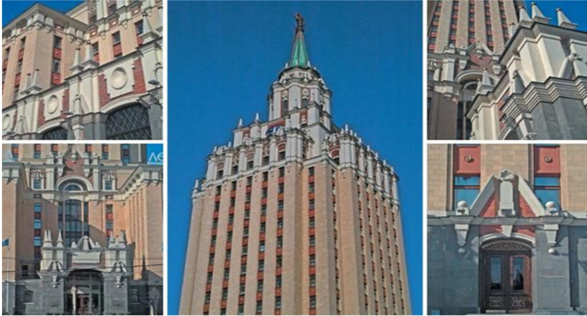
Görsel 19. Leningrad Oteli

Görsel 18 ve 19 da görülen yapılar Moskova'nın ünlü otelleridir. Sovyet döneminin en ihtişamlı otelleri sayılan yapılarda yurt dışından ve yurt içinden gelen yüksek rütbeli misafirler ağırlanmaktaydı. Leningrad ve Ukrayna otelleri Moskova'nın dolayısıyla Sovyetler Birliğinin en bilinen yapılarının başında gelmekteydi. Yine diğer yapılarda olduğu gibi sivri kuleler, ihtişamlı girişler ve şehrin neredeyse her noktasından görülebilen Sovyet yıldızı en tepede kendini göstermekteydi. Tüm yapılar Sovyet başarılarının zaferini ve gücünü göstermek için tasarlanmıştı.