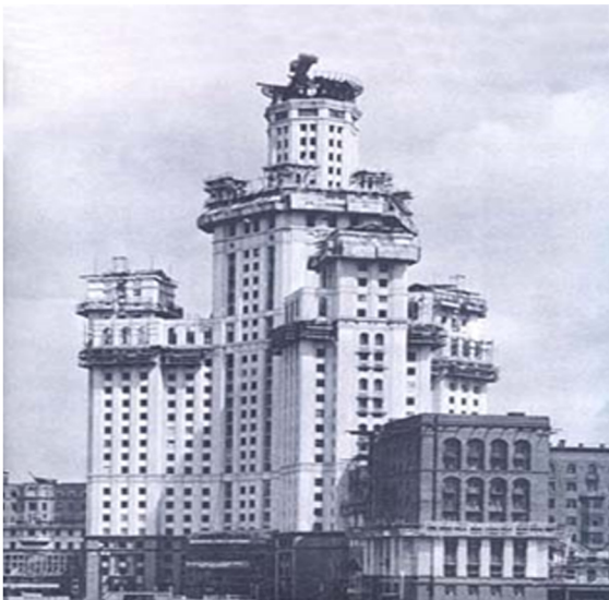
Görsel 10. Kotelniçeskoj Naberejnyy Binası

Kotelnicheskoy Naberejnyy konut binası yapıldığı dönem olan 1948 yılına göre benzersiz bir lükse sahip olan yapının kapalı bir otoparkı bulunmaktadır. Böylesine kapsamlı ve çok katlı yapılar daha öncesinde Sovyetlerde pek görülmemişti. İnşaatın bitiminden birkaç yıl sonra yapının kulelerine sivri şapkalar yerleştirilmiş ve yapı tamamlanmıştır. Yapılardaki sivrilikler, cepheye arz edilen önem, fonksiyondan ziyade görsellik olarak kurulan üstünlük, dönemin Stalin lakaplı başkanı Yosif Visaryonoviç Cugaşvili'nin (Иосиф Виссарионович Джугашвили) liderliğini ve ideolojisini taşıy niteliktedir.