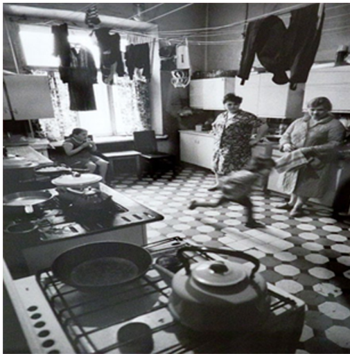
Görsel 7. Komün Evi

Komün dairelerin Sovyetler Birliği dönemindeki durumu Görsel 7 ve 8 de görülmektedir.