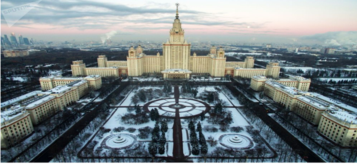
Görsel 17. Moskova Devlet Üniversitesi

Devlet Üniversitesi'dir. Yapının inşaatı 5 yıl kadar sürmüştür. Diğer 6 kulenin de hepsinde olduğu gibi Moskova Devlet Üniversitesi'nde de tam tepesinde Sovyet yıldızı bulunmaktadır. Sovyet yıldızının bulunduğu ana merkez kuleyi çevreleyen küçük kuleler her açıdan görülebilmektedir. Yapı toplamda 240 m. yüksekliğindedir ve Moskova'nın Lenin Dağları olarak bilinen Serçe Tepeleri üzerine kurulmuştur. Yapı 1948-1953 yılları arasında yapılmış olup günümüzde hala ilk günkü gibi Moskova Devlet Üniversitesi olarak hizmet vermektedir ve Moskova'nın en büyük üniversitesidir. (Mimarlık ve Kent Dizisi-2,2002)