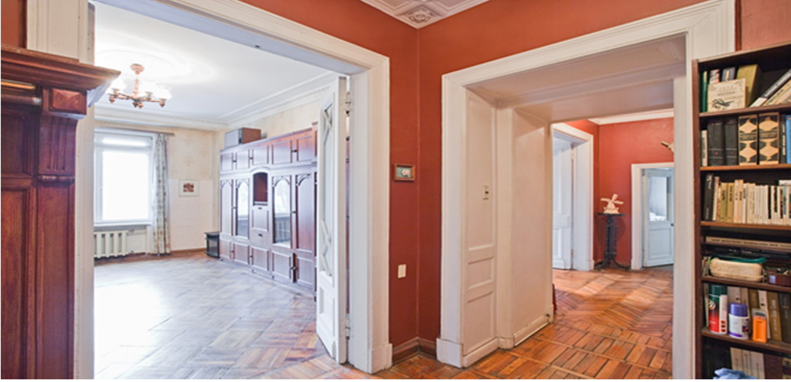
Görsel 16. Kotelnicheskoy Naberjnoj Dairesi (Kaynak: www.fotosmoskva.net.ru, 30.09.14)

Dairelerin içlerindeki kapılar ve pencere boyutları birbiri ile oldukça orantılıdır. Yüksek tavanlar, geniş, yüksek kapı ve pencereler Başkan Stalin'in güç ve ihtişamını anlatır niteliktedir.