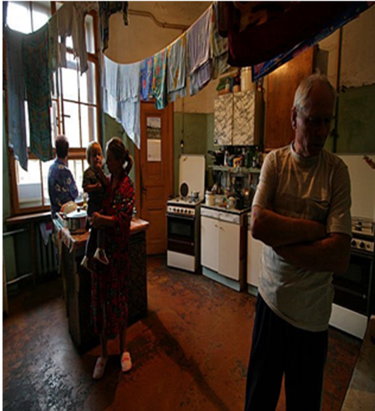
Görsel 3. Komün Dairelerin Mutfağı

Yapıda bulunan her odada bir, bazen de iki aile ikamet etmektedir. Koridor, mutfak ve banyo ortaklaşa sıra ile kullanılmaktadır. Görsel 3 ve 4 Her ailenin mutfakta kendine ait bir evyesi, buzdolabı ve ocağı mevcuttur. Buzdolapları genellikle bir kilit yardımıyla dışarıdan açılıma engellenmiş durumdadır.