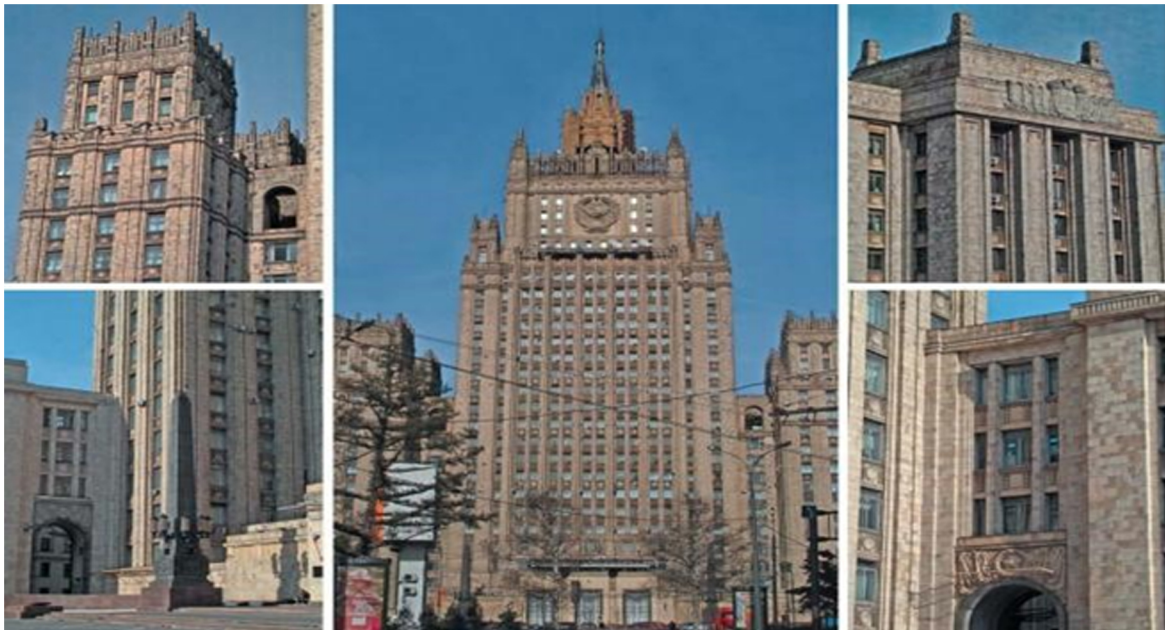
Görsel 20. Dış İşleri Bakanlığı Binası (Kaynak: www.fotomoskva.net.ru , 30.09.14)