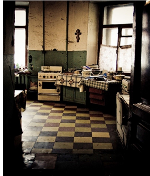
Görsel 4. Komün Dairelerin Mutfağı