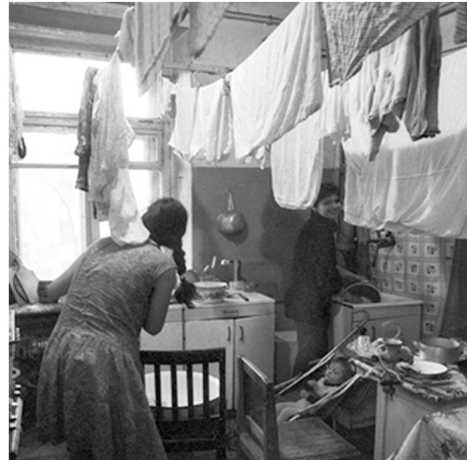
Görsel 8. Komün Evi

Komün evlerde oldukça fazla olumsuzluk ve yetersizlik hâkimdi. Buna rağmen Saray evleri gibi büyük evlerde yaşayan insanlar kendi kültürel alanlarını oluşturmuşlardı. Boş merdiven kovanları, kiler alanları, koridor sonları, balkonlar ve kullanılabilecek birçok boşluk alanlar sanatsal