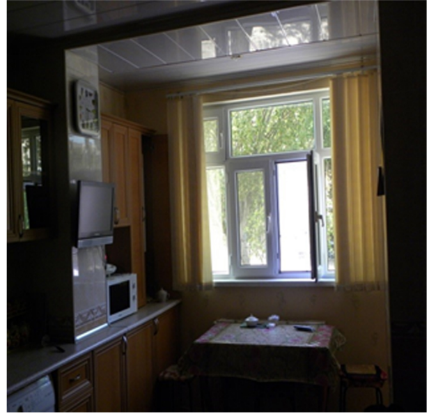
Görsel 23. Kruşçev Dönemi Konutu

Halk arasında "Kruşçevka" olarak adlandırılan bu yapılara binlerce insan yerleştirildi. 1-2 ve en fazla 3 odalı, tavan yüksekliği 2,50 m hatta bazıları 2.20m, tuvalet ve banyonun bir arada olduğu, kontrplak bölmeli ve tipik apartman girişli binalar tüm ülkede hızla yayılmaya başladı. Artan nüfusla beraber ardı ardına yapılan toplu konutlar yaşanan barınma sorununu neredeyse çözmüştü. İlerleyen yıllarda halkın birçok sorununa çözüm arandı.