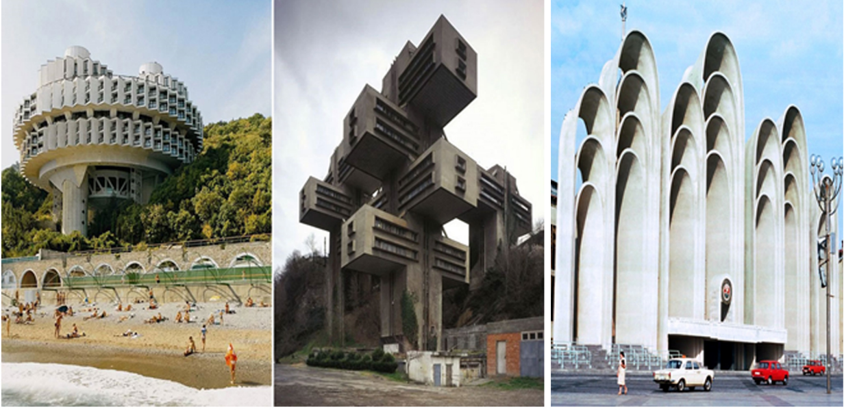
Görsel 24. Sovyetler Dönemi Stalin Sonrası Mimari Yapılar

Keskin ve sivri kulelerin, vurgulamanın azaldığı, daha yumuşak hatların, devamlı çizgilerin hâkim olduğu görülür. Yapılar dikey boyutta sivriliklerden arınmış, daha yatay boyutlarda devamlılık sağlamıştır. İdeolojik yapılanmanın, sosyo-politik reformların mimariyi, sanatı hatta kültürü değiştirip yön verdiği yeniden oluşuma yol açtığı görüldü. Özellikle Leonid Brejnev döneminde Mimaride tasarımlara özgünlük yaratmak için yapılarda zamanla çoklu blok uygulanmaya başlandı. 70'li Yıllara gelindiğinde artık Moskova, Vilnius, Leningrad, Kiev ve diğer şehirlerde mimaride görsel tasarım zorunluluğu uygulanmaya başlandı ve tasarlama komiteleri kuruldu.