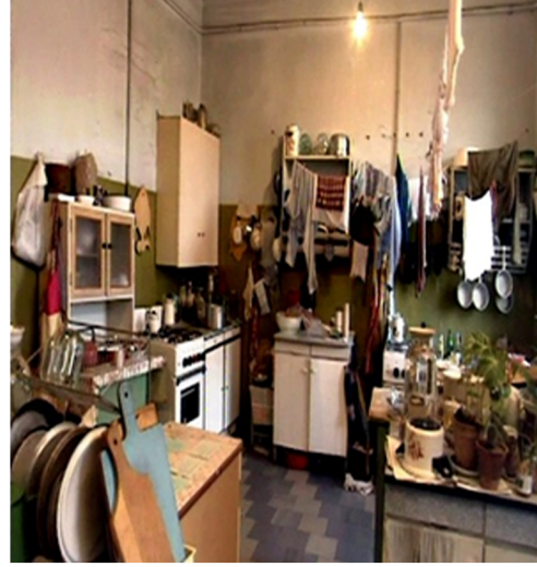
Görsel 6. Diğer katın ortak mutfağı

Komün dairelerin Sovyetler Birliği dönemindeki durumu Görsel 7 ve 8 de görülmektedir.