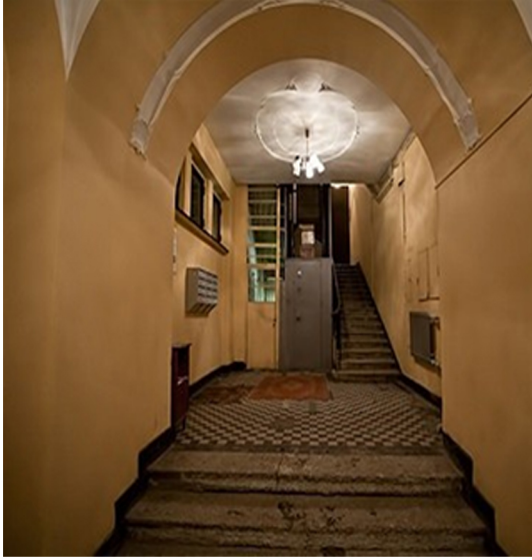
Görsel 1. Komün evinin girişi

Görsel 1 ve 2’de görüldüğü gibi devasa bir girişe ve koridora sahip olan evlerde önceleri sadece tek aile yaşamaktaydı. Devrim sonrası uzun ve büyük olan koridorlar bile bölünerek odalara dönüştürüldü.