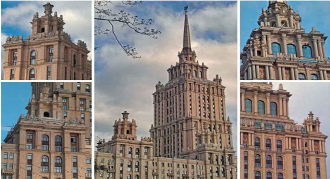
Görsel 18. Ukrayna Oteli

Farklı kültürel yapılardaki hiyerarşi em kamu hem de idari yapılarda göze çarpmaktadır. İdeolojik yapılanmanın, vurgunun etkisi cephe tasarımlarında, yapının yüksekliği, her açıdan görülebilirliği ile kendini belli etmektedir. Ana merkez kule dönemin lideri Stalin'i, kendisini çevreleyen diğer küçük kuleler ise, başkan yardımcılarını temsil eder niteliktedir.