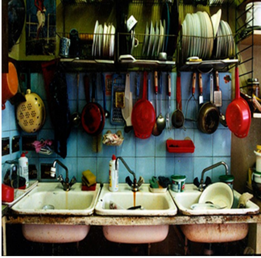
Görsel 5. Mutfak lavaboları

Görsel 3,4,5 ve 6 da görüldüğü gibi aynı anda tüm ev halkının veya iki ailenin de yemek yemesi neredeyse imkânsızdır ve alan kullanıma uygun değildir. Aynı şekilde, banyo da sırayla kullanılmaktadır. “Bazı evlerde her katta banyonun bulunmaması evin içinde uzun kuyruklara sebebiyet vermektedir. Çoğunlukla evlerin bazı katlarında tek bir lavabo ve tek bir tuvalet mevcuttur. Her aile banyo eşyalarını ve havlularını odalarında tutmaktadır. Mutfağın bir kısmı çamaşır kurutmak için kullanılmaktadır. Yapıda bulunan balkonlar kapatılarak odalara dâhil edildiği, ya da kışın soğuk depolama amacı ile kullanıldığı için çamaşır asmak için mutfak, koridor ve oturma alanları kullanılmaktadır”. (Jular, 2015: 32)