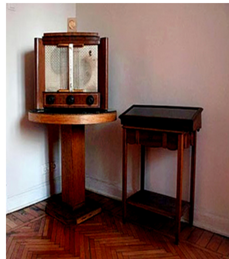
Görsel 15. Kotelniçeskoy Naberejnoj İç Mekanı