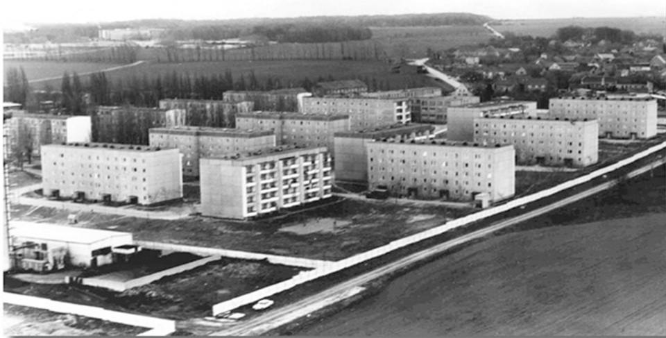
Görsel 21. Kruşçevka Binaları 1950-1960'lı Yıllar