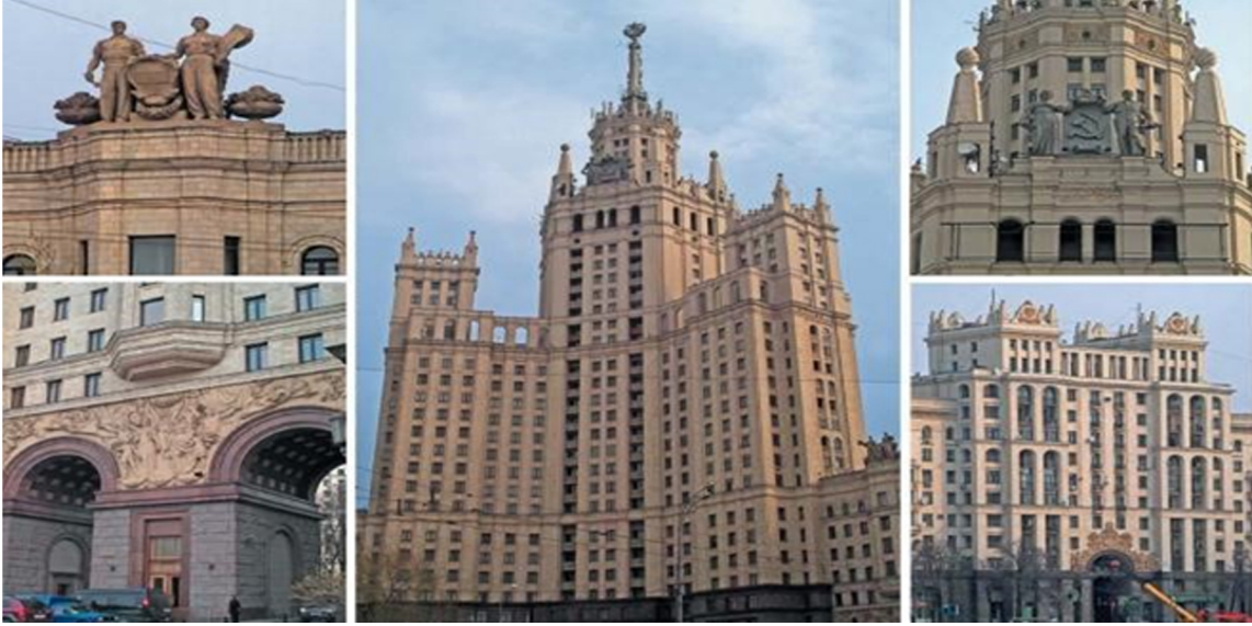
Görsel 9. Kotelnicheskoy Naberejnyy Binası

hızasında oldukça yüksek ve büyük kullanımı mobilya kaplamalarında kullanılan malzemelerin döneme göre oldukça lüks ve gösterişli tasarımları göze çarpmaktadır. Özel planlı projeler konut kosmpleksi olarak tasarlanmıştı ve içinde her türlü ihtiyacı karşılayacak hizmetler vardı. Daha konforlu çok daha geniş, neredeyse kişiye özel daireler yaratılmıştı. Sosyalist sistemde bu tarz lüks ve özel dairelerin üst düzey devlet ve komünist parti çalışanlarına tahsis edilmesi, halkın çar döneminden kalma eski, yetersiz ve uygunsuz koşullarda yaşamak zorunda bırakılması savunulan eşitlik ilkesi ile oldukça çelişir durumdaydı.