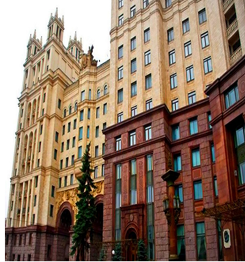
Görsel 13. Kotelniçeskoy Naberejnoj Binası

Kapılar ve eşyalar değerli ahşaplarla bezenmiştir. Yapının cephesi ve genel görünümü kadar dairelere ve yapının içerisine de son derece önem verilmiştir. Dönemin nadir bulunan renkli mermerleri yapıda birçok alanda kullanılmış ve çift asansör uygulanmıştır. Günümüzde dahi lüks sayılan pembe mermerler 1940'lı yıllarda bulunması ve uygulanması son derece değerliydi. Buna rağmen hiçbir maddi ve manevi fedakarlıklardan kaçınılmamıştı. Yapının ana girişinde kubbelerin iç kısımlarında el işçiliğiyle döşenmiş geniş kabartmalar mevcuttu. Günümüzde hala lüks ve prestijli sayılan yapıda daire fiyatları oldukça yüksektir. Dönemin ekonomik, politik ve ideolojik tutumu, konut yapıları üzerinde kültürel yansıma dönüşmüştür. Stalin'in güç ve iktidar arzusu, bir toplumun en belirgin kültürel yapısı olan konut yapılarında kendini açıkça belli etmiştir.