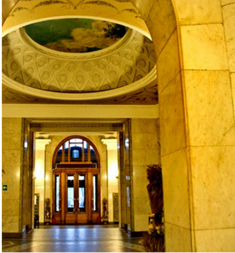
Görsel 12. Kotelniçeskoy Naberejnoj Binası

Yapının dış cephesinin bir kısmı rustik işlenmiş kırmızı granitle kaplanmıştır. Daireler oldukça yüksek tavanlı ve lüks tasarımlar olarak yüksek Sovyet standardından fazlasını yansıtır. İç mekanlar pembe mermer, değerli ahşaplar ve çelikle döşenmiştir. Yapının girişi oldukça görkemli ve geniştir. Girişin iç avlusunun tavanında el işlemleri ve resim motifleri mevcuttur.