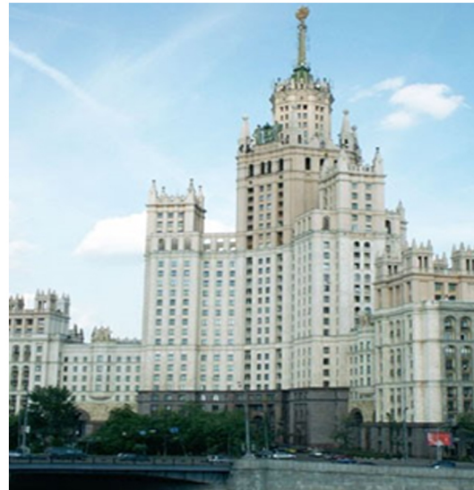
Görsel 11. Kotelniçeskoj Naberejnyy Binası