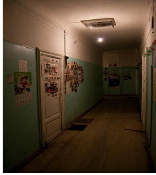
Görsel 2. Komün evinin koridoru

Yapıda bulunan her odada bir, bazen de iki aile ikamet etmektedir. Koridor, mutfak ve banyo ortaklaşa sıra ile kullanılmaktadır. Görsel 3 ve 4 Her ailenin mutfakta kendine ait bir evyesi, buzdolabı ve ocağı mevcuttur. Buzdolapları genellikle bir kilit yardımıyla dışarıdan açılıma engellenmiş durumdadır.