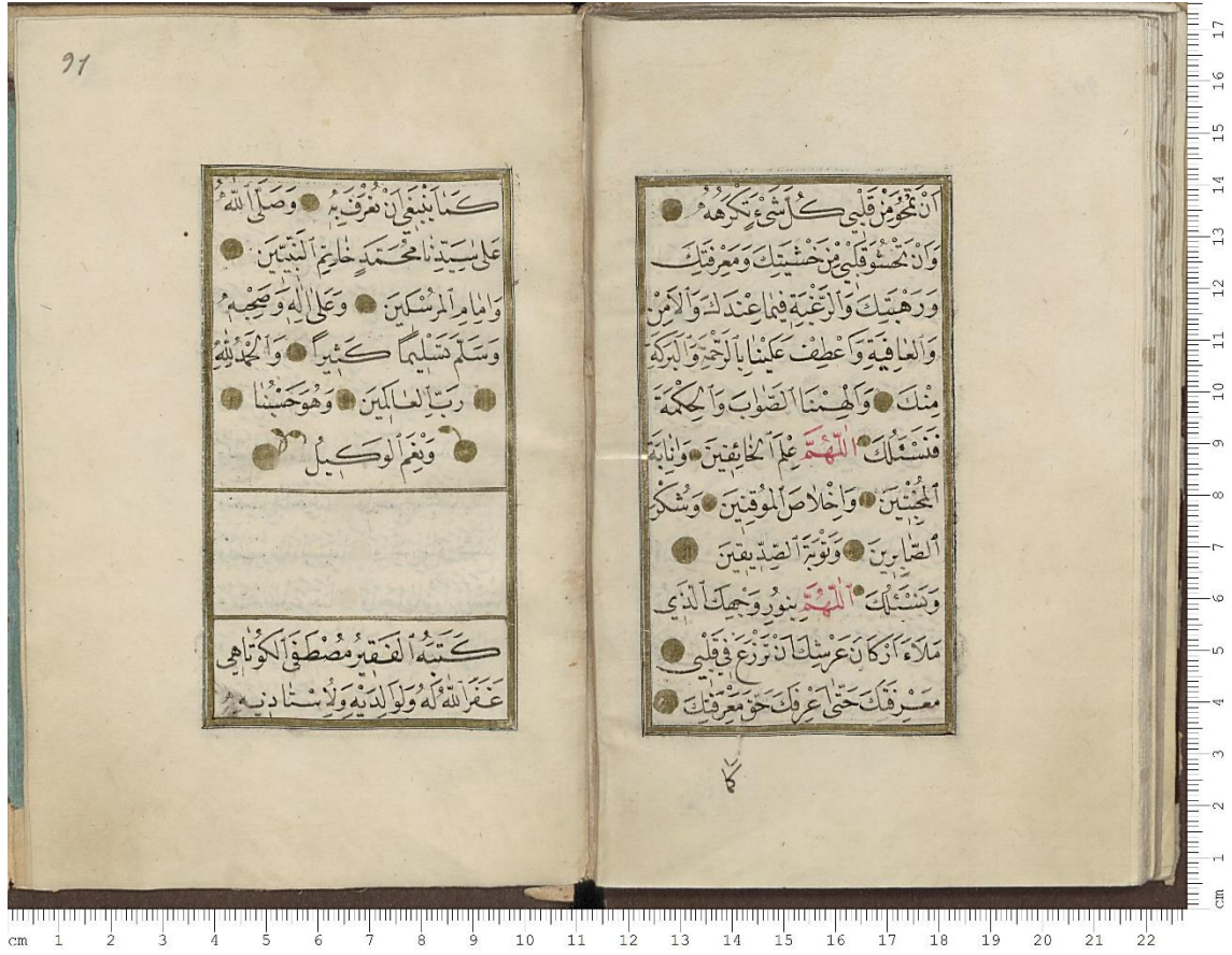
Resim 3: İstanbul Topkapı Sarayı Müzesi Kütüphanesi H.S. 74 Delâilü'l-Hayrât Ketebe Sayfası (90b-91a)