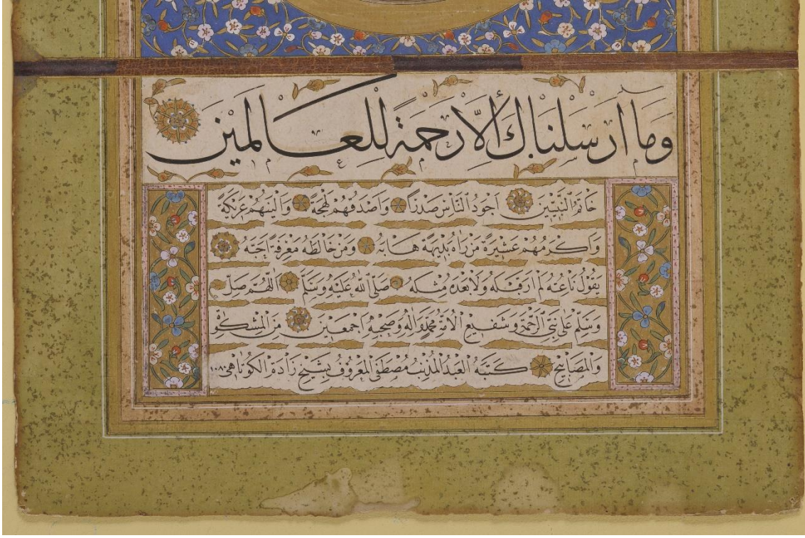
Resim 8: Tarihsiz Hilye-i Şerîfe Âyet, Son Makam ve Ketebe Kısmı