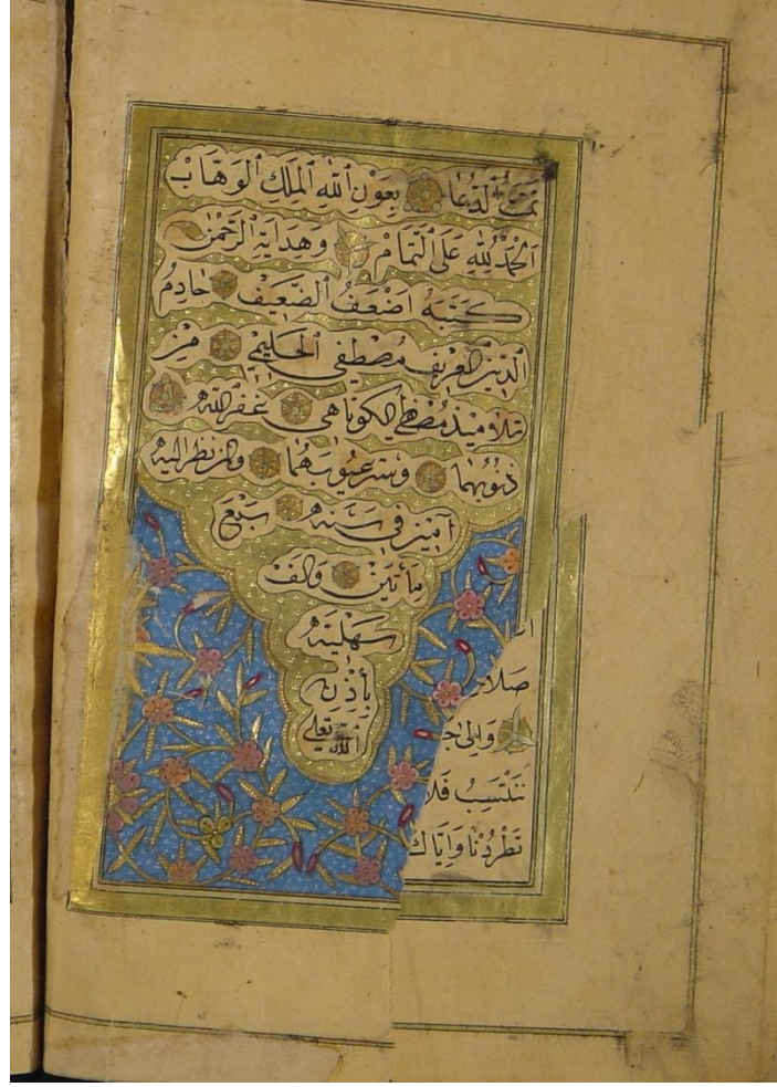
Resim 1: Mustafa Kütâhî'nin talebesi Mustafa El-Halim'in yazmış olduğu Delâilü 'l-Hayrât