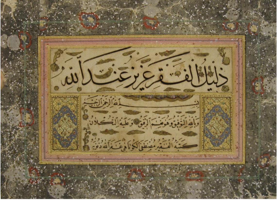
Resim 5: İstanbul Millet Kütüphanesi