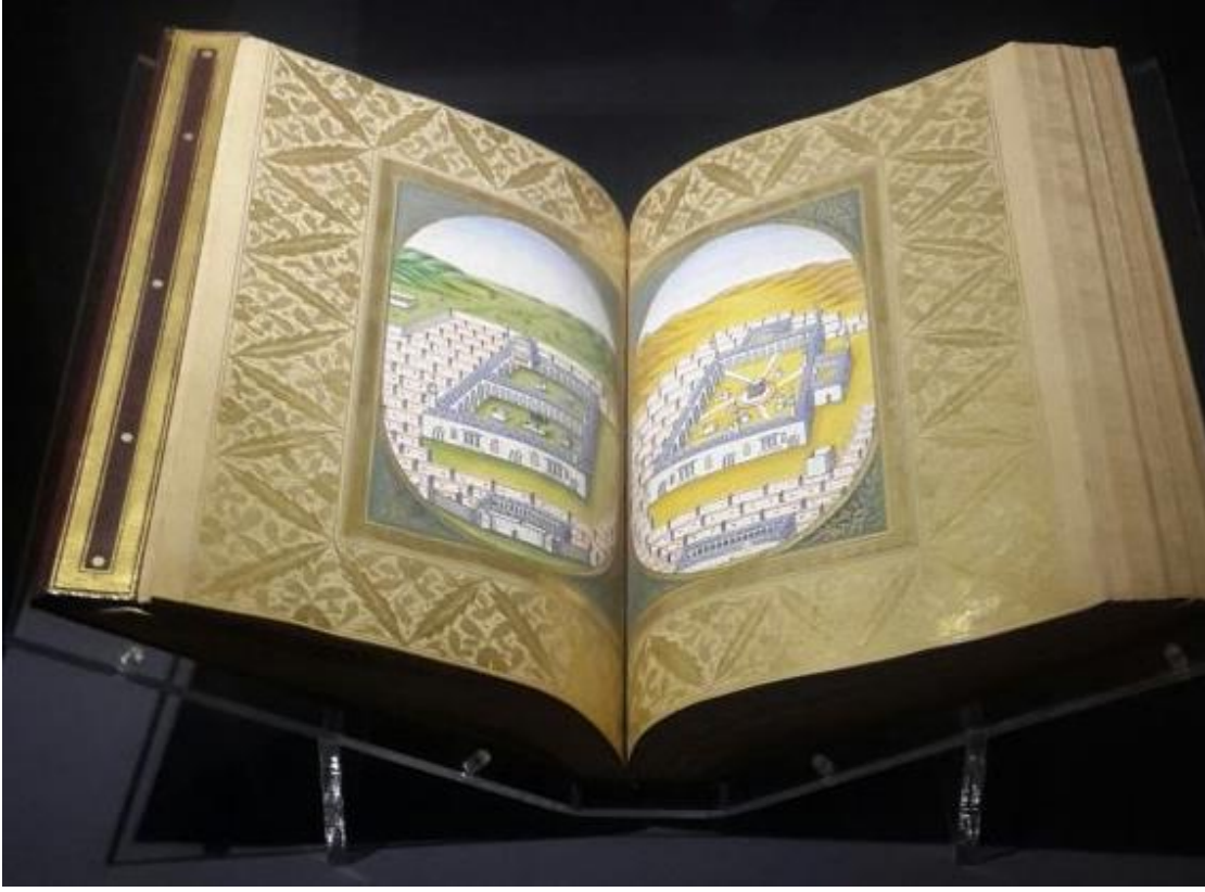
Resim 4 : İstanbul Türk – İslam Eserleri Müzesi Kütüphanesi 1441 Delâilü'l- Hayrât Mekke – Medine Minyatürleri