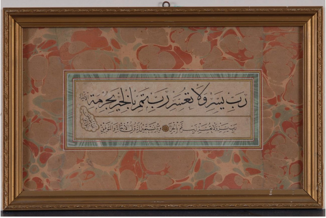
Resim 6: Emin Barın Koleksiyonu