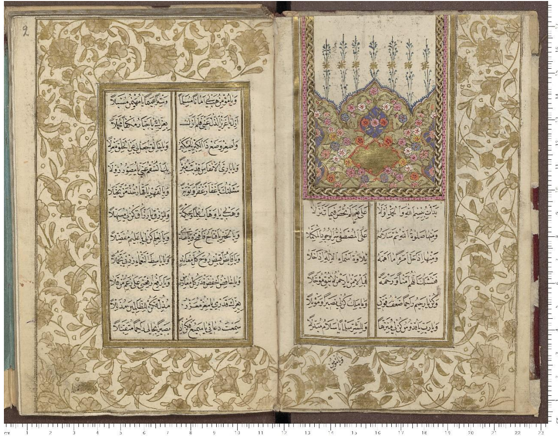
Resim 2: İstanbul Topkapı Sarayı Müzesi Kütüphanesi H.S. 74 Delâilü'l-Hayrât Serlevha Sayfası (1b-2a)