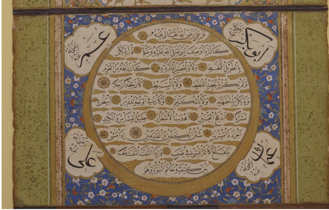
Resim 7: Tarihsiz Hilve-i Şerîfe Baş Makam ve Göbek Kısmı