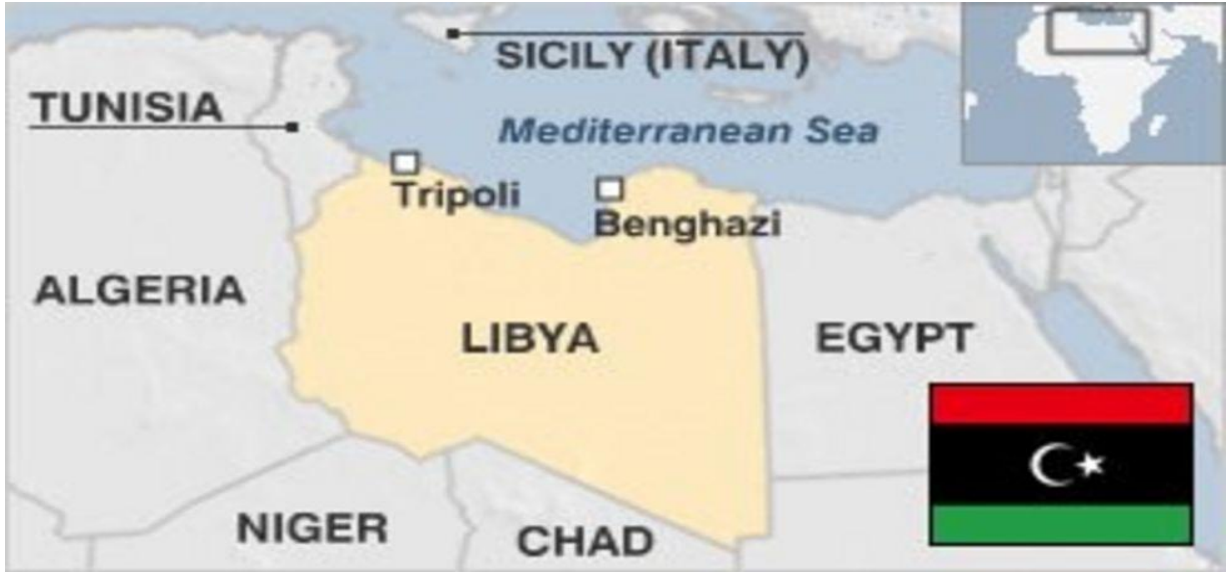
Şekil 1: Libya'nın Konumu ve Komşu Ülkeler

Libya'nın 24 Aralık 1951'de Birleşmiş Milletler (BM) tarafından bağımsızlığı tanınmıştır. Libya BM'ye üye olduğunda dünyanın en fakir ve en az gelişmiş ülkelerinden biriydi. O zamanlarda nüfusu 1,5 milyondan fazla değildi ve nüfusunun %90'ından fazlası okuma yazma bilmiyordu. Bu sebeple Libya'da siyasi bilgi ve deneyim geleneği de oluşmamıştı. Libya'nın bağımsızlığından önce ülkede herhangi bir üniversite yoktu, sadece sınırlı sayıda lise kurulmuştu (Aghayev, 2013: 139). Fakat Libya, eski ve köklü bir tarihe sahip olduğu için (BBC News, 2021) bu olumsuzlukların üstesinden gelinmiş ve zengin yeraltı kaynakları ile ülkenin kaderi değişmiştir. Şekil 1'de Libya'nın jeopolitik konumu ve komşu ülkeleri gösterilmiştir. Libya küresel siyasette büyük önem arz eden bir ülkedir.