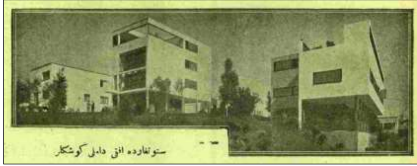
Görsel 9. Kazım Sevinç'in metninde yer verdiği resmin altyazısı: "Stuttgartda ufki damlı köşkler"