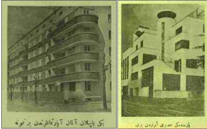
Görsel 5. (sol) Berlin'de Erich Mendelsohn tarafından tasarlanan Ekspresyonist balkonları ile dikkat çeken bir apartman. Kazım Sevinç'in metninde yer verdiği resmin alt yazısı: "Yeni yapılan Alman apartmanlarından bir numune"

Hollanda modern mimarlığında, Fransa'dan farklı özelliklere dikkat çeken Kazım Sevinç (1928:11), mimar Cramen'in Kristal Palas'ında "geniş köşe dönüşünün yuvarlaklığının" (Görsel 7) ve Utrecht tren garının "yükseldikçe geri çekilip dikdörtgen bir kule ile sonlanmasının" altını çizmiştir. Yazarın, Hollanda moderninde varolan ekspresyonist tavrı ve yatay düşey zıtlığının tasarımlara taşınmasını metninde aktarması önemlidir. Kazım Sevinç (1928:11, 12) "ultramodern" tanımıyla, konik biçimlerle özgün tasarımlar ortaya konulan ekspresyonist eserleri tartışır: Özellikle, alev biçimine referans veren forma sahip İsviçre'deki bir fabrikaya, örnek olarak yer vermesi dikkat çekicidir (Görsel 8). Yazarın, ultramodern olarak anlattığı tutum, Hollanda moderninde detaylarda ve köşe dönüşlerinde görülen sınırlı dinamizmden farklı olarak kütle biçimini doğrudan belirleyen özgür bir dinamizmi ortaya koymaktadır.