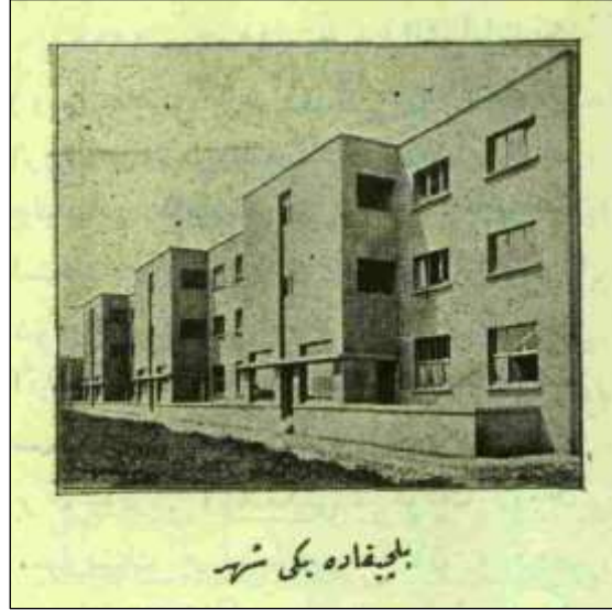
Görsel 1. Halil Vedad'ın yeni şehir örneği olarak yazısında kullandığı bir görsel. Resim alt yazısı: “Belçikada yeni şehir”