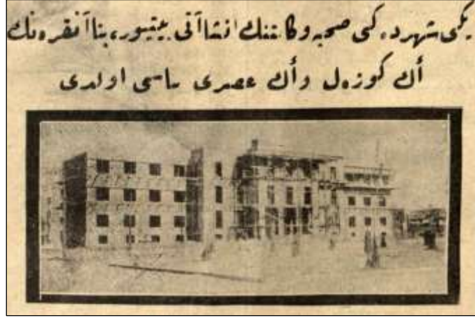
Görsel 2. Hâkimiyet-i Milliye Gazetesinin 4 Temmuz 1927 tarihli sayısında yer alan Sıhhiye ve Muavenet-i İctimaiye Vekâleti binasının fotoğrafı. Resim üst yazısı: “Yenişehirdeki Sıhhiye Vekâletinin inşâatı bitiyor, bina Ankaranın en güzel ve en asrî binâsı oldu”

Daha önce de belirtildiği üzere, “asrî mimarının”, “modern başkent” neye karşılık geldiği Alaettin Bekir’in metninde açıklanmamıştır. Buna karşılık, metin içinde kullandığı görseller dönemin Alman mimarlık eserlerine ait olup asrî mimarlıkla ne anlatmak istediğine dair en güçlü referansı vermektedir: Kilise, okul, konut, kütüphane gibi farklı işlevlere dair örnekler arasında Karl Hofmann ve Felix Augenfild’in Lichtenstein sarayının iç mekânlarındaki modern ve yalın dekorasyon ( Görsel 3 ) ile Oskar Strand’ın Viyana’daki apartmanı dikkat çekmektedir (Alaeddin Bekir, 1928: 9).