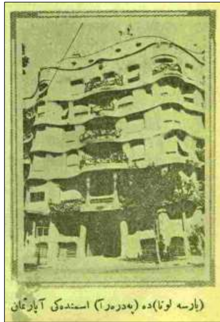
Görsel 4. Önemli Art-Nouveau örneklerinden biri olan Antoni Gaudí'nin Barselona'daki Casa Mila (La Pedrera) Binası. Kazım Sevinç'in metninde yer verdiği resmin alt yazısı: "(Barselona)da (Pedrera) ismindeki apartman"