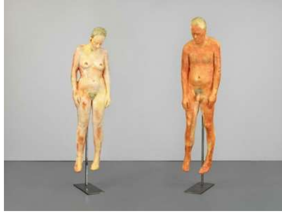
Görsel 6. Kiki Smith, İsimsiz , 1990, Balmumu, 198,1 × 181,6 × 54 cm.

Smith’ in 1990 tarihli balmumu heykeli (Görsel 6) biri kadın biri erkek iki figür metal çubuklar üzerinde asılı durmaktadır. Figürler bir ceset ağırlığında bedenlerinin ağırlığıyla sarkmaktadır. Kadın figürünün göğsünden akan su damlaları erkek figürde ise meni akmaktadır. Metal çubuklara asılı bu iki ceset, aynı zamanda da bedeninin yaşam veren sıvılarını da barındırmıştır. Sanatçı bedeni, faniliğe ve yaşama beşiklik eden bir alan olarak yansıtmayı başarmıştır.