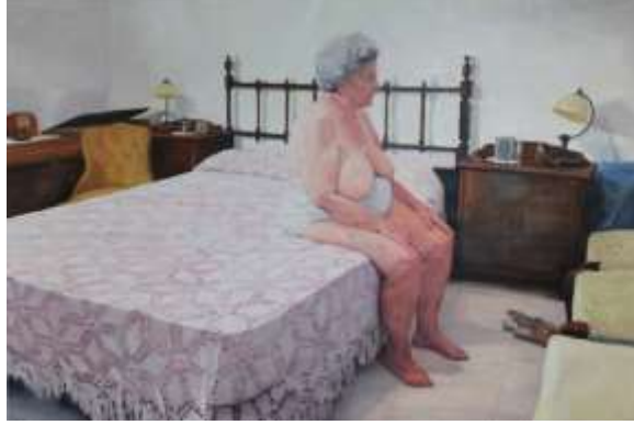
Görsel 11. Virginia Bersabe, Uçurumun kenarında , 2017, Tuval üzerine yağlıboya, 150 x 220 cm.

Çalışmalarında fotoğraf, video ve kolaj tekniklerini kullanan Polonyalı sanatçı Magda Hueckel (1978) ise Obsesif Otoportreler (2006) adlı eserinde insan bedeninin kaçınılmaz yok olma korkusunu kendi bedeninden görüntüleri çürüten meyve ve bitki görüntüleri ile birleştirerek beden sonunu estetik bir dil ile ifade ederken hoşlanılmayan bu duyguyu barışmamızı sağlamıştır (Görsel 12). Sanatçı on yıl sonra Obsesif olmayan Otoportreler (2016) adlı eserini üretmiştir. Bu eser ise ilkinin aksine beden iyileşme ve kendini onarma sürecine işaret etmiştir. Eserde yer alan beden görüntüleri aydınlık ve net bir şekilde olması da beden iyileşme sürecini yansıtmıştır ( http-3 ).