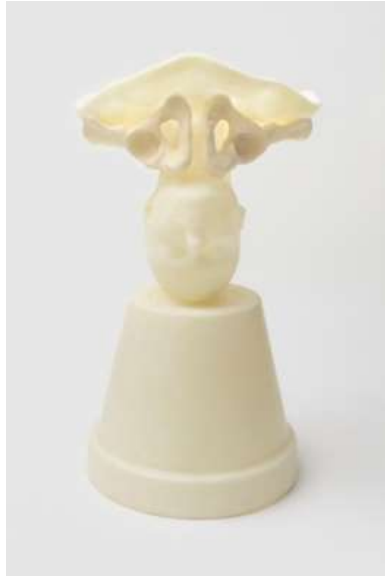
Görsel 9. Janine Antoni, Kanal , 2015, Poliüretan Reçine, 68,6 x 38,1 x 38,1 cm.

Bu heykelde Antoni' nin büstü bir kaba oyulmuş ve bir saksıyla kaynaşmıştır. Saksının deliği ile yumuşak zar arasında bir geçiş yolu oluşturan iki kap, bir kum saati olmak üzere birleşir. Göbek bağı gibi, bu geçiş yolu bir damarı diğerine bağlar diye ifade etmektedir (http-2). Antoni bedenin fizyolojik yapısıyla insan bedeninin deneyimlerini birleştirerek bedenin görünmeyen tanıklıklarını gözler önüne sermektedir.