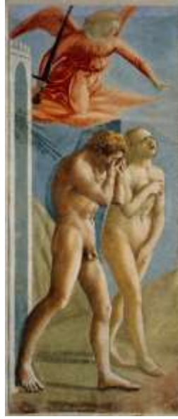
Görsel 1. Masaccio, Yeryüzü Cennetinden Kovulmuş Olan Adem ile Havva (Ayrıntı) , 1425, Fresk, Santa Maria Del Carmine Kilisesi, Brancocci Şapeli'nin Freskosundan, Floransa.