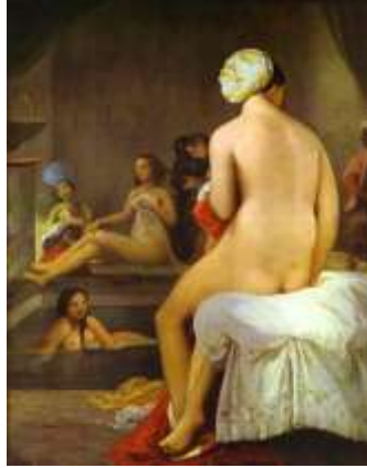
Görsel 4. Jean Auguste Dominique Ingres, The Valpinçon Bather , 1808, Tuval üzerine Yağlı boya, 146 x 97,5 cm, Louvre, Paris.

19. yüzyılın ilk çeyreğinde ise çıplak beden hala önem taşımaktadır. Çıplaklık kadın ve güzellik ölküsü ile örtüşmüştür. Fransız ressam Jean Auguste Dominique Ingres, çıplak kadını 19. yüzyıl sanatının merkezine yerleştirerek, akışkan, eklem hatlarının yumuşatılmış ve anatomik kurallara uymayan kadın bedeni tasvirlerinde arzunun temsilleri yatmıştır (Leppert, 2020:116).