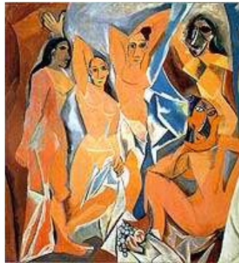
Görsel 5. Pablo Picasso, Avignonlu Kızlar , 1907, Tuval üzerine Yağlı boya, 243.9 × 233.7 cm. Museum Of Modern Art, New York.

Batının katı kurallarını reddeden sanatçılar yüzünü ilkel olarak adlandırılan sanata çevirerek, Afrika kabilelerinin maskları ve putlarına yönelerek sanatın kuralsız bu haline yönelmişlerdir. Avrupa sanatında ki doğaya bağlılık ve ideal güzellik gayesini geride bırakmak isteyen bu sanatçılar estetik kaygı gütmeyen üreten bu zanaatkâr anlayışa hayranlık duymalarına neden olmuştur (Farthing, 2014: 343). Belli kurallara dayanmayan tamamen içgüdüsel yapılan bu eserlerle sanattaki idealizm anlayışına karşı durmada önemli bir ilham kaynağı olmuştur. Modern sanatın içinde akla ilk gelen beden deformasyonu olarak Picasso’yu örnek verebiliriz. Picasso Barselona’da kötü şöhretli bir geneleve gönderme yapan Avignonlu Kızlar (1907) adlı eseri modern sanatın temsili olarak görülmüştür (Görsel 5). Eserin o güne kadar yapılmış tüm yenilik çabalarının üstünde radikal bir şekilde sanatta ki kurallardan kopuşu temsil etmektedir.