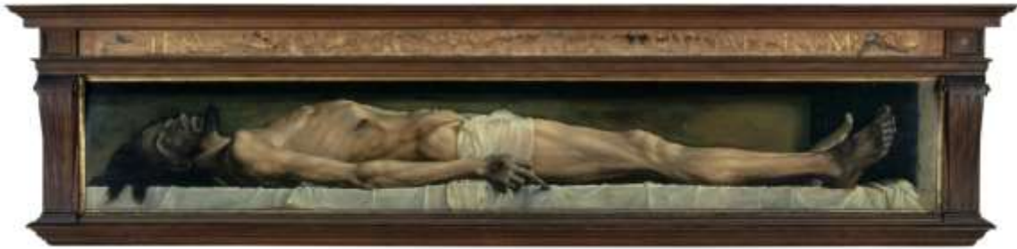
Görsel 3. Hans Holbein, Ölü Mesih , 1521, 30,5x 200 cm., Kunstmuseum, Basel.

Beden Hristiyanlık geleneğinde ise uyumu ve güzelliği temsil etmiştir. Tanrı yaratılmışların en güzeli olan Mesih İsa'nın suretini oluştururken, biçimsiz görüntüsüyle şeytani bedenler çirkinlikle bağdaştırılmıştır. Hristiyanlığın cisimleştirilmiş Tanrı temsili ile beden in faniği gerçeği ile bozulmuştur. Bedenin güzelliği canlı tazeliğiyle örtüşürken, ölümle çürüyen ve bozulan beden ile çelişmiştir (Görsel 3).