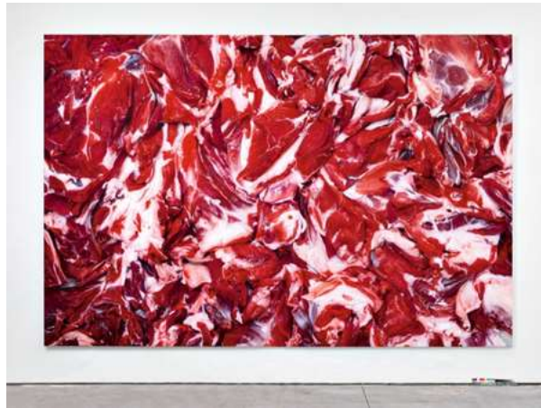
Görsel 8. Marc Quinn, Et Resmi (Homeoplatik Beslenme) , 2013, Tuval Üzerine Yağlıboya, 279x419 cm.

Kiki Smith gibi yerleştirme, heykel ve resim çalışmalarında kimlik, genetik ve beden konularını ele alan İngiliz sanatçı Marc Quinn (1964) Sanatçını Et Resmi adlı serisinde (Görsel 8) “maddeselliğin en inkar edilemez biçimi olan ‘et’ in resme girişiyle birlikte beden, paradoksal bir biçimde, kendi konturlarının yokluğunda çözünür” (Ansen, 2014:9). Quinn’ in beden mahremine girerek teşhir ettiği içsel gerçeklik, ilk bakışta insan da şok etkisi uyandırsa da, devasa ebatlı bu resimler yarattığı kırmızı rengin şiddetli ile oluşturulmuş soyut bir kompozisyon düzenlemesi gibi görülmeye başlamaktadır.