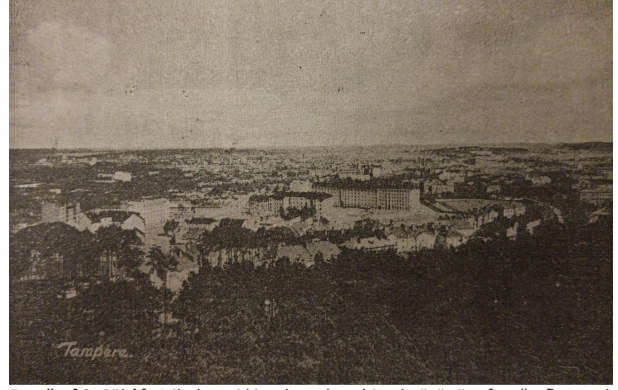
Fotoğraf 3. Şükûfe Nihal, gezi kitaplarında şehirselsel görünüm fotoğraflarına da yer vermiştir (Tammerfors şehri), (Nihal, 1935).

Photo 3. Şükûfe Nihal also provided photographs of the urban panorama in her travel books (the city of Tammerfors), (Nihal, 1935).