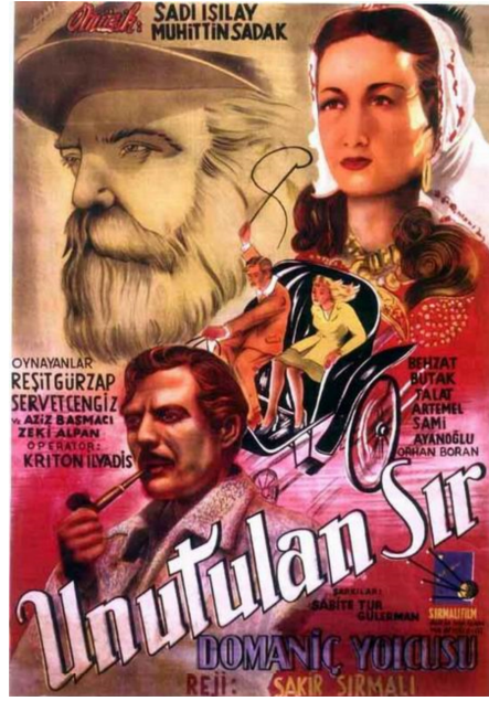
Şekil 3. "Domanıç Dağlarının Yolcusu" adlı gezi romanından sinema uyarlanan filmin afişi (Türk Nostalji, web, 2016).

Şükûfe Nihal Türk tarihinin siyasî, edebî ve kültürel bakımlardan önem taşıyan bir geçiş döneminde öncü aydınlardan birisi olmuştur. Yaşadığı dönemde modern ve ilerici fikirleriyle Cumhuriyet Dönemi Türk Edebiyatı ve siyasî hayatında izler bırakan Şükûfe Nihal, Cumhuriyetin kuruluş felsefesini ve değerlerini savunan, güçlü vatansever duygu ve mücadelesi, kadın hakları savunucusu olarak dikkat çeken idealist bir aydındır. Şükûfe