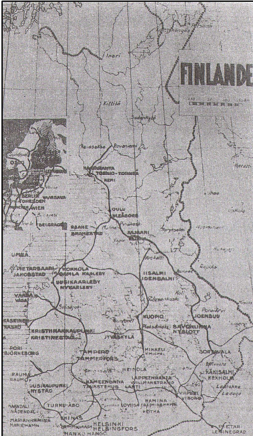
Şekil 1. Şükûfe Nihal’in gezi kitabında yer alan Finlandiya haritası (Nihal, 1935). Figure 1. The map of Finland in the travel book of Şükûfe Nihal (Nihal, 1935).

Şükûfe Nihal yaşamı boyunca yurdun birçok kesimine gezilere yapmış, çeşitli gazete ve dergide yurt gezilerine dair izlenimlerini yayımlamıştır (Tablo 1). Bu gezilerin yazarın sanatı için zenginleştirici bir malzeme teşkil etmenin ötesinde, ideallerini örneklerle seslendirme imkânı da sağlamıştır (Eroğlu, 2008).