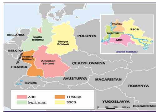
Harita 5: İç içe geçmiş harita örneği (D Yayınevi).

Haritaların tarih konularının öğretiminde kullanılmalarında karşılaşılan bir diğer sorun ise öğrencilerin haritalardan nasıl faydalanacaklarına yönelik yeterli bilgiye sahip olmamalarıdır. Her ne kadar literatürde harita ile ilişkili eğitimin coğrafya eğitimi kapsamında gerçekleştirildiği (Liben, Kastens & Stevenson, 2002, s. 268) ifade edilse bile, Türkiye'de coğrafya eğitiminin lise düzeyinde yapılması, ilkökulda başlayan ve 6. sınıf sosyal bilgiler dersinin "Yer Yüzünde Yaşam" adlı 2. ünitesinin, "Konuşan Haritalar" konusu içerisinde haritaların özellikleri ve öğrenme sürecinde onlardan nasıl faydalanılacağına yönelik bilgilere yer verilmesine yol açmıştır (Karabıyık, 2016). Fakat bu ünite de verilen bilgilerin bu çalışma kapsamında