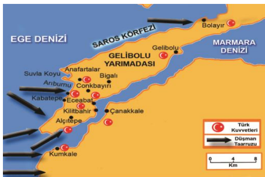
İtilaf Devletlerinin Gelibolu Yarımadası'na taarruz planı (Nisan 1915)