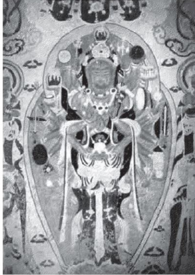
Fig. 1. Thousand-armed, thousand-eyed Guanyin. Late tenth century. Yulin, Gansu, Cave 39, main room passageway, south wall. Mural painting. (After Dunhuang 1997, pl. 105.)

Avalokiteşvara onu diğer bodisatvalardan ayıran el, beden hareketleri, baş ve kol sayıları ve ellerinde tuttuğu objeler ile farklı şekillerde tasvir edilmiş ve bu tasvirler onun Budist sanatta farklı adlarla anılmasına sebep olmuştur. C. Bhattacharya-Haesner tarafından incelenen ve sınıflandırılan Berlin Turfan Koleksiyonundaki tapınak bayraklarının toplam sayısı 148 olup bunların 80 tanesini Avalokiteşvara'nın bu farklı ikonografileri oluşturur (Kasai 2022: 260-261). Uygurların Turfan'da Budizm'i yoğun olarak kabul ettikleri X.-XII. yüzyıllar arasında ise 24 tapınak bayrağından 11 tanesi bin kollu, bin gözlü Avalokiteşvara ikonografisine sahiptir. Dunhuang'da Avalokiteşvara temalı duvar resmi geleneği Uygur döneminde de devam etmiş ve Kansu Uygurları tarafından X. yüzyıl sonu- XI. Yüzyıl başında yapıldığı tespit edilen Yulin 39 numaralı mağarada Avalokiteşvara merkezi bir kompozisyonla çok kollu bir şekilde, etrafında bodisatvalıktan ayrı bir yol izleyen çileci Budist ermişler (Skr. luohan ) ile beraber resmedilmiştir (Gridley 2011: 156-158, Resim 5 ).