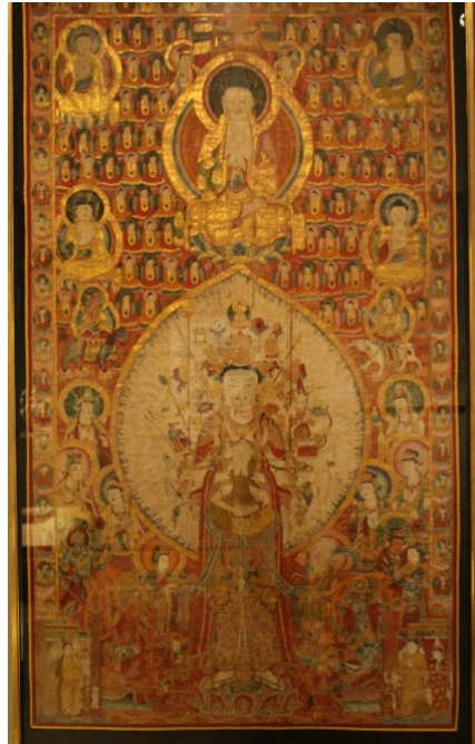
Resim 7 Bin Kollu Avalokiteşvara, Pamuklu Kumaş Üstüne Yıldızlı Resim, Koço, X-XI. yüzyıl, Hermitage Devlet Müzesi