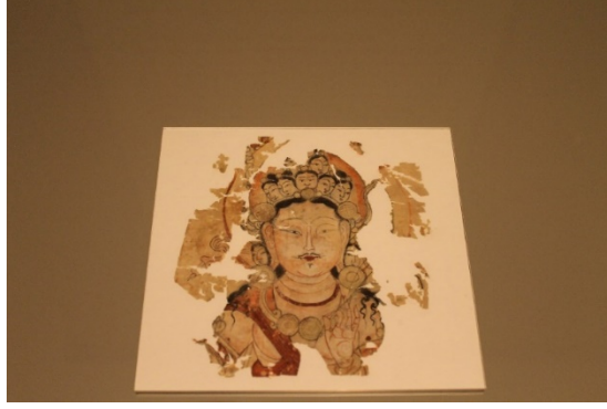
Resim 4 Avalokiteşvara, İpek Üstüne Resim, Toyuk, Yazmalar Odası, VIII.-IX. Yüzyıl, Museum für Asiatische Kunst, MİK 6534

Avalokiteşvara onu diğer bodisatvalardan ayıran el, beden hareketleri, baş ve kol sayıları ve ellerinde tuttuğu objeler ile farklı şekillerde tasvir edilmiş ve bu tasvirler onun Budist sanatta farklı adlarla anılmasına sebep olmuştur. C. Bhattacharya-Haesner tarafından incelenen ve sınıflandırılan Berlin Turfan Koleksiyonundaki tapınak bayraklarının toplam sayısı 148 olup bunların 80 tanesini Avalokiteşvara'nın bu farklı ikonografileri oluşturur (Kasai 2022: 260-261). Uygurların Turfan'da Budizm'i yoğun olarak kabul ettikleri X.-XII. yüzyıllar arasında ise 24 tapınak bayrağından 11 tanesi bin kollu, bin gözlü Avalokiteşvara ikonografisine sahiptir. Dunhuang'da Avalokiteşvara temalı duvar resmi geleneği Uygur döneminde de devam etmiş ve Kansu Uygurları tarafından X. yüzyıl sonu- XI. Yüzyıl başında yapıldığı tespit edilen Yulin 39 numaralı mağarada Avalokiteşvara merkezi bir kompozisyonla çok kollu bir şekilde, etrafında bodisatvalıktan ayrı bir yol izleyen çileci Budist ermişler (Skr. luohan ) ile beraber resmedilmiştir (Gridley 2011: 156-158, Resim 5 ).