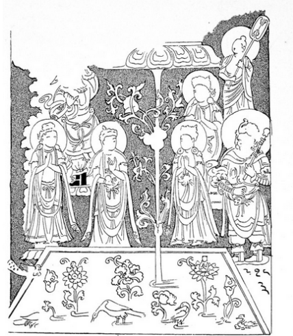
Resim 3 Dini Tören, Duvar Resmi Çizimi, Murtuk 3. Yerleşim (Grünwedel 1912, Fig. 630)

Günümüzde Mahayana Budizmi'ni sürdüren Çin'de ayrıca önemli Buda ve bodisatvaların da doğum günleri belli günlerde kutlanmaktadır. Ancak bunlardan en önemlisi, özellikle kadınlar arasında en çok sevilen bodisatva olan Avalokiteşvara'ya ilişkin (doğumgünü, aydınlanması ve rahip olarak traş edilmesi) bayramlardır (Lixin: 197-198). Ancak Uygurların bu özel günleri kutladıkları hakkında herhangi bir bilgimiz yoktur. Avalokiteşvara için yapılan törenlere ilişkin bir Budist tasvir Murtuk'ta bulunmuş olan ve Grünwedel'in ortada bir havuzdan yükselen lotus çiçeği üzerinde yer aldığı düşünülen Avalokiteşvara için yapılan tanrıçaların, Vajrapani veya lokapala ile rahiplerin katıldığı dini tören resmi (Grünwedel 1912:312-313, Resim 3 ).