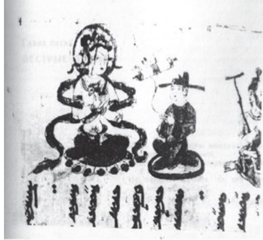
Resim 1 Avalokiteşvara ve Budist laik, Minyatür, St. Petersburg Doğu Yazmaları Enstitüsü, SI 5846 (Zieme 2012, Pict. 12)