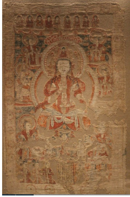
Resim 6 Avalokiteşvara Mandalası, Keten Üzerine Resim, Murtuk X.-XI. Yüzyıl, Museum für Asiatische Kunst