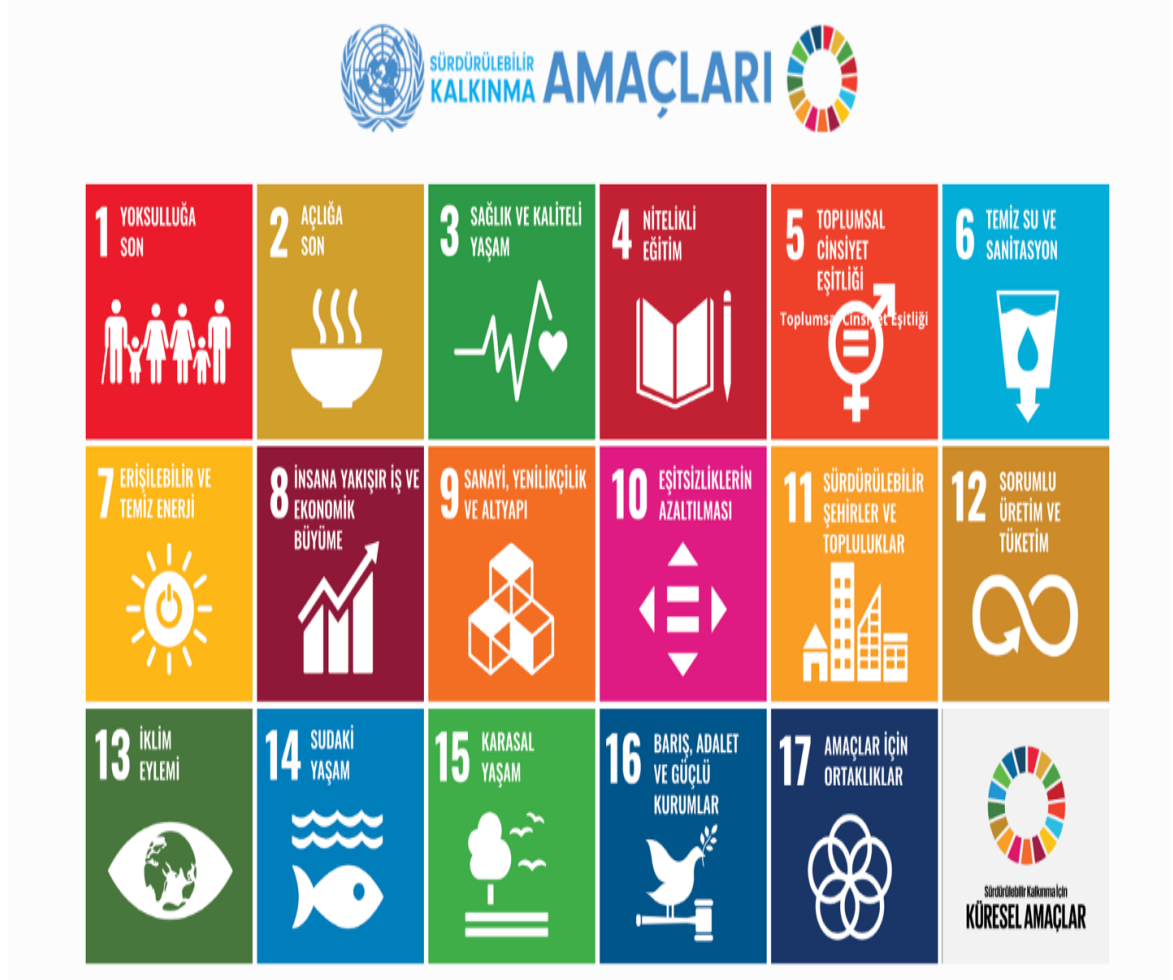
Şekil 1: Sürdürülebilir Kalkınma Amaçları 16

Küresel amaçlar bütüncüdür; yani bir amaçtaki başarı, diğer amaçlardaki ilerlemeye bağlıdır. Küresel amaçların lokomotif unsuru ise “ Toplumsal Cinsiyet Eşitliği ”dir. Bu amaç, hem 17 SKA içerisinde bir amaç olarak (amaç 5), hem de diğer 16 amaçtan 10’unun hedefleri arasında yer almaktadır. 17 SKA’lar ve tarımda kadınların güçlendirilmesine yönelik alınan hedefler ile performans göstergeleri Tablo 4’te yer almaktadır. Kadınların tarımsal arazi üzerinde mülkiyetinin olması, toprak üzerinde kontrol gücüne sahip olması ve düzenli gelir kaynaklarına ulaşması ile yoksulluğun önlenebileceğini söylemek yerinde olacaktır.