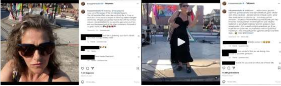
Görsel 8. Tracey Emin'in 15 Ağustos 2021 günü Instagram sayfasında yapmış olduğu paylaşım.