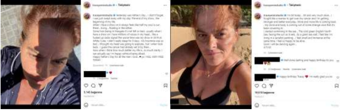
Görsel 22. Tracey Emin’in 20 Haziran 2022’de Instagram sayfasında yapmış olduğu paylaşım

zamanda büyük hissediyorum. Yaşadığım için çok mutluyum. Yakında tekrar dans edeceğim. 3/7/22” sözleriyle ifade eder (Görsel 23). Bu mesajı bu platform üzerinde 19 bin 546 beğeni ile en çok beğeni alan ve bin 944 kişinin mesaj atması ile en çok yorum yapılan paylaşımıdır (Tracey Emin Studio, 2022, Temmuz 3).