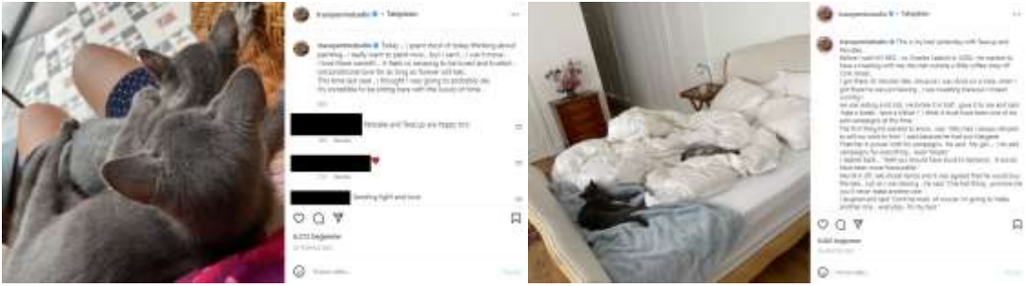
Görsel 6. Tracey Emin'in 24 Temmuz 2021 günü Instagram sayfasında yapmış olduğu paylaşım.

yapmış olduğu paylaşımda yatağının fotoğrafını paylaşır ve 2000 yılında Charles Saatchi ile Yatağım çalışmasının satışı ile ilgili yapmış olduğu toplantıyı anlatır (Görsel 7). Saatchi ile satışla ilgili el sıkışmalarının sonrasında, kendisinden bundan bir tane daha yapmayacağına dair söz vermesini istemesine cevaben, üzgünüm o benim yatağım ve bundan her gün yapmaya devam edeceğim cevabını verdiğini anlatır. Sanatçı olmanın her zaman kendin olmakla ilgili olduğunu, başkalarının senden beklediği gibi olmakla ilgili olmadığını ifade eder. Bu paylaşımında da kedileri yer alır (Tracey Emin Studio, 2021, Ağustos 18).