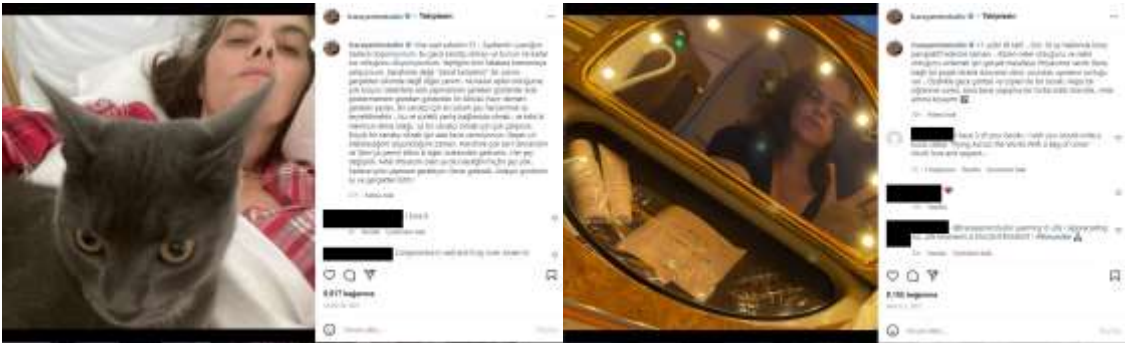
Görsel 10. Tracey Emin'in 29 Kasım 2021 günü Instagram sayfasında yapmış olduğu paylaşım.

2 Aralık 2021 günü bir otel tuvaletindeki şampuan, krem, pamuk vb malzemelerinin bulunduğu aynalı kapaklı kutudan yansımasını kullanarak özçekimini yapar (Görsel 11). 11 yıldır ilk kez tatile giderek son 18 ayını düşünmek ve anlamak için mesafeye ihtiyaç duyduğunu, kendisine bağlı bir poşet idrarla dünyanın öbür ucuna uçmanın zorluğunu anlatır (Tracey Emin Studio, 2021, Aralık 2).