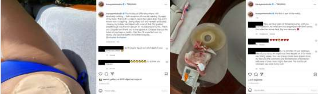
Görsel 12-13. Tracey Emin’in 13 Aralık 2021’de Instagram sayfasında yapmış olduğu paylaşım

13 Aralık 2021 tarihinde çıkmış olduğu tatil sırasında çektiği özçekiminde Emin mayoludur ve yeni hayatının bir parçası olan ürostomi torbası ile birlikte (Görsel 12). Tıbbi malzeme üreten Coloplast firmasına, kendisine geçirdiği ameliyat sonrası konforlu bir hayat sunduğu için teşekkür eder. Beyin sisi nedeniyle odaklanma güçlüğü çektiği ve uzun yıllardır okuyamadığı kadar kitap okuyabildiği için mutludur. Mesajı ile hayatının her gün daha iyiye gidiyor olduğunu, iyimser ve umutlu psikolojisini hissettirmektedir (Tracey Emin Studio, 2021, Aralık 13). Yine aynı gün bir başka “Ve bu da gerçekliğin bir parçası” (And this is part of the reality) mesajıyla paylaştığı fotoğrafında, Emin’in artık hayatının vazgeçilmez bir parçası haline gelen pansuman malzemeleri, diş fırçası ve macunu ile hastalığı sonrasında hayatının gerçekliği olmak durumunda kalır (Görsel 13) (Tracey Emin Studio, 2021, Aralık 13).