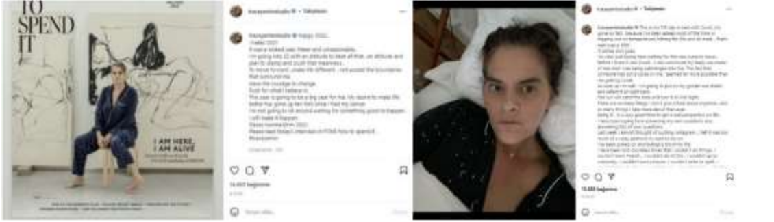
Görsel 16. Tracey Emin'in 8 Ocak 2022'de Instagram sayfasında yapmış olduğu paylaşım.

pişmanlığı olmadığını, 15 yaşında evden ayrıldığını ve o tarihten beri savaşın içinde olduğunu söyler (Tracey Emin Studio, 2022, Ocak 30).