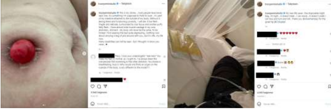
Görsel 14. Tracey Emin'in 20 Nisan 2022'de Instagram sayfasında yapmış olduğu paylaşım

kullanımlık gece çantası...Hafif, sızdırmıyor...Hareket edebiliyorum...Kokmuyorum. Dönüp yuvarlanabilirim. Teşekkürler.” demektedir (Tracey Emin Studio, 2022, Haziran 1).