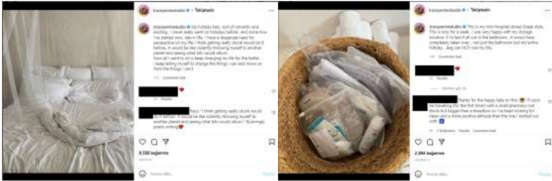
Görsel 20. Tracey Emin'in 26 Mayıs 2022'de Instagram sayfasında yapmış olduğu paylaşım

1 Haziran 2022 tarihli paylaşımında bir hafta süresince kullanmak durumunda kaldığı tıbbi malzemeleri koymuş olduğu banyodaki sepetin fotoğrafı görülmektedir (Görsel 21). Emin'in sık sık vurguladığı üzere hayatının bir parçası olan bu hastalığın, hayatına hükmedemeyeceğinden bahseder (Tracey Emin Studio, 2022, Haziran 1).