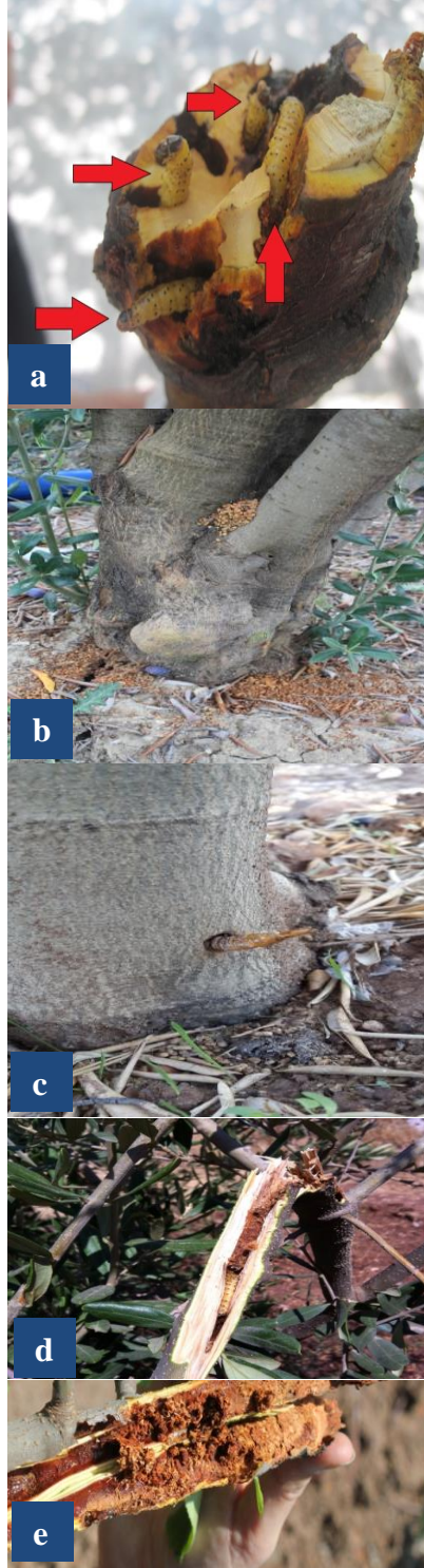
Şekil 3. Zeuzera pyrina 'nın a) larvasının gövdedeki galerileri b) beslenme artığı c) pupa kılıfı, d) kırılma zararı e) larvasının ince dallardaki galerileri

Figure 3. Z. pyrina 's a) larvae galleries in the trunks, b) feeding waste, c) pupal case, d) harm of branch breaking, e) larvae galleries in thin branches