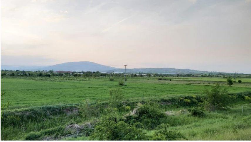
Fotoğraf 1. Çayır Ova / Çayır Ovası Adı Verilen Güherçile Üretilen Sahanın Günümüzdeki Hali / Üsküp Havalimanı'ndan Vardar Ovası'nın Görünümü*