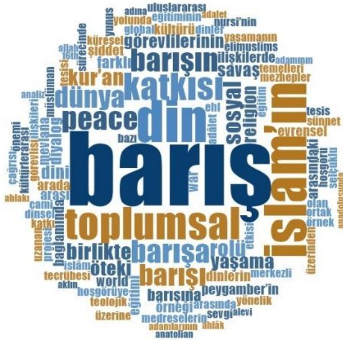
Şekil 1: Çalışma adlarında kelime sıklığı analizi kelime bulutu görünümü

Tablo 10 incelendiğinde sırasıyla barış (96 defa), din (47 defa), toplumsal (29 defa), küresel (22 defa) ve katkı (18 defa) kavramları ile aynı köke sahip ya da eş anlamlı kelimelerin en çok kullanılan kavramlar olduğu görülmektedir. Bu durum, yapılan çalışmalarda dinin toplumsal barışa ve evrensel barışa katkısı konularının ağırlıkla işlendiğini ortaya koymaktadır. Başlıklarda en az 4 defa geçen kelimelere tabloda yer verilmiştir.