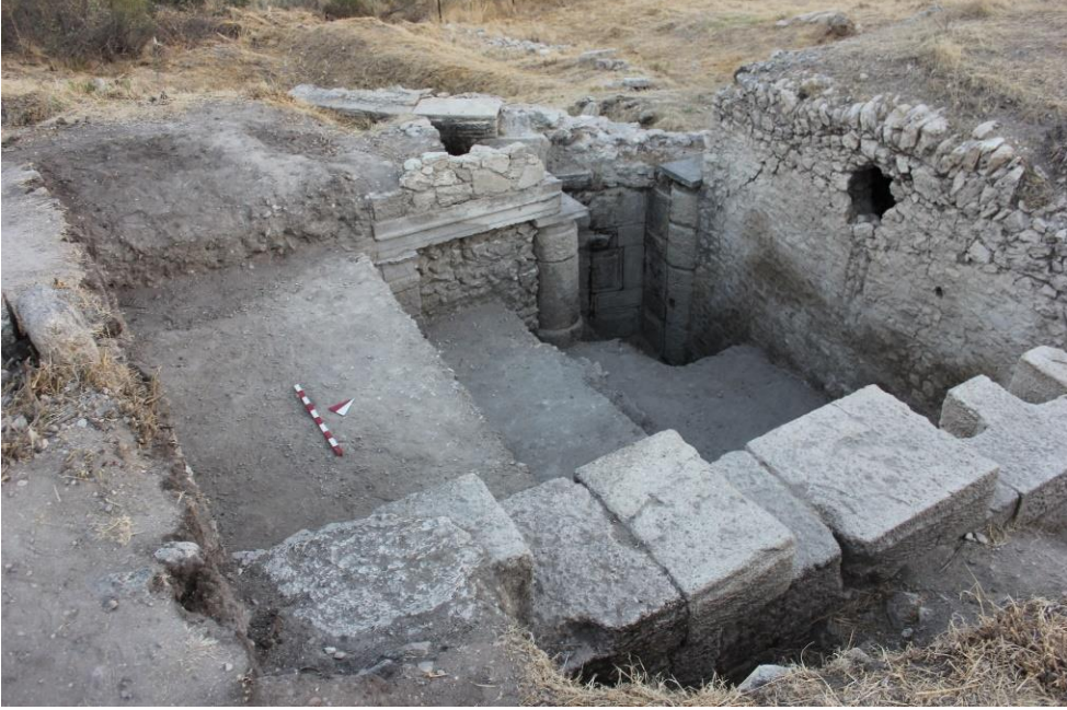
Levha 1a- HS Sektörü 2014 Yılı Kazısından Bir Görünüm.