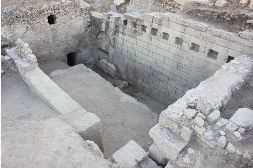
Levha 1b- HS Sektörü 2015 Yılı Kazısından Bir Görünüm