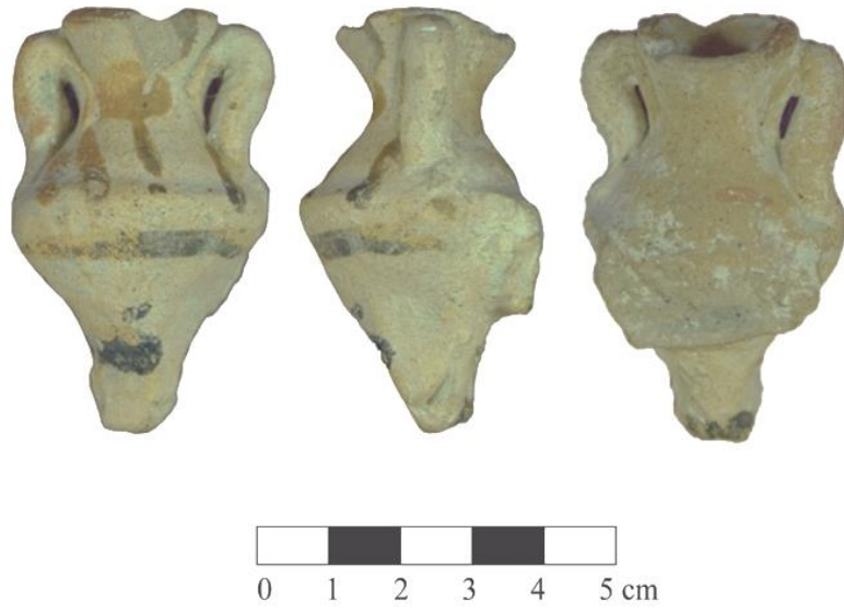
Res. 3: Myra'dan bulunan Kernos parçasının ön, yan ve arka yüzü