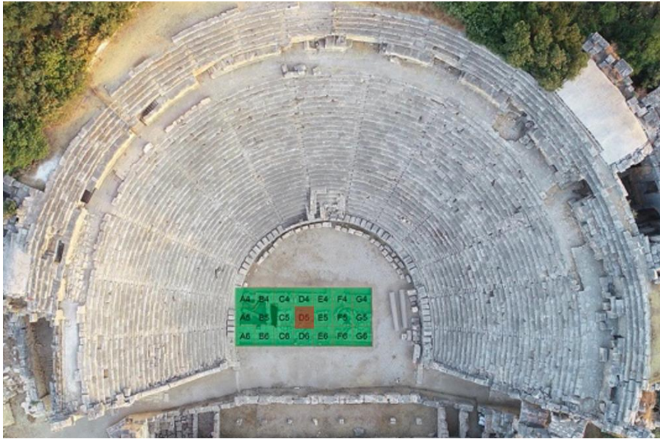
Res. 2: Myra Tiyatrosu Orkestrası Kernos Parçasının Bulunduğu Alan