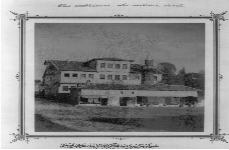
Kazancızâde Emîn Edîb'in muallimlik yaptığı ve Tuhfe-i Hulûsiyye adlı eserini yazdığı Sivas Askerî Rüştiyesi'nin dışardan görünüşü.