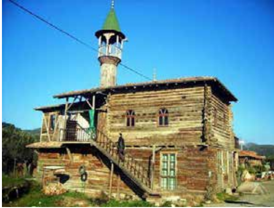
Resim 1: Caminin Edremit'teki durumu.