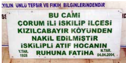
Resim 2: Caminin Kitabesi

( http://www.sabah.com.tr/galeri/turkiye/turkiyenin-en-gezgin-camisi/17 ; 22.05.2016)