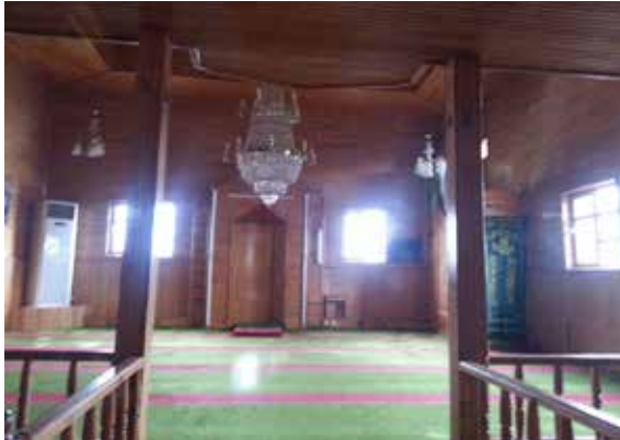
Resim 5: Marangozlar Camii'nin harimden görünümü