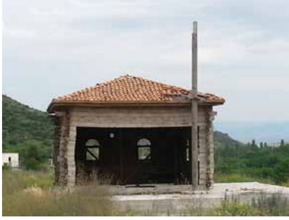
Resim 3: Aynı Caminin İskilip'teki son hali