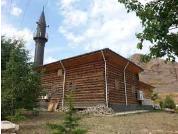
Resim 4: Marangozlar Camii'nin kuzeydoğu cepheden görünümü