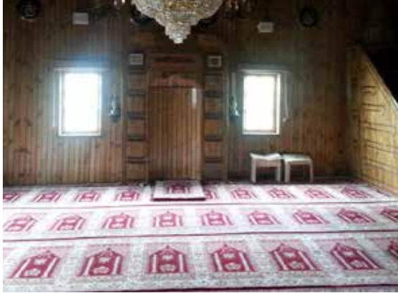
Resim 10: Tavukçuhoca Camii'nin harimi