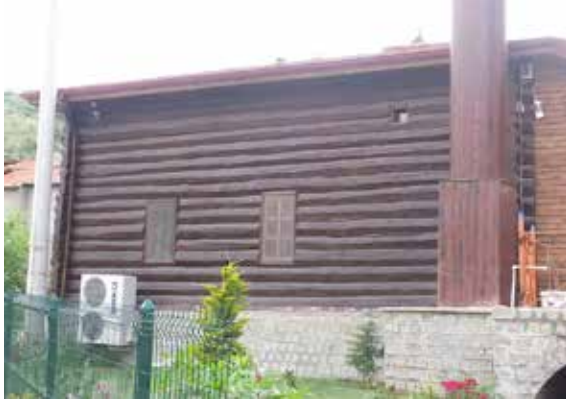
Resim 7: Tavukçuhoca Camii'nin doğu cephesi