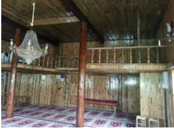
Resim 9: Tavukçuhoca Camii'nin harimi