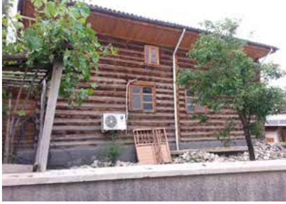
Resim 6: Marangozlar Camii'nin güney cepheden görünümü