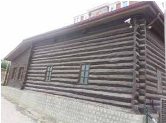
Resim 8: Tavukçuhoca Camii'nin batı cephesi