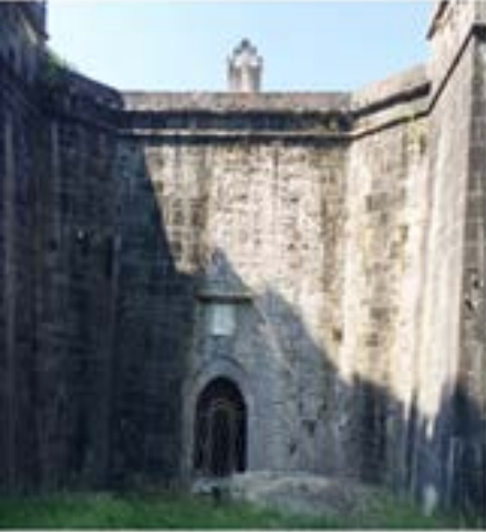
Vâlîde Bendi, ön cepheden görünüş