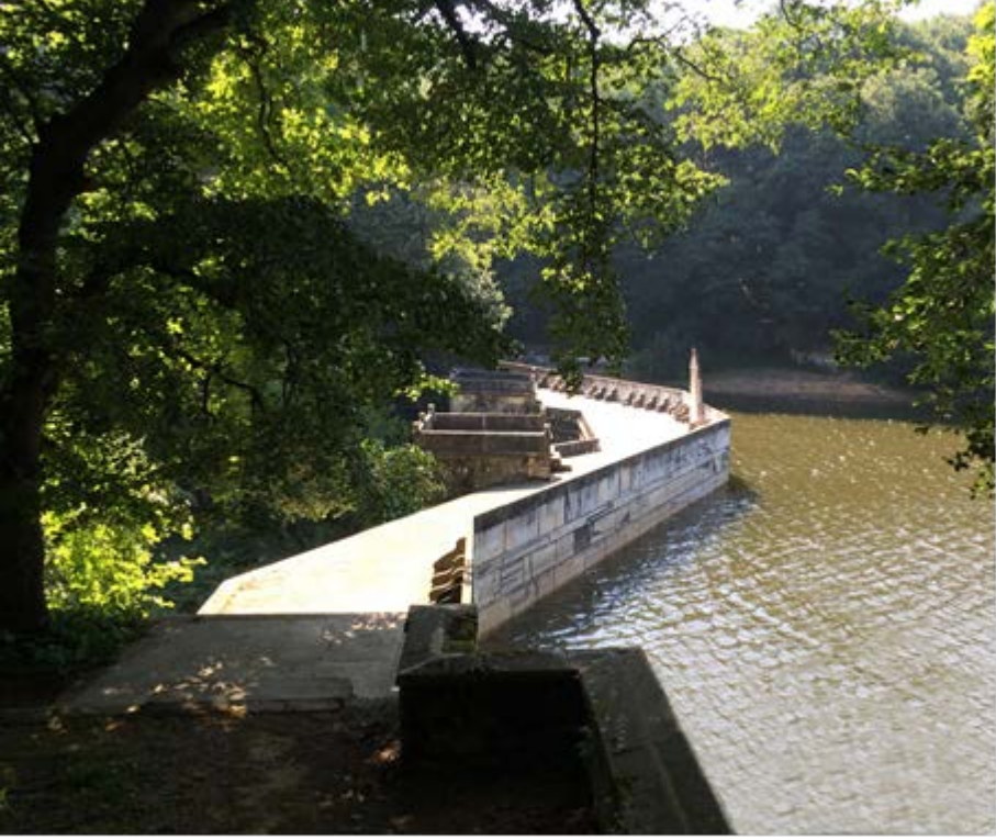
Vâlîde Bendi