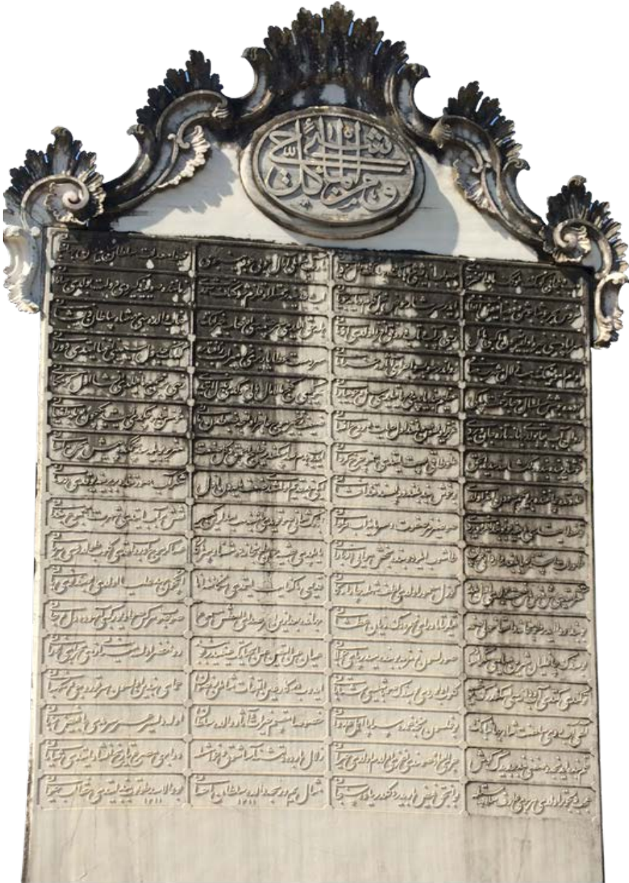
Vâlîde Bendî'ne Ait Kitâbe