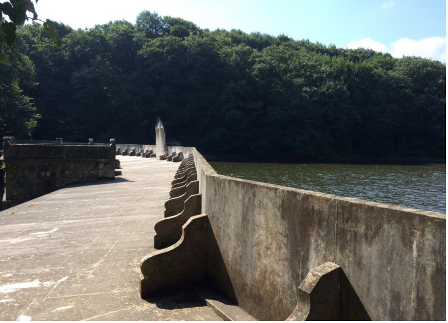
Vâlîde Bendi