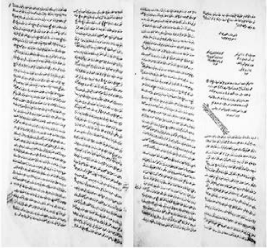
Vâlîde Bendî'ne Ait Vakfiye (VGMA, 636-71-2)