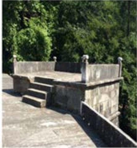
Vâlîde Bendi, Namazgâh