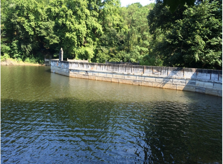
Vâlîde Bendi (, 10.07.2015)