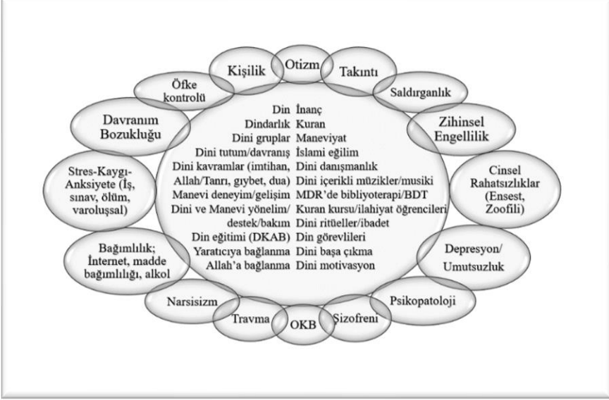
Şekil-4: Din ve psikopatoloji ilişkisini konu alan makaleler (2010-2022)

Yapılan tez ve makalelerin dışında din ve psikopatoloji alanında yapılan çalışmalarda kitaplar, kitap bölümleri, bildiriler ve ansiklopedi maddeleri bulunmaktadır. Yine bu çalışmalar özellikle 2010 sonrasında yoğunluk kazanmaktadır.