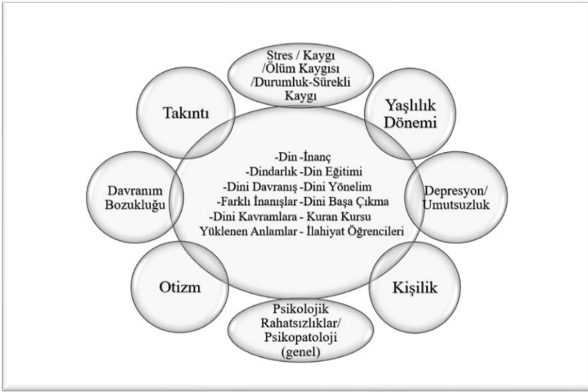
Şekil-2: Din ve psikopatoloji ilişkisini konu alan çalışmalar [Tüm ürünler – (2000-2010)]

2010 ve sonrasında yapılan çalışmalar hem makale hem de yüksek lisans ve doktora tezleri olarak pek çok alanda fazlaştığı için bu dönemi tezler, makaleler ve diğer çalışmalar olarak ele almak, bütüncül resmin daha net görülmesine yardımcı olacağı düşünülmektedir. 148 çalışmaya ulaşılan 2010 sonrasında yapılan tezlerdeki genel örüntü; din, dindarlık, dini boyut, dini lider yetiştirme, dini tutum ve davranış, dini/manevi başa çıkma, manevi iyilik düzeyi, ilahiyat fakültesi, spiritüel iyi oluş, İslam hukuku, dini kimlik, din eğitimi, maneviyat, inanç, Kuran, din görevlileri, sufi psikolojisi, müftülük çalışanları, muhafazakâr kadınlar, Ku-