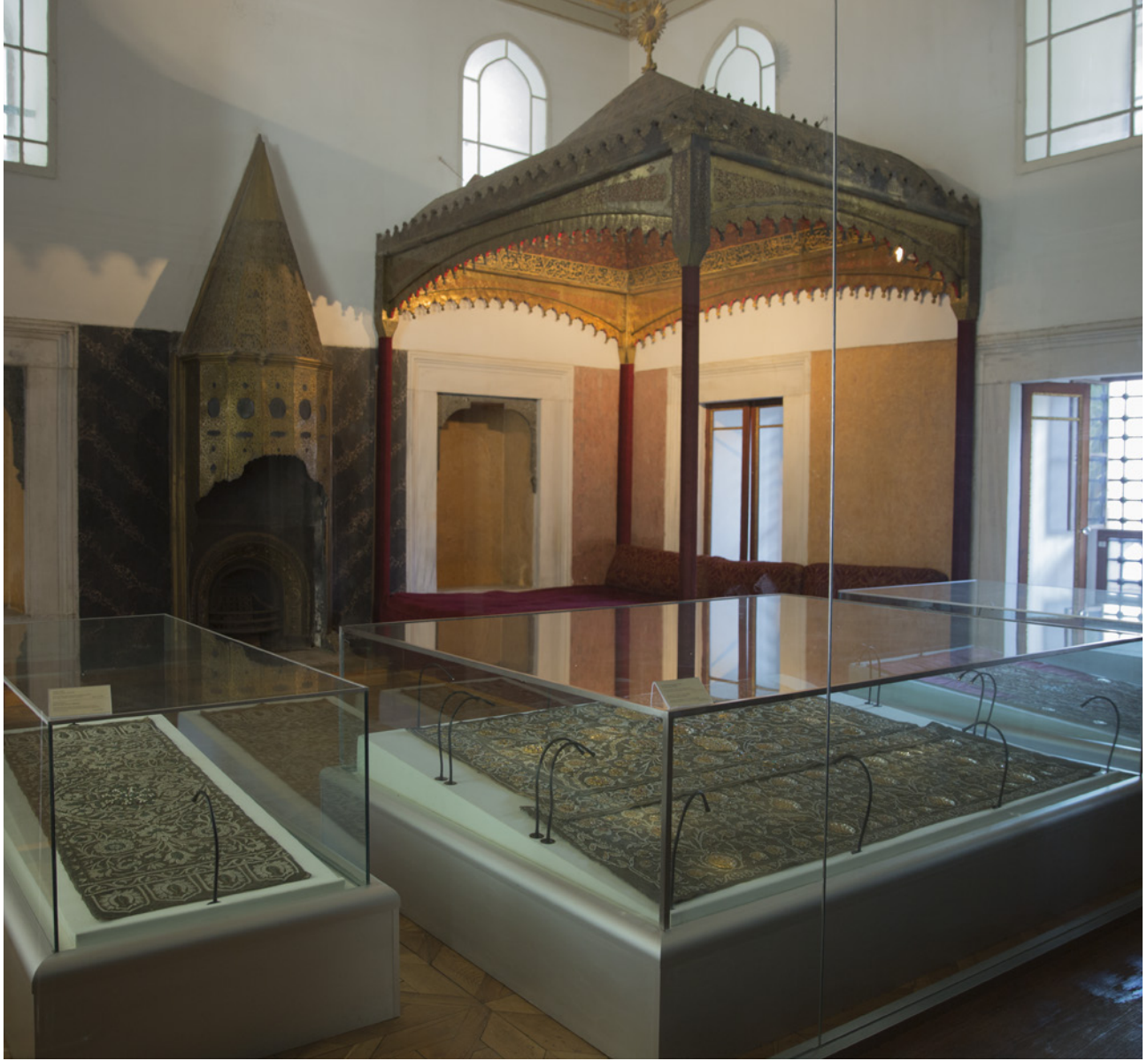
6 Topkapı Sarayı'nın Arz Odası, iç mekân 28

Arz Odası'nı ve Elçi Kabul Odası'nı karşılaştırdığımızda, her iki odanın da buldukları ana yapının tüm özelliklerini, dönemin hâkim tasarım modelini ve diplomasi anlayışını, ayrıca yabancı elçi ve devlet adamlarının kabulüne dair teşrifat kurallarındaki değişimi açıkça ortaya koydukları görülmektedir. Arz Odası, tek mobilyası olan sedir biçimli tahtıyla, yangından dolayı tahrip olduğundan bugün ancak minyatürlerde ve Avrupalı ressamların tasvirlerinde görebildiğimiz duvar çinileriyle ve tunç kaplama şöminesiyle dönemin Ehl-i Hıref sanat anlayışının en güzel örneklerinin verildiği odalardan biridir.