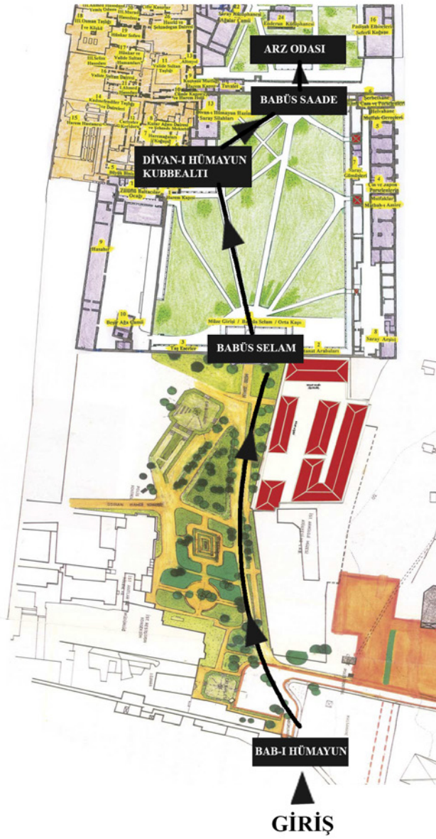
2 Topkapı Sarayı'nın elçi geçiş güzergâhı 20

olarak II. Avlu'ya (Divan Meydanı / Adalet Meydanı) geçen elçi, Divan-ı Hümayûn'da (Kubbealtı) sadrazam tarafından karşılanırdı, kendisine yemek ikram edilir ve hilat giydirilirdi. Buradan iki kapıcıbaşı ile Bâbüssaâde'den (Selam Kapısı / Orta Kapı) geçerek III. Avlu'da bulunan Arz Oda'sına girer ve Padişah ile görüşmesi gerçekleşirdi.