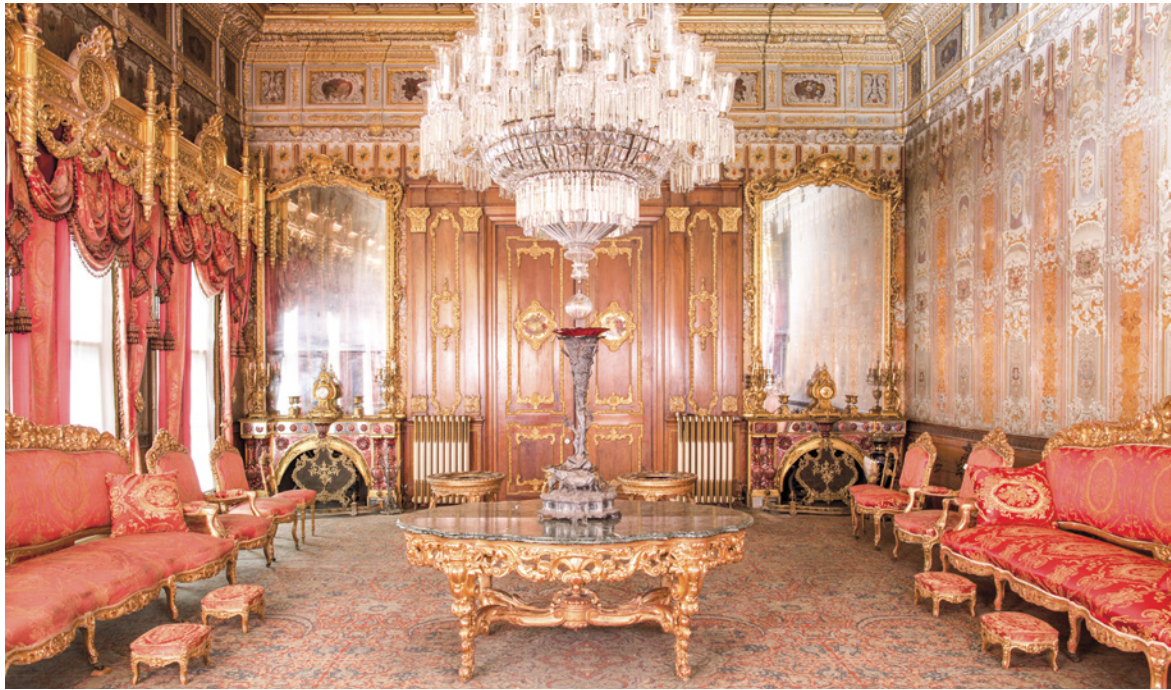
4 Dolmabahçe Sarayı'nın 31 No'lu Elçi Kabul Odası 25

Odada kristal avize ve odanın rengiyle uyumlu, kırmızı Bohemya kristalinden yapılmış lambader gibi aydınlatma elemanları; İtalyan yapımı mermer masa, orta ve yan sehpa gibi tamamlayıcı mobilyalar; XV. Louis tarzında oturma takımı,