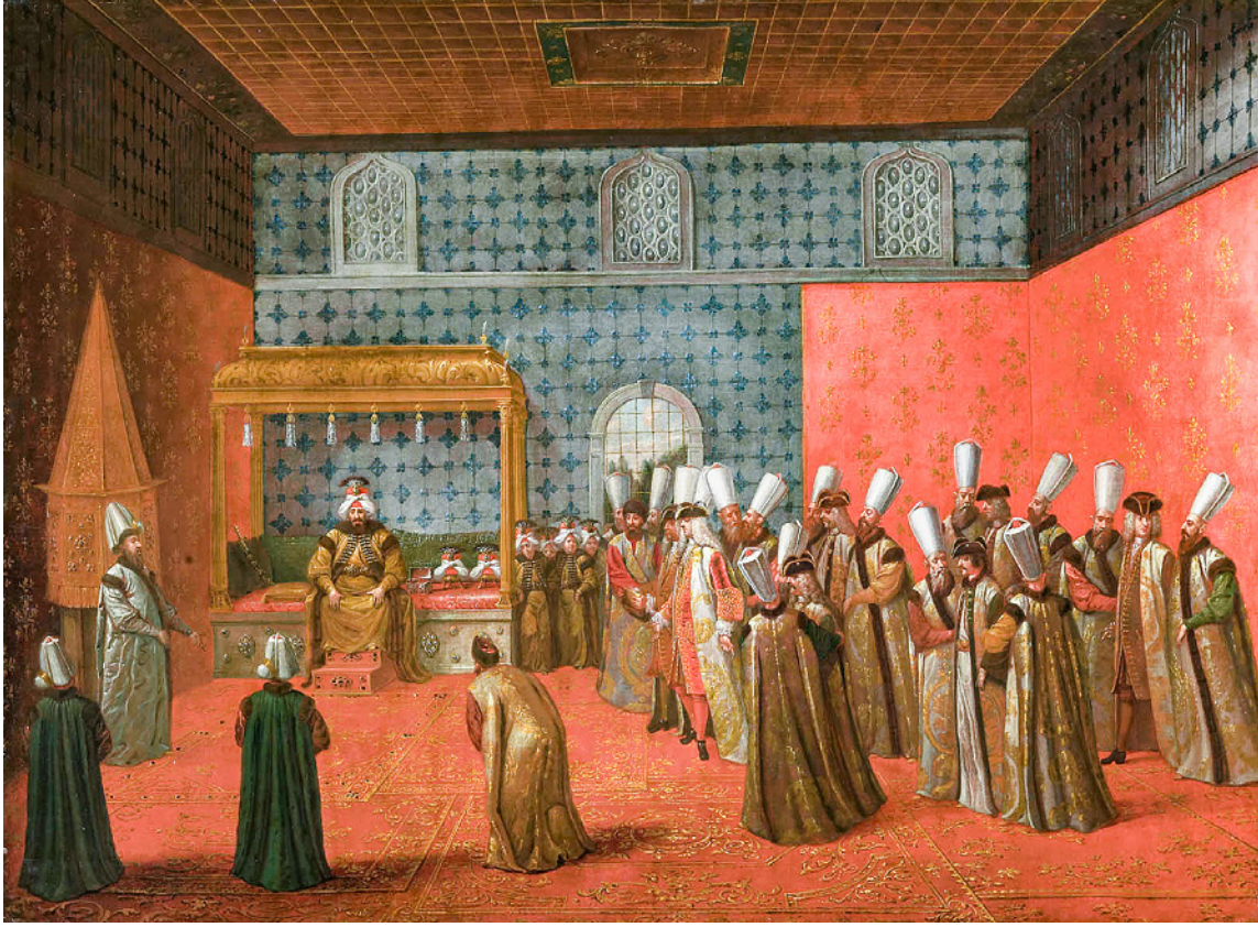
1 Jean-Baptiste Vanmour, Sultan III. Ahmed'in Cornelis Calkoen'u Kabulü 19

Topkapı Sarayı'na Bâb-1 Hümâyûn'dan giren elçi, Bâbüsselâm'a geldiğinde atından iner ve Divan-1 Hümâyûn tercümanı tarafından karşılanarak nöbet odasında bir süre dinlenirdi. Sonrasında Sadrazam tarafından Divan-1 Hümâyûn'a kabul edilir, akabinde yemek verilirdi. Yemekten sonra özel bir odaya gidilir, burada elçiye samur kürk astarlı ipek kaftan-hilat giydirilirdi. Ardından iki kapıcıbaşı tarafından Arz Odası'na götürülen elçinin hediyeleri, görevli ağalar tarafından padişaha sunulurdu. Padişah odaya girince selam verilirdi. Elçi, tercümanı aracılığıyla sadrazama hitap ederdi; padişah da cevabını sadrazam aracılığıyla verirdi. Yani padişahla karşılıklı konuşulamazdı. Elçi elinde tuttuğu nâmeyi yanındaki vezire verirdi, vezir sadrazama iletir, o da padişahın yanındaki yastığın üzerine koyardı. Bu da protokolün bir parçasıydı. Padişah birkaç söz ettikten sonra elçinin odadan çıkmasına izin verilirdi. 18 (Resim 1)