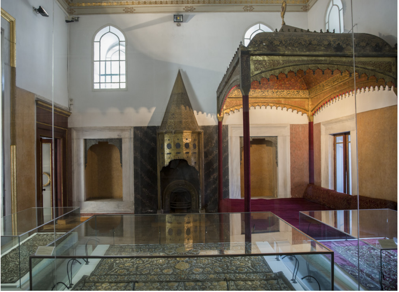
7 Padişahın oturduğu sedir taht, Topkapı Sarayı Arz Odası 29

Batı'ya dönmüş, dış dünyaya açılmış bir temsilin ifadesidir. Bu iki odada yer alan mobilya tipleri ve tasarım anlayışı, biçimsel dönüşümü; benimsenen yeni diplomasi ve protokol (teşrifat) anlayışı da içerikte yaşanan değişimi ortaya koyan unsurlardır. Biçimde yaşanan değişim, en güçlü şekilde, padişahın oturduğu sedir biçimli taht (Resim 7) ile koltuk (Resim 8) üzerinden okunabilmektedir.