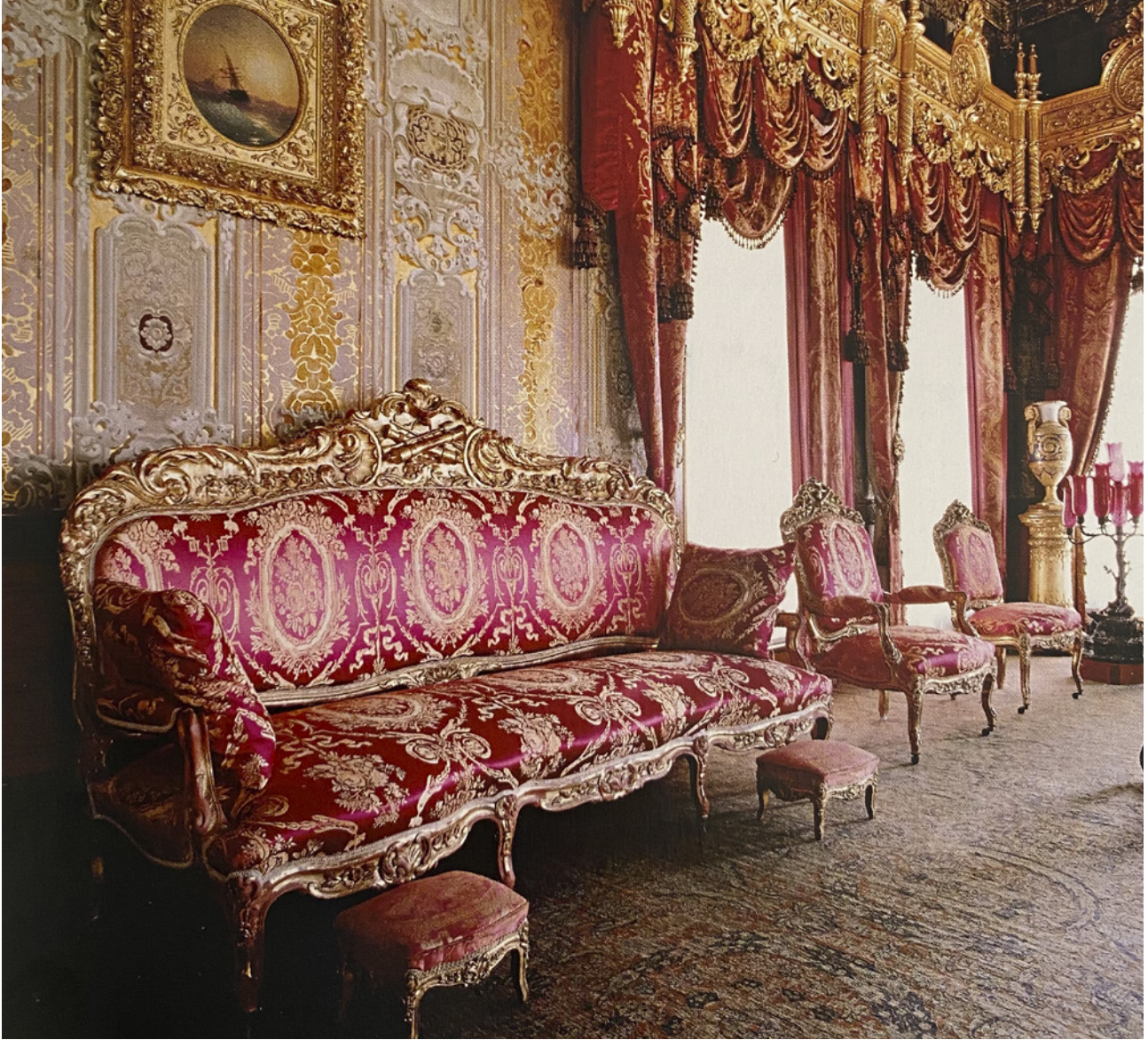
8 Padişahın oturduğu koltuk, Dolmabahçe Sarayı Elçi Kabul Odası 30