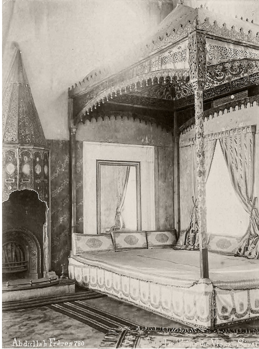
5 Topkapı Sarayı'nın Arz Odası, iç mekân 26

Topkapı Sarayı'nın Arz Odası'nda, (Resim 5, 6) salonun köşesinde sedir biçiminde bir taht vardır. Salonun iç duvarlarının çini kaplı olduğu; kapı, pencere ve dolap kapaklarının bağa ve sedef kakmalı, altın yaldızlı renkli nakışlarla süslendiği, tavanın ise renkli malakârî nakışlarla bezeli olduğu tahmin edilmektedir. Arz Odası, Sultan Abdülmecid devrinde çıkan bir yangından dolayı hasara uğramıştır.