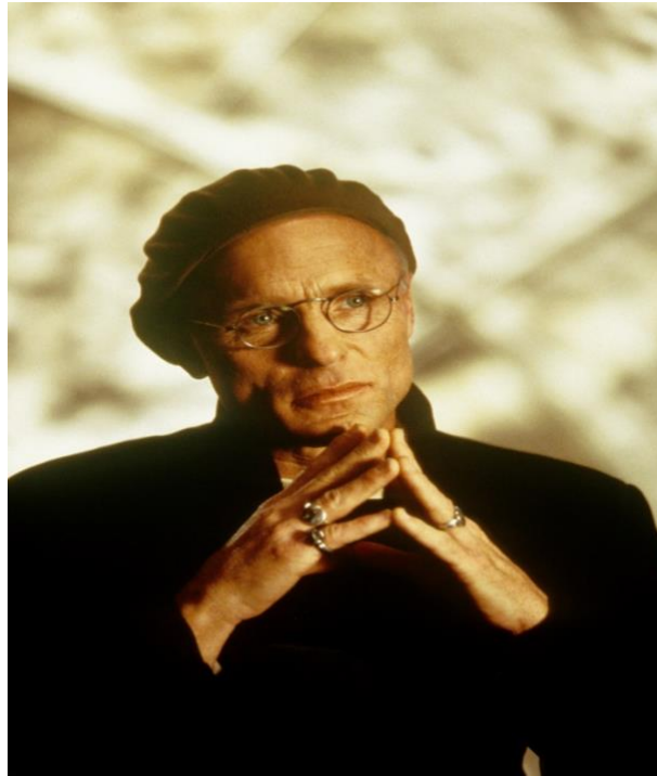
Şekil 5. Truman show'un yapımcısı.

Bu hapisane 7/24 sabit kameralarla izlenmektedir. Film George Orwell'ın 1984 adlı romanıyla benzerlikler içermektedir. 1984 isimli kitap Big Brother tarafından izlenen bir kitleyi konu edinmektedir. Truman Show, TV şovu olmasının yanında distopik bir dünyayı konu edinir. Filmde distopya kavramı baskıcı ve otoriter bir sistem olarak ifade edilmektedir. Sahte ayın içerisinde yaratılan gözetleme kulesinde yönetmen yer almaktadır. Filmin içerisinde televizyon bağımlısı olan izleyicilerde gösterilmektedir. İzleyicilerin evde, iş yerinde, dışarıda hatta banyoda bile görüntüleri verilmektedir. Gözetleme kulesinde olan yönetmen, Truman'ın tüm özel hayatını işgal ederek sahte ailesinin yardımıyla onun davranışlarını da şekillendirmektedir. Bunlar sadece yönetmenin isteği doğrultusunda değil izleyicinin beklentileri doğrultusunda yapılmaktadır (Sucu, 2020, s. 4-5).