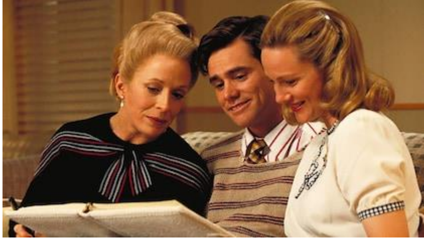
Şekil 3. Truman'ın annesi ve eşi.

yaşamından kurtularak, gerçek bir dünyada özgür olmaktır. Bu verilen isimde onun gerçek bir dünyada özgür olacağına işaretir (Yiğit, 2009, s. 264).