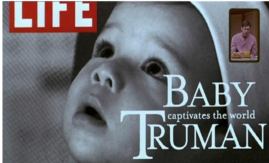
Şekil 2. Truman'ın bebekliğinin gösterildiği bir sahne.

Teknolojik olanakların sınırlı olduğu dönemlerde gözetleme "Big Brother" adı verilen iktidar tarafından yapılmaktaydı. Günümüzde ise bu olay teknolojinin gelişmesiyle farklı bir hal almıştır. Gözetim kavramı beraberinde kamuoyu oluşturma sürecinin önemli bir aşaması olan gündem oluşturma kavramını da getirmektedir. Gündem oluşturma kavramı bilişsel anlamda farkına varmayı temsil etmektedir. Truman Show filmi buna örnek gösterebilir. Filmin başkarakteri bebekken bir televizyon kanalı tarafından evlat edinilir. Başkarakterimiz, her şeyden habersiz bir şekilde kendisini Truman Show adlı televizyon programında bulur. Kendisi için kurulan yapay dünyada gözetlendiğinin farkında olmayan Truman, güzel fakat klişe bir hayat yaşamaktadır. Tüm bu düzeni kuran yönetmen, çalışanlar ve izleyiciler onu yakından takip etmektedir. Günümüz toplumunda gözetlenen konumda olan kesim bu filmde gözetleyen konumuna geçirilmiştir. Her şey yapay bir evrenden ibaret olmasına rağmen gerçekmiş izlenimi verilmektedir. Tüketim dediğimiz olgu, insanlığın var olduğu andan itibaren farklı biçimlerde kendisini göstermektedir. Gözetim, teknolojinin gelişmesiyle günlük yaşamımıza daha kolay sızır ve daha az görünür bir hal alır. Küresel anlamda toplanan tüm verilerle büyük arşivler oluşturulmaktadır. Günümüzde insanlar bu sisteme kendi rızasıyla katılmaktadır (Sucu, 2020, s. 23). Bu bağlamda, Truman Show filmine teknolojinin gelişmesiyle farklı bir biçim alan gözetim kavramı çerçevesinde bakılmaktadır.