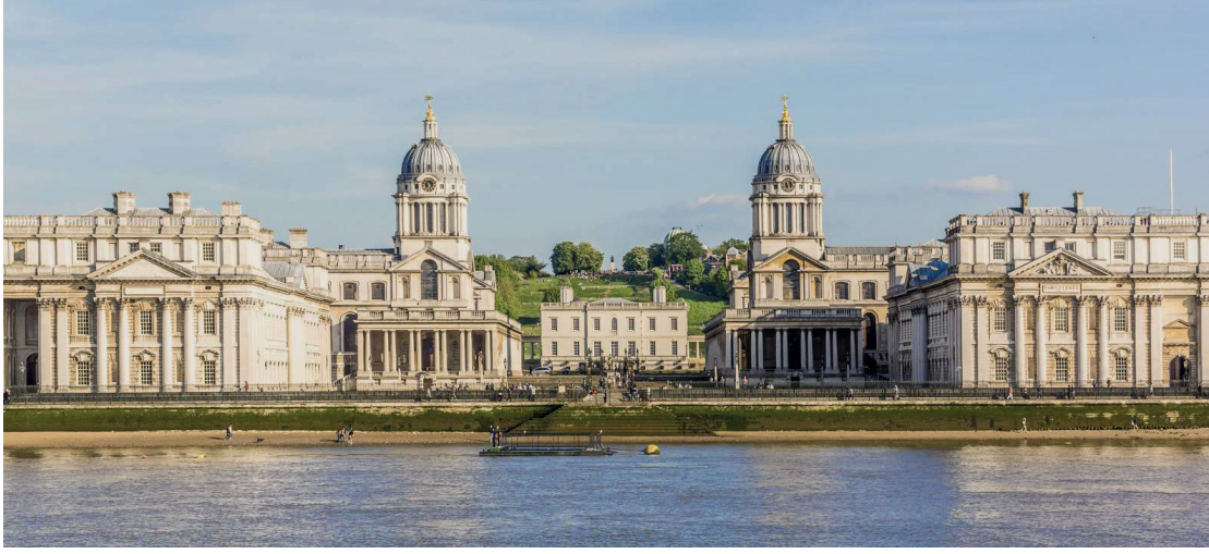
Resim 3: Greenwich'te bulunan Royal Naval College

(Kaynak: https://www.getyourguide.co.uk/old-royal-naval-college-13213/?fromCollection=1101 )