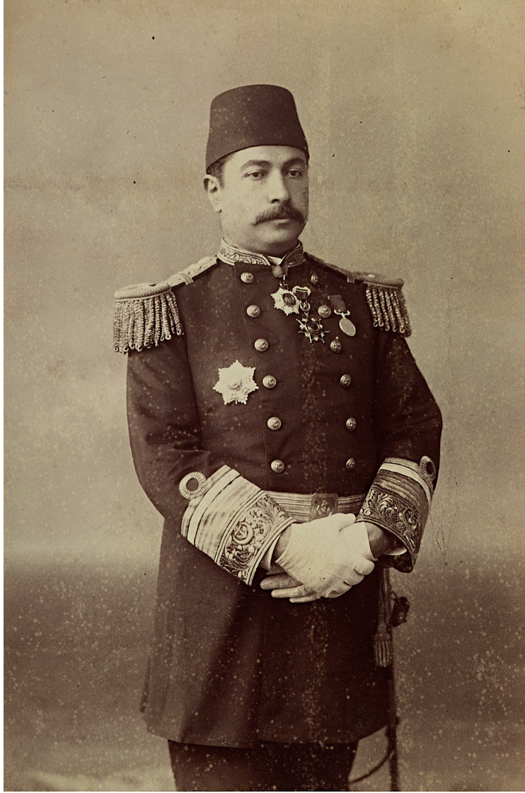
Resim 1: Ali Naci Bey'in babası Erkan-ı Harbiye-i Bahriye Reisi Faik Paşa