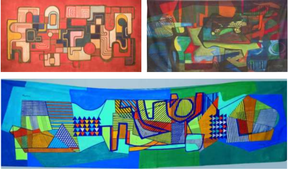
Şekil 8 - Roberto Burle Marx'ın resimleri (URL4).

Yazar ve eleştirmelerin bir kısmı, Roberto Burle Marx'ın bahçelerini tablo olarak nitelendirirken diğer bir kısmı da tasarladığı bahçelerini 'yaşayan resimler' olarak nitelendirmişlerdir. Kendisi ise bu durumu "bahçelerimi boyuyorum" şeklinde ifade etmiş; ressam kimliğini hiç bırakmayan Roberto Burle Marx peyzaj tasarımlarını da sanat eseri olarak nitelendirmiştir (Arnett, 2007). Peyzaj tasarımının sadece çizimlerini ve resimlerini daha az geleneksel malzemeler kullanarak organize etmek ve oluşturmak için bulduğu bir yöntem olduğunu açıklamıştır (Trkulja and Aleksic, 2012). Projelerinin teknik çizimleri (Şekil 5) ile resimlerindeki soyut çizimler (Şekil 8) birbirine benzemektedir. Bu açıdan peyzaj tasarımları ve resimleri arasında tam olarak bir ayrım olmadığı söylenebilir. Peyzaj mimarı ve ressam kimliği birbirini desteklemiş; bu sayede çalışmaları başarılı ve yenilikçi bir niteliğe sahip olmuştur (Tiberio, 2022).