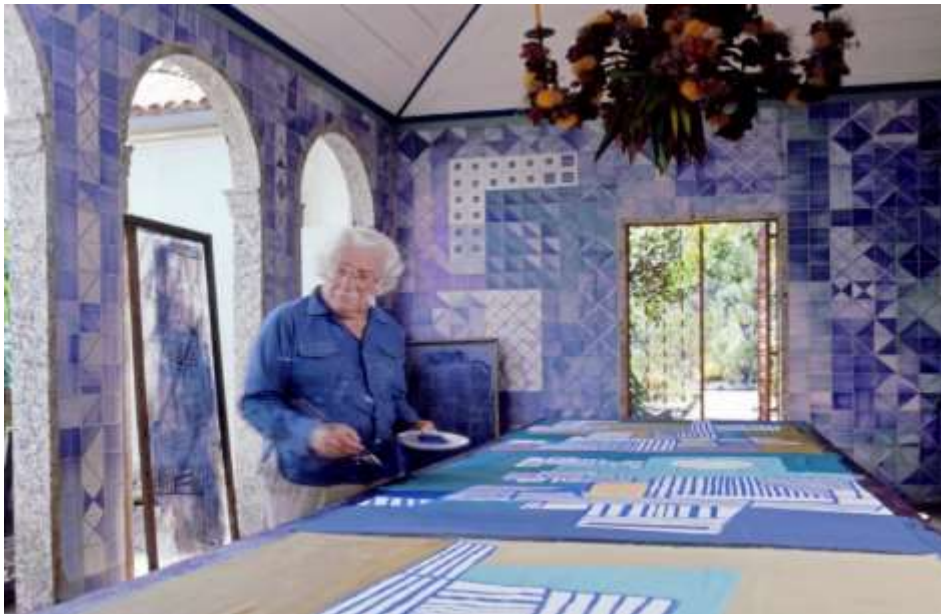
Şekil 3 - Peyzaj mimarı ve ressam Roberto Burle Marx (Chan, 2016).

Roberto Burle Marx (1909-1994), São Paulo'da doğmuş ancak hayatının büyük bir kısmını Rio de Janeiro'da geçirmiştir (Şekil 3). Babası Alman bir iş insanı, annesi ise Brezilyalı bir piyanist olan Roberto Burle Marx, annesinin etkisi ve babasının katkısı ile sanat eğitimi almıştır. 1928 yılında Berlin'e taşınmış; müzik ve sanat eğitimi alırken müze ve sanat galerilerini gezerek kübizm, soyutlama ve Alman dışavurumcuları hakkında bilgi edinmiş; ayrıca konser, opera ve tiyatro gibi sahne sanatlarını izlemiştir (Doherty, 2018). Almanya'da sanat eğitimi alırken Dahlem Botanik Bahçesi'ndeki tropik bitkiler ilgisini çekmiş ve tropik bitkilerin farklı sanatsal olanakları üzerine çalışmıştır. Rio'ya döndüğünde ise kafasındaki fikirleri test etmeye başlamış ve evinde bitkiler üzerinde denemeler yapmıştır (Fidan, 2019a).