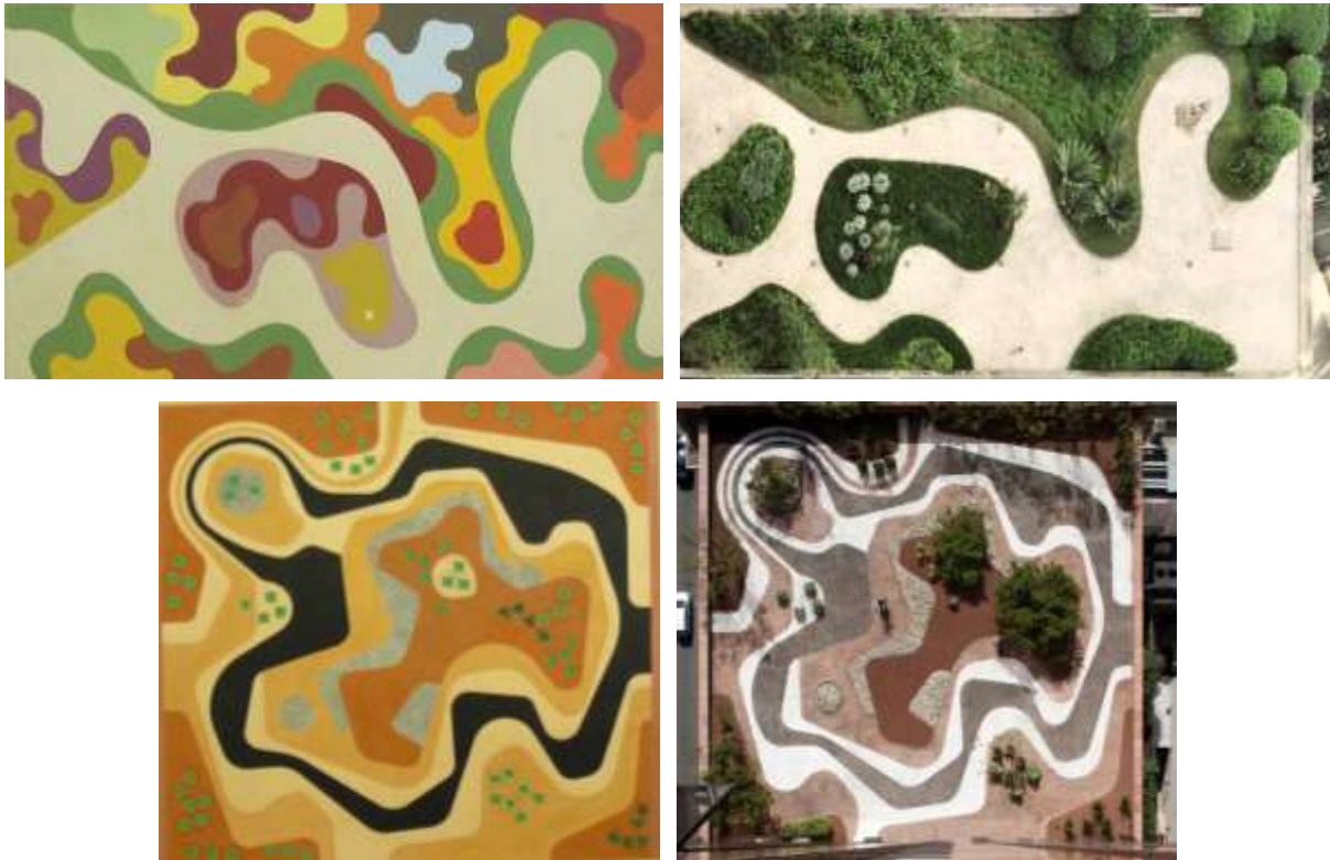
Şekil 5 - Eğitim ve Sağlık Bakanlığı ve Safra Bankası Genel Merkezi çatı bahçesi (Montero, 2001).

tasarımında araziyi düzenlerken, bir ressamın tuvaline çizim yapmasına benzer bir metot kullanmıştır (Philippou, 2011). Çatı bahçelerine Brezilya nehirlerinin kuş bakışı görüntülerini anımsatan soyut eğriler çizmiştir (Şekil 5). Doğayla uyumlu bu eğriler bir akarsu içindeki iri çakıllarla, bu çakılları çevreleyen büyük, biyomorfik çiçekliklerin soyut düzenini oluşturmuştur. Beton çiçeklikleri yer seviyesinden görülebildiği gibi yüksekten de görülebilecek biçimde tasarlamış; egzotik bitkileri heykelsi vurgu ve renk etkisi oluşturacak şekilde yerleştirmiş, terasın kendisini ise gösterişli geometrik desenlerle süslemiştir. (Campbell 2007'den aktaran Taşdemir, 2011). Roberto Burle Marx'ın resimlerinde olduğu gibi tasarımlarında da yer verdiği dalgalı çizgilerin oluşturduğu biyomorfik formlar, tasarımda tekrar, birlik ve düzeni oluşturmuştur (Şekil 5).