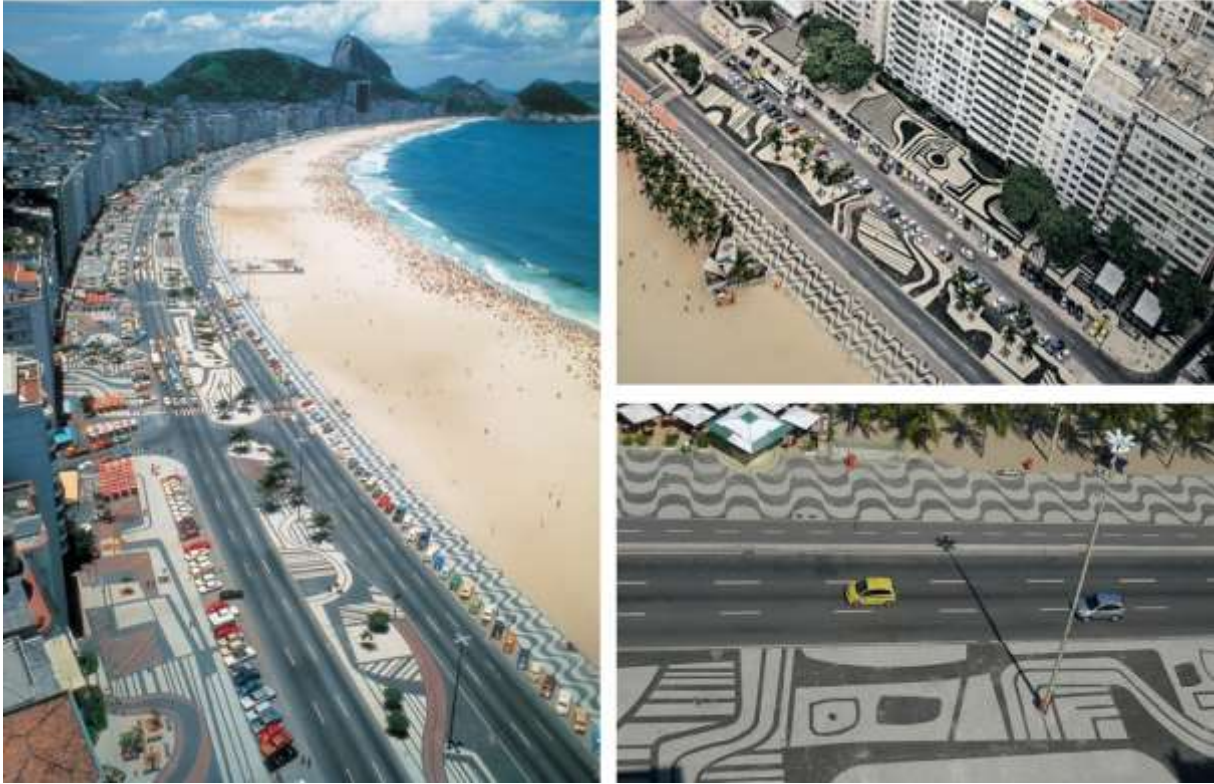
Şekil 6 - Copacabana sahili gezinti yolu, Rio de Janeiro (Chan, 2016).