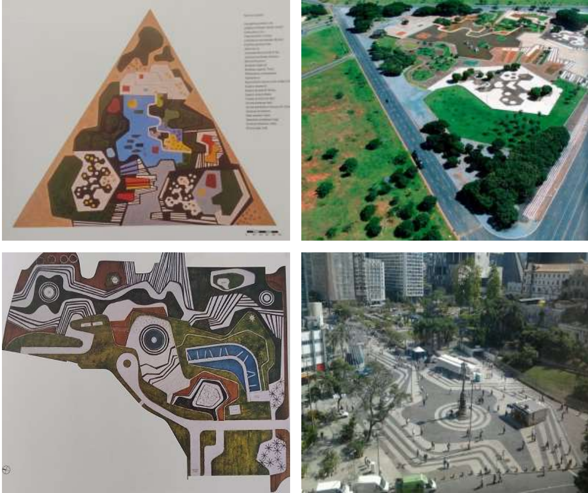
Şekil 4 - Roberto Burle Marx'ın tasarımlarındaki biyomorfik formlar ve dalgalı çizgiler (Ministry of Army ve Largo DaCarioca) (Montero, 2001).

Roberto Burle Marx'ın kübizm ve sürrealizmden etkilenecek yaptığı resimleri ile peyzaj tasarımları karşılaştırılmış; tasarım elemanları ve ilkelerini kullanma tarzının hem kendi resimleri hem de etkilendiği resimlerle ortak noktalar içerdiği tespit edilmiştir. Resimleri ve peyzaj tasarımlarını tasarım ilkeleri ve elemanları sayesinde ortak bir temele oturtmayı başarmıştır. Peyzaj tasarımlarında düzen, zıtlık, tekrar, egemenlik, uyum, vurgu, ritim, birlik ve asimetri gibi temel tasarım ilkelerini kullanmıştır. Tasarım elemanlarını insan ölçüsünü temel alarak dalgalı çizgiler, biyomorfik formlar, parlak ve canlı renkler, bitkilerle oluşturduğu dokular, hareket, ışık-gölge olarak kullanmıştır.