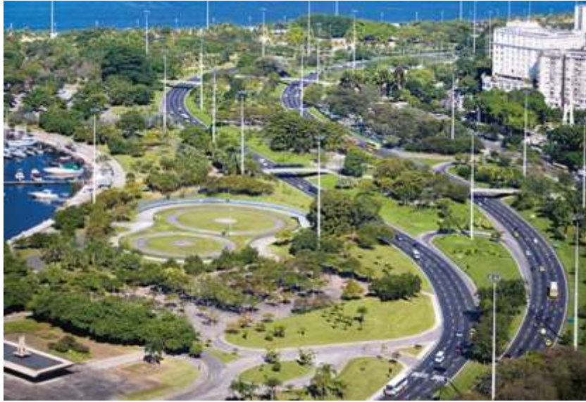
Şekil 9 - Ibirapuera parkı ve Flamengo parkı (Andretta and el-Dahdah, 2022).

Peyzaj tasarımlarını genel olarak farklı renk ve dokulara sahip, sıra dışı eğrisel alanların kombinasyonu üzerine oluşturmuştur. Ibirapuera Parkı ve Flamengo Parkı projeleri (Şekil 9) bu tarzını yansıtmaktadır. Bu parklar onun bahçe tasarımını sadece bir botanikçi olarak değil aynı zamanda bir ressam olarak ele aldığını göstermektedir. Kuşbakışı bakıldığında, bu parklar belli bir mekânsal gerçeklik kadar soyut resimle de aynı derecede ilişkili görünmektedir (Trkulja and Aleksic, 2012).