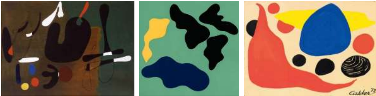
Şekil 7 - Joan Miró, Jean Arp ve Alexander Calder'in resimlerinden örnekler (URL1), (URL2), (URL3).