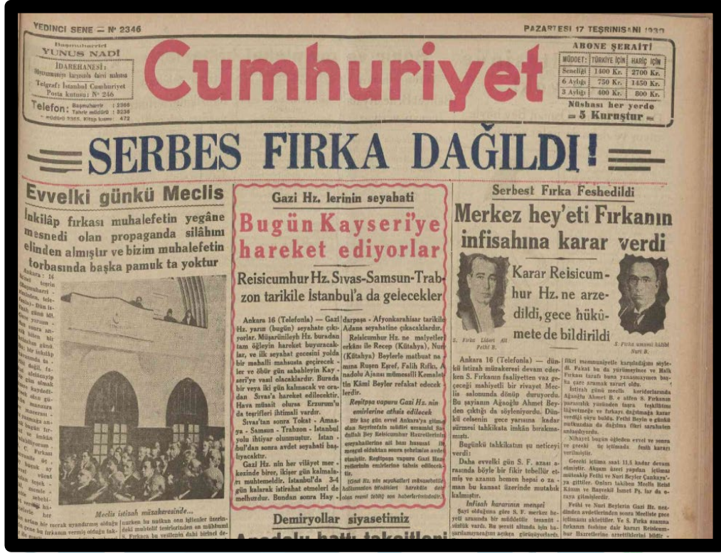
Resim 3. Serbest Cumhuriyet Fırkasının Kendini Feshetmesi