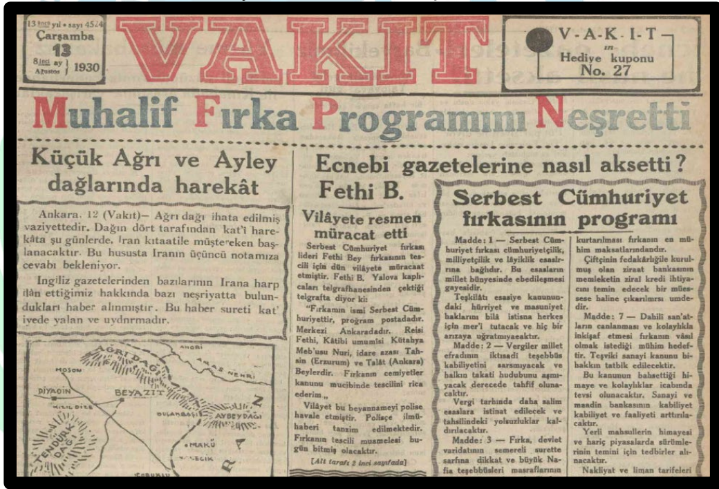
Kaynak: Vakit, 13 Ağustos 1930.