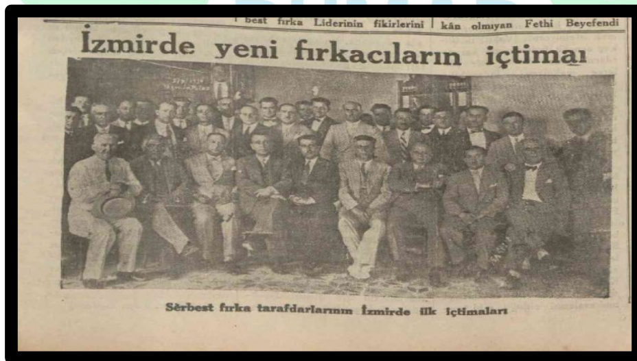
Resim 2. Serbest Cumhuriyet Fırkasının İzmir Toplantısı