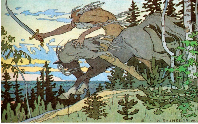
Resim 5: İvan Bilibin'e ait Türk tasvirinin yapıldığı 1901 tarihli Koşey adlı tablo