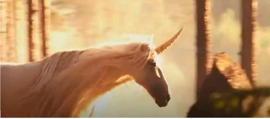
Şekil 1: Boynuzlu Atın Filmde Yer Alma Biçimi