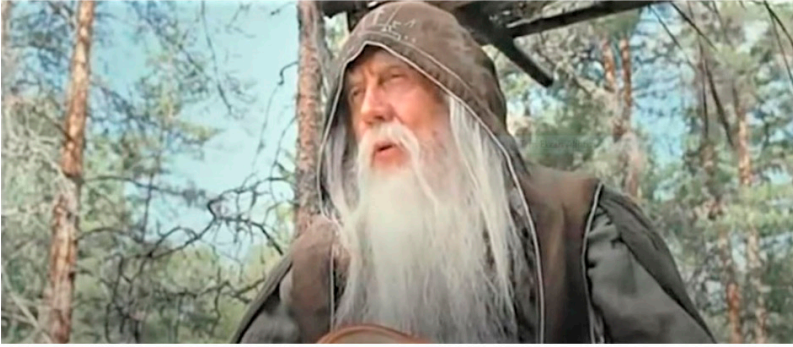
Resim 11: Lehistan işgali, Katolik tahakkümü, sahte çarlar nedeniyle Karanlık Dönem boyunca kendini yüksekçe bir yerde zincire vuran Ortodoks rahip.