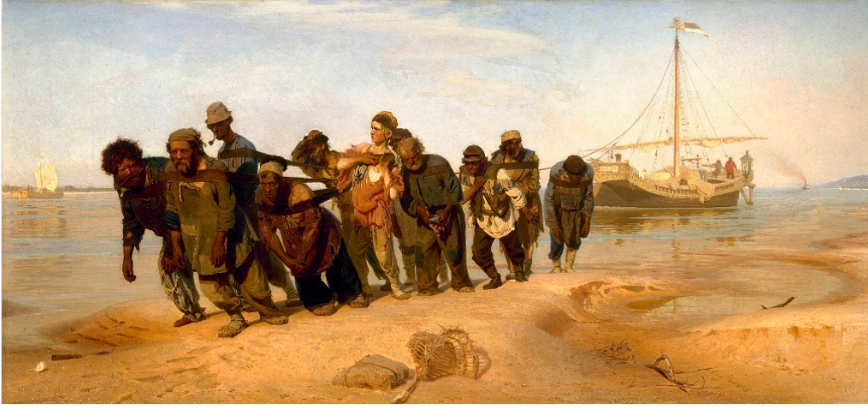
Resim 8: 1612 filminde kölelerin gemiyi çektiği sahne