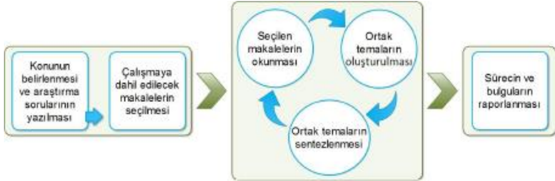
Şekil 1. Meta-sentez çalışmasının işlem basamakları

İncelemeye dahil edilen çalışmaların belirlenmesinde Polat ve Ay’ın (2016) işlem basamakları kullanılmıştır. Bu işlem basamakları ele alınacak olan çalışmaların konularının belirlenmesi, araştırma sorularının hazırlanması, araştırmaya dahil edilecek tezlerin ve makalelerin belirlenmesi ve okunması, çalışmaların ortak temalarının oluşturulması ve sentezlenmesi, sonuçlarının raporlaştırılmasından oluşmaktadır. Araştırma bir meta-sentez çalışma olup işlem basamakları Şekil 1’de verilmiştir.