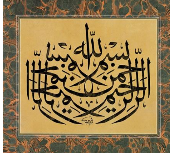
Resim 2: Besmele ( http://www.barincilt.com.tr/eminHat.html )

Çalışma 50x67cm ebatlarındadır. Celi Reyhani isimli bu çalışmada, kenar bordürleri ebru çalışmasıyla süslenmiş, krem zeminli, zemin üzerine siyah renkle işlenmiş Besmele yazısını görmekteyiz. Çalışmaya ortadan sanal bir çizgi çekildiğinde her iki tarafın birbirinin aynası olduğunu görürüz. Tipik simetri çalışması olan bu yazıda, yalnızca en üstteki Allah yazısı ve Emin Barın'ın eski harflerle yazdığı kendi ismi ve çalışmanın hayata geçtiği tarih olan 1985 yılının simetrisi alınmamıştır (Resim 2).