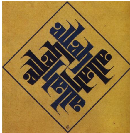
Resim 5: 4 lü Allah

57x57 cm üzerine oluşturulan kufi yazı stili, Latin harfleriyle yazılan Atatürk yazısı, krem zemin üzerine siyah renkte yazılmıştır. Dörtlü yazıda her harf birbirine, her kelime de bir sonrakine bağlanmıştır. Küçük yazı karakterleriyle oluşturulan bu çalışmada ü harfinin noktalarını destekler biçimde çalışmanın tam ortasında daha büyük ebatta kırmızı bir nokta yerleştirilmiştir (Resim 4).