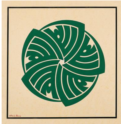
Resim 1: Allah beşli ( http://www.barincilt.com.tr/eminHat.html )

Emin Barın; 50x50cm ebatlarında hazırladığı çalışmada Arapça harflerle kullanılarak ALLAH yazmıştır. Yazı, form içerisinde biçim tekrarı yapılarak çoğaltılmıştır. Toplamda 5 adet Allah yazısı kullanılmıştır. Yazı krem rengi zemin üzerine yeşil renk ile yazılmıştır. Elif harfi, her biçimin birbirine bağlanmasını sağlayacak şekilde bir sonraki biçime doğru stilize edilmiştir. Çalışmanın sol altına baktığımızda, yeni harflerle yazılmış Emin Barın imzasına rastlamaktayız. Serbest Kreasyona dahil olan bu çalışmanın tarihi belirtilmemiştir (Resim 1).