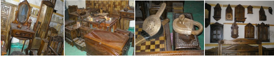
Fotoğraf 6: İlçe Ve Köylerinde Yapılan Ürünlerden Örnekler (Bozkurt, 2011)

Bu alanda çalışmalar yapan ustaların tarafından oda takımları, rahle, kapı, bardak, ayna, masa, sandalye, beşik, sandık, kutu, mumluk ve havan gibi ürünler üretilmektedir.