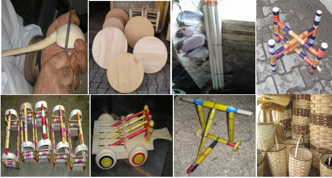
Fotoğraf 2: Kaşık, Ekmek Tahtası, Baston, Sini Ayağı, Beşik, Tokmaklı Kanı, Yürüteç ve Sepet (Bozkurt, 2011)