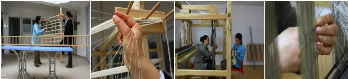
Fotoğraf 10: Çözümlü çözülmesi Ve Tezgâha Aktarma İşlemi (Bozkurt, 2011)

Kenefi bezi dokumacılığında mekikli dokuma tezgâhı, pamuk iplik, ipek, çözümlü dolabı, peçe, mezura, makas, mekik gibi malzemeler kullanılmaktadır. Ebatları belirlenen bezin iplik seçimi yapılır ve çözümlü dolabında çözümlü çözülerek hazır hale getirilir. Hazırlanan çözümlü, tezgâha aktarılır ve mekiğe kullanılacak bobin yerleştirilir. Yedekte bulunan mekiklere de yedek olarak, iplikler bobinlere sarılır hazır bekletilir. Çözümlü ipleri gücü tellerine bir önden bir arkadan olacak şekilde geçirilir. Tezgâhın üzerinden geçirilerek dokuyucunun oturacağı yere arkadan indirilerek sabitlenir. Dokumaya hazır hale getirilen çözümlü belirlenen ebada göre iki tane dokunur ve tezgâhtan çıkartılır. Kenar temizleme işlemi yapıldıktan sonra iki ayrı parça ortadan birbirine dikilir.