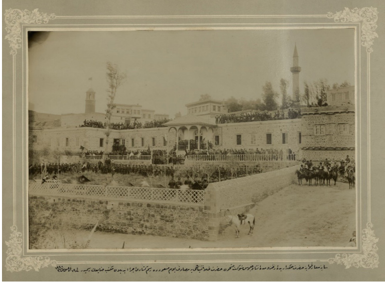
Ek-8: Erzurum kışlasında maharetlerini sergileyen Hamidiye Alayları 172