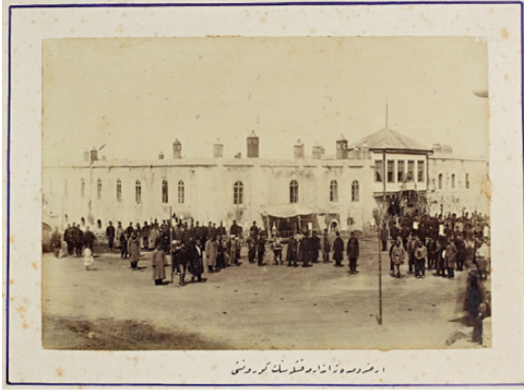
Ek-2: Erzurum'da bulunan süvari kıışlası 166