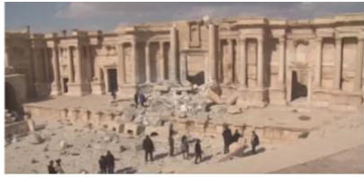
Figür 6: Palmyra, Roma Tiyatrosu yıkımdan önce, ve sonra.

Palmyra'nın Bel ve Baal Shamin tapınaklarının da yok edilmesi ve arkeolog Khaled al-Assaad'ın antik eser deposunu koruma çabası karşısında işkence ile öldürülmesi sonucu UNESCO'nun başkanı Irina Bokova bu ölümün ve eserlerin yok edilmesinin savaş suçu olarak kabul edilmesini önermiştir. Tarihi eserlerin