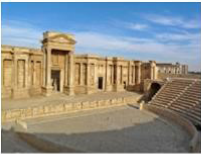
Palmyra Tiyatrosu yıkımdan önce