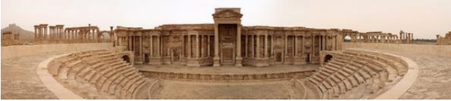
Figür 5: Palmyra, Roma Tiyatrosu yıkımdan önce, solda Tetrapylon. http://www.arkeoloji.biz/2017/03/palmyra-antik-kenti-tiyatro-bomba-isid.html 22/4/2022

2x104 metrelik meydanın ve ana sütunlu caddenin güneybatısında yer alan tiyatronun ön cephesi kuzey-kuzeydoğu doğrultusunda kentin büyük caddesi Cardo Maximus'a doğru bakmaktadır. Tiyatronun ana girişleri olan aditus maximi'nin genişliği 3.5 metredir, 23.5 metrelik taş döşeli orkestra 20.3 metrelik çapa sahip dairesel bir duvarla sınırlanmıştır (Figür 5). Tiyatronun valva regia denilen merkez kapısının tamamen yıkılmış olduğu görülmektedir. (Figür 4 sağ).