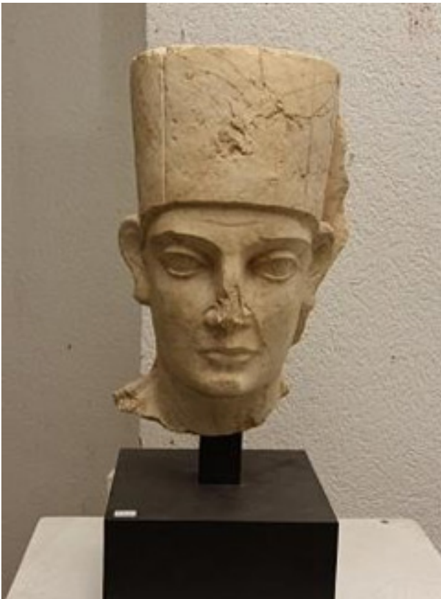
Figür 8: Geneva'daki Musée d'Art et d'Histoire'de sergilenen eser.

Almanya kültürel varlıklarla ilgili uygulamaları daha denetimli hale getirme kararı almasına rağmen Federal Hükümetin Kültür ve Medyadan Sorumlu Devlet Bakanı, Monika Grütters'in sunduğu yasa tasarısı sadece kökenine ait açık şekilde belgelenmiş ve bulunduğu ülkeden çıkışı onaylanmış tarihi eserlerin satışının yapılabilmesine imkan sağlamaktadır. Berlin'de 11 Aralık 2014'te yapılan "Kültürel Miras Tehdit Altında" adlı konferansta Suriye, Irak ve Mısır'ın da aralarında bulunduğu ülkelerden kaçırılan tarihi eserlerin yasa dışı yollarla satışının nasıl önüne geçilebileceğini tartışılmıştır.