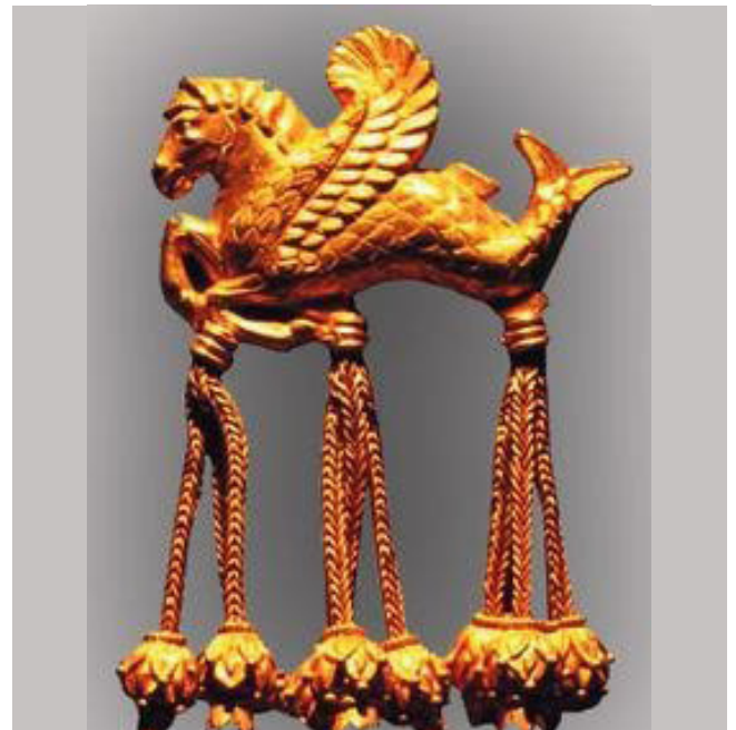
Figür 2: Karun Hazinelerinden Denizati Broş, Uşak Müzesi Arşivi. https://aktuelarkeoloji.com.tr/kategori/blogyazarligi/kanatli-denizati 28/6/2022