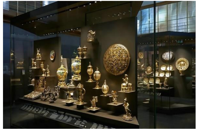
Figür 1: British Museum, Londra Rotschild Koleksiyonu Vitriini. https://www.hisour.com/waddesdonbequest-rothschild-collection-british-museum-36995/ 28/6/2022

Bu eser gruplarına Karun Hazinesi, Elmalı defnesi gibi örnekler verilebilir. 1965-68 yılları arasında, Uşak'ın Güre Bucağı yöresinde Toptepe, İkizdere, Aktepe, Basmancı tümülüslerinden köylüler tarafından ilkel yöntemlerle yasa dışı kazılarla çıkarılan MÖ 6. yüzyıl Lidya-Pers eserlerinden oluşan 363 parçalık görkemli Karun Hazinesi'nin bulunuşu, New York'a kaçırılışı, Metropolitan Sanat Müzesi'nde sergilenmesi ile Federal Mahkeme aşamalarını da kapsayan 25 yıllık geri getiriliş öyküsünü içeren deneyimde kaçakçılığı önleyecek olan metinler değil, bu 25 yıllık süreçte yaşananlardır. Ülkemizde medyanın belge niteliğinde çalışmaları da yurt dışına çıkarılmış bazı eserlerin ülkemize yeniden kazandırılması ile ilgili kayda değerdir (Figür 2).