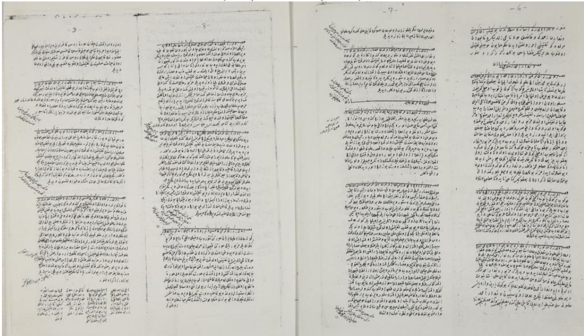
Ek. 2: Akkirman'ın Teftişini Gösteren Diğer Defter (BOA, D.M.d 36806, s. 6-11)

el-'abdü'l hakir Ali ...be-kazâ-yı Kili 9