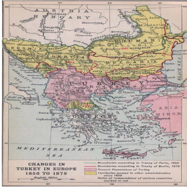
Harita 1: Türkiye Avrupası'nda 1856-1878 yılları arasındaki sınır değişikliklerini gösterir harita. 4

Günlüğün içeriğine göz atmadan evvel olayların bu noktaya gelip düğümlenmesine sebep olan vakalar silsilesine kısaca bir göz gezdirmek faydalı olacaktır. Rumi takvime göre 31 Mart 1325'te gerçekleştiğinden ötürü bu adla anılan bu vaka, miladi takvime göre 13 Nisan 1909'da vuku bulmuştur. Bu tarihte, 34. Osmanlı Padişahı II. Abdülhamid (1876-1909) saltanatının sonunun yaklaşmakta olduğundan elbette haberdar değildi. 1876'da I. Meşrutiyet'i ilân etme gerekçesiyle tahta çıkan yahut çıkarılan sultan, 1877-78 yılları arasında Osmanlı ile Rusya arasında vuku bulan ve Rus ordusunun Yeşilköy önlerine kadar ilerlemesiyle sonuçlanan büyük bir askerî hezimet yaşamıştı. Geleneksel padişah imajına bağlı sultan, bu krizden istifade ederek anayasayı ilga etmiş ve meşruti monarşi idaresine geçilmesine ön ayak olan Mithat Paşa başta olmak üzere önde gelen bürokratları sürgüne göndererek rejimi yeniden mutlak monarşiye döndürüp iktidarı tekeline alma sürecini başlatmıştı.