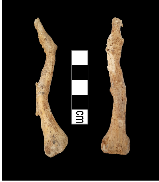
Resim 10. Artirit sonucu parmak kemiklerinin birleşmesi.

İskelet serisi üzerinde en sık rastlanan patolojiler omurlarda gözlenmiştir. Hellenistik Dönem'e tarihlendirilen iskelet serisi içerisinde yalnızca 18 omur tespit edilmiş, bunların da bir tanesinde osteofit gözlenmiştir. Roma Dönemi iskelet serisi içerisinde ise 12 omur tespit edilmiş, herhangi bir patoloji gözlenmemiştir. Bizans Dönemi daha fazla sayıda omur ile temsil edilmektedir. 10 erkek bireye ait 170 omur incelenmiş; 13 Schmorl Nodülü ve 4 osteofit gözlenmiştir. Tespit edilen Schmorl Nodülleri ve osteofitlerin hepsi sırt omurlarında gözlenmiştir. İncelenen 2 kadın bireye ait toplam 14 omur üzerinde ise herhangi bir patoloji gözlenmemiştir.