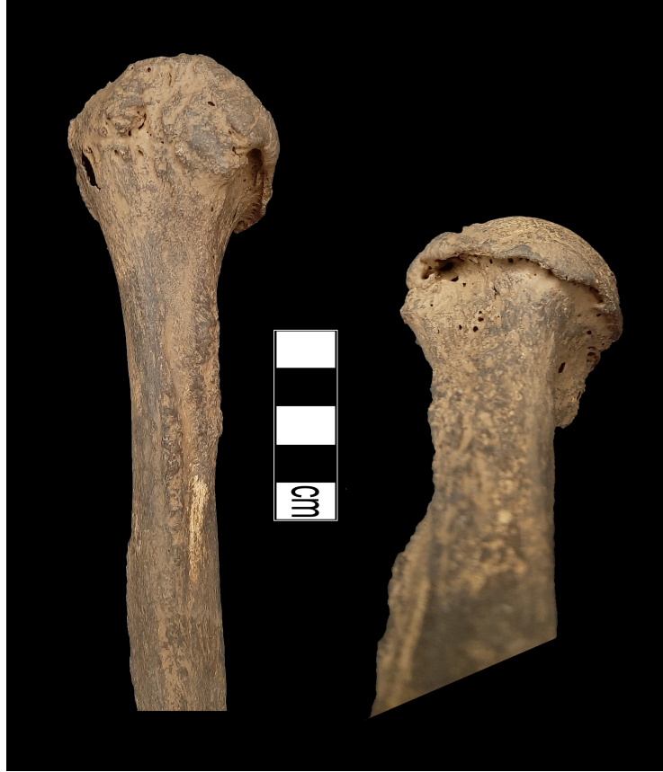
Resim 9. Humerusda deformasyon.