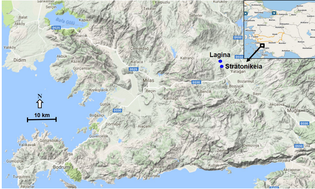
Resim 1. Stratonikeia Antik Kenti ve Lagina Hekate Kutsal Alanı (Kumsar ve Aydan 2019: 268).

Roma İmparatorluk Dönemi'nde ise Hadrianus ve Antoninus Pius zamanında (MS 117-161) kısa bir süre için kentin isminin Hadrianoupolis olduğu bilinmektedir (Magie 1950: 995-996; Aydaş 2012: 61-64; Söğüt 2013: 614).