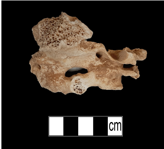
Resim 5. Atlas oksipitalizasyonu (4 numaralı resimdeki lezyona sahip birey).

Örnekleme içerisindeki en dikkat çeken patolojik olgu, 50-55 yaşlarında kadın bir bireyin vücut kemikleri üzerinde tespit edilmiştir. Bireyin bütün omurlarında (30 omur) farklı seviyelerde osteofit ve birçok omurunda Schmorl Nodülü gözlenmiştir. Ayrıca, iki bölgede omurlar birleşerek kemikleştiği gözlenmiştir (Resim 6-7). Bireyin parmak kemiklerinde artirit, uzun