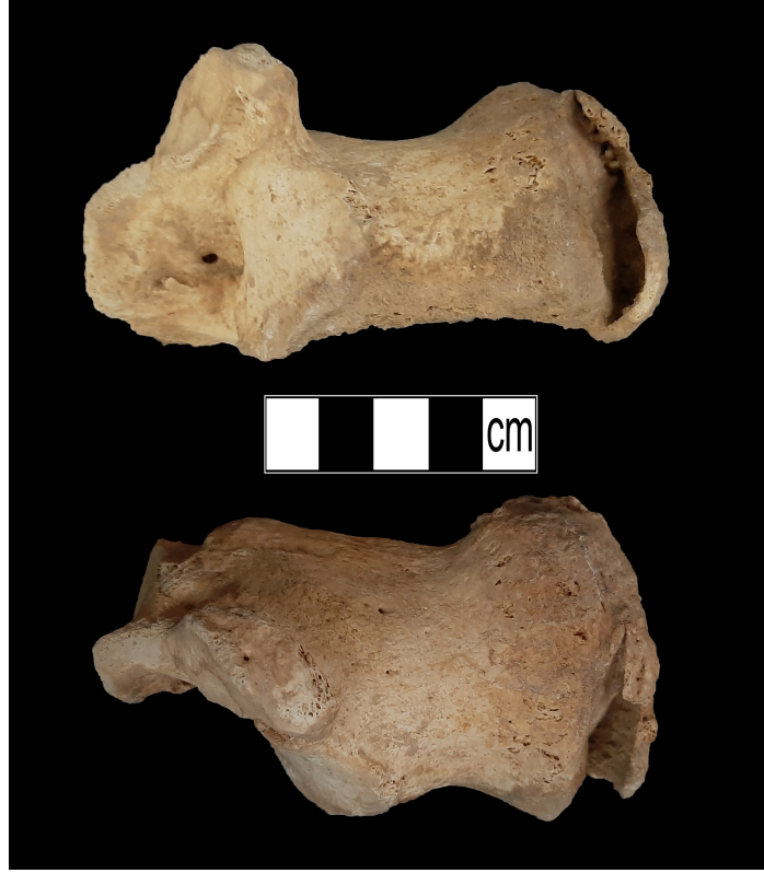
Resim 4. Calcaneusda entesopati.