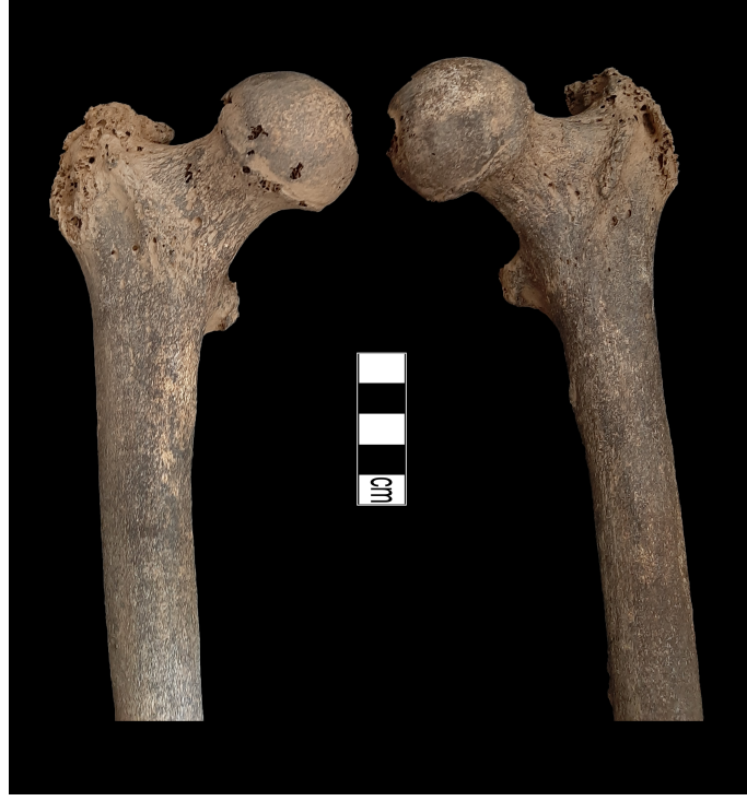
Resim 8. Femurlarda deformasyon.