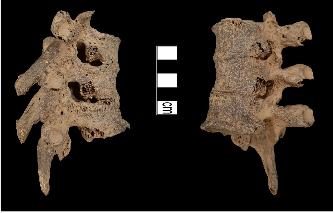
Resim 6. Üç omurun birleşmesi.

kemiklerinde (Resim 8-9) ve coxae kemiklerinde deformasyonlar tespit edilmiştir. Bu birey ile aynı mezardan çıkarılan ileri yaşlı erkek bireyin parmak kemiklerinde de artirit gözlenmiş olup, üç parmak kemiği ileri seviyede artirite bağlı olarak bütünleşerek tek bir kemik halini almıştır (Resim 10).