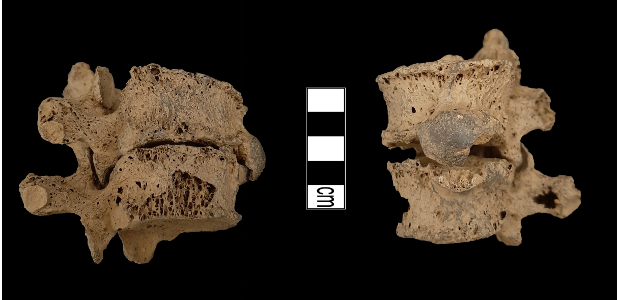
Resim 7. İki omurun birleşmesi.