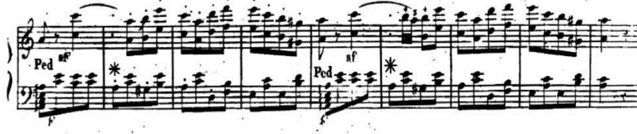
Şekil 3. L. Berger, sol el dizisinde bulunan kalıplar ve kırık akorlar; A bölümü sonu, B bölümüne geçişi sağlayan köprüye hazırlayıcı nitelikteki pasaj.

Her iki pasajın da birbiri ile benzerlik göstermesinden ötürü Berger, Mozart'tan farklı olarak belirtilen ölçülerdeki pasajı A bölümü içerisinde muhafaza etmiştir; B bölümü için Do Majör tonalitesinde farklı bir kurgu yarattığı gözlemlenmektedir. Berger'in B bölümü ile Mozart'ın B bölümü ritim kalıpları açısından benzerlik göstermektedir.