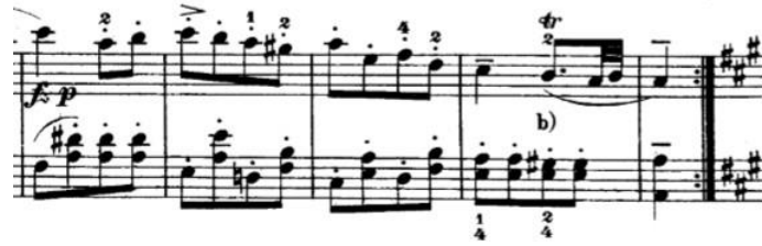
Şekil 4. W. A. Mozart, B bölümü öncesindeki geçiş, öö. 21-24.