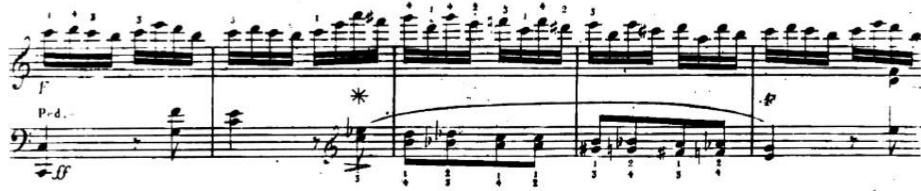
Şekil 7. L. Berger B bölümü, ölçü 65-69.

Ö. 66. de I-vii 4 ,3 0 \V6, ö. 67. de V6-iii 4 ,3(vii 4 ,3\VI)-VI4,3-Ger6+, ö. 68. de III-vii 4 ,3\II-II-vii 4 ,3, ö. 69. de I-V, ö. 70. de I-V7\V, ö. 71. de V-V\IV-IV-Fr6+, ö. 72. de III-V7\II-II-V7, ö. 73. de I-V7\II-II-V7, ö. 74. de I-V7\II-II-V7 fonksiyonları kullanılmıştır.