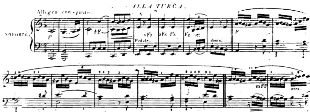
Şekil 2. L. Berger'in giriş pasajı ve refren bölümünden bir kesit.

Berger'in eserindeki 8 ölçülük giriş incelendiğinde, Mozart'ın eserindeki ritmik kurguyla benzerlik gösterdiği ve hem kendi eserindeki hem de Mozart'ın eserindeki ritmik kurgu, süslemeler ve eserlerdeki bestecilik anlayışlarını özetleyici nitelikte olduğu görülmektedir.