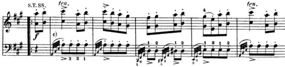
Şekil 5. W. A. Mozart, sol el dizisinde bulunan kırık arpejler ve kalıplar; B bölümünden bir kesit.

Berger'in B bölümüne geçiş adına kurguladığı köprüde (öö. 41-49) Do Majör tonalitesini gidiş hedeflenmektedir.