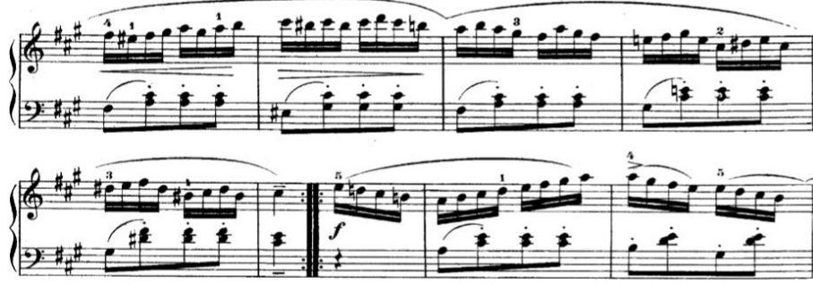
Şekil 10. W. A. Mozart, C bölümünden bir kesit, öö. 36-43.

Coda bölümü açısından eserler arasında benzerlikler kadar farklılıklar da söz konusudur.