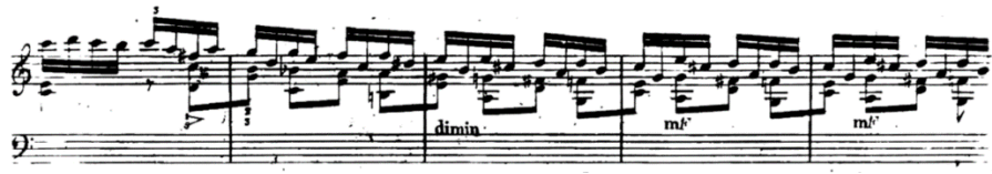
Şekil 8. L. Berger B bölümünden yeniden A bölümüne geçiş, ölçü 70-74.

Berger'in kurguladığı C bölümü ile Mozart'ın kurguladığı C bölümü ritmik ve armonik açıdan benzerlik göstermektedir; her iki bölümde de fa diyez minör baskın tonalitedir.