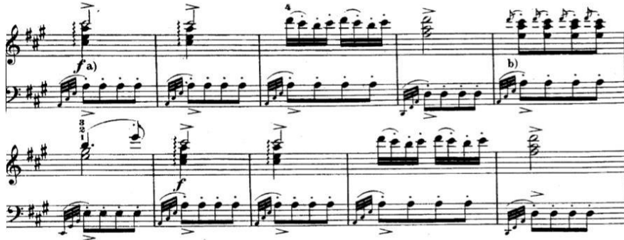
Şekil 11. W. A. Mozart'ın coda bölümünden bir kesit.

W. A. Mozart, coda bölümünü B bölümünün devamı şeklinde kurgularken, Ludwig Berger ise A bölümünün devamı şeklinde kurgulamaktadır. W. A. Mozart, eser bitişinde ana tonalitenin adaşı La Majör tonalitesini tercih ederken, L. Berger ana tonalitenin kendisini tercih etmektedir. Codaların bitiminde kullanılan oktavların fonksiyonel ve ritmik açıdan benzerliği, kırık akorların kullanımı ve çarpma notaların iki eserde de tema başlangıçları ile bitişlerini onaylayıcı bir ifadeyle kullanıldığı gözlemlenmektedir.