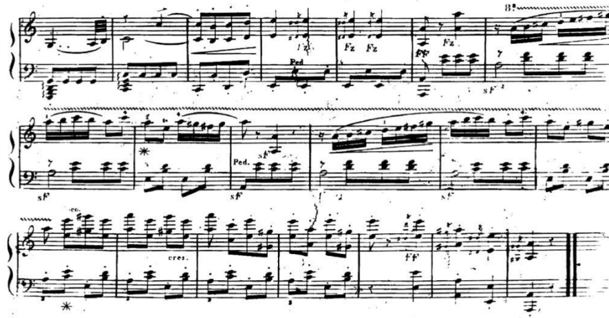
Şekil 12. L. Berger'in coda bölümünden bir kesit.