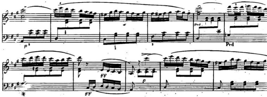
Şekil 9. L. Berger, C bölümünden bir kesit ölçü 109-119.

Berger'in kurguladığı C bölümünde, ölçü 109-112 içerisinde ilgili minör tonalite olan fa diyez minöre geçişten sonra ölçü 113-116 içerisinde Re Majör tonalitesi mevcuttur ve I-IV-V7-I dereceleri ile tam kadans gerçekleştirilmesinden sonra ölçü 116. içerisinde ana tonaliteye dönüş gerçekleştirilmiştir (ölçü 116. içerisinde fa anahtarı dizeğinin başına sekizlik sus işaretinin eklenmemesi ve sol anahtarında ilk dizek altındaki re notasının bulunmasının ölçü 115. kaynaklı olduğu ve aslen re notasının bas ses olduğu anlaşılmaktadır).