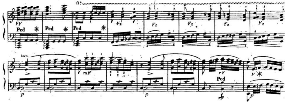
Şekil 6. L. Berger B bölümü köprüsü (öö. 41-49) ve B bölümünün girişi (ikinci dizekten itibaren).

Berger'in B bölümüne geçiş adına kurguladığı köprüde (öö. 41-49) Do Majör tonalitesini gidiş hedeflenmektedir.