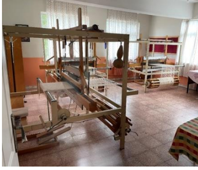
Fotoğraf 14. Ayancık Keten Evi (Kurtuluş İlköğretim Okulu), dokuma atölyesi, kamçılı tezgâhların genel görünümü, 15/10/2022.

Keten Evi' nde 20 tezgâhın aktif olarak kullanıldığı 3 adet dokuma atölyesi, 1 adet keten ipliği hazırlama atölyesi, kursiyer ve dokumacılar için dinlenme odası, dokumaların sergilenme alanı, tüm hazırlık aşamalarında kullanılan araç- gereçlerin olduğu bir oda dışında, dokuma için kullanılacak yıllık ham keten bitkisi ihtiyacını karşılayacak bir ekim alanı bulunmaktadır (fotoğraf 14- 20). 2020 yılından itibaren başarılı şekilde yürütülen proje ile keten üretimi yeniden başlamıştır. Keten üretiminin yeniden başlamasıyla birlikte dokumacılık da sürdürülmeye devam etmektedir.