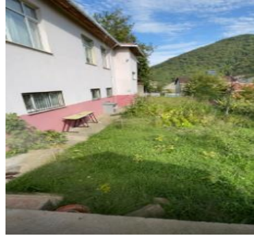
Fotoğraf 13. Ayancık Keten Evi (Kurtuluş İÖO), keten ekim sahası, 15/10/2022.