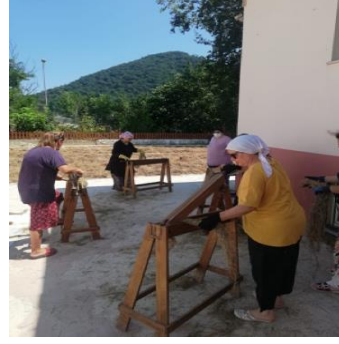
Fotoğraf 19. Ayancık Keten Evi (Kurtuluş İlköğretim Okulu), lif kırma çalışması.

Ayrıca yine proje kapsamında, Ayancık Belediyesi'ne tahsis edilen Hasan Hüsnü Kılıç Konağı için "Yaşayan Müze" olarak kullanıma yönelik girişimde bulunulmuştur. Üretim, tanıtım, sergileme ve satış imkânlarının da olacağı müzede çalışmalar devam etmektedir (fotoğraf 21).