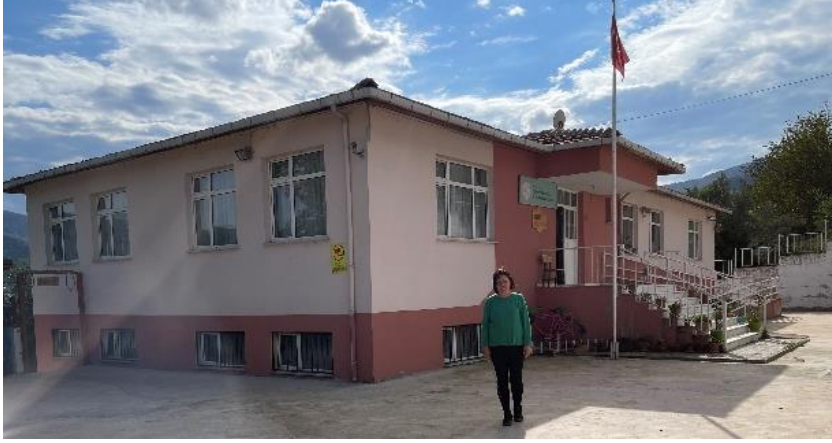
Fotoğraf 11. Ayancık Keten Evi (Kurtuluş İlköğretim Okulu), 15/10/2022.

(Kültür ve Turizm Bakanlığı Anadolu- Efes Birleşmiş Milletler Projesi) başlatılmıştır. Bu proje, turistik amaçlı tanıtımı sağlamanın yanı sıra bölgedeki keten dokumalar için gerekli olan hammadde ihtiyacının karşılanması, keten iplik üretiminin canlandırılmasıyla birlikte Ayancık keten dokumalarının eskiden olduğu gibi yeniden üretiminin artırılması amacıyla yapılmıştır. Proje kapsamında ilçe merkezinde eğitim-öğretime kapatılan tarihi Kurtuluş İlköğretim Okulu, “Keten Evi” adıyla, bünyesinde kurulan keten ürünleri işleme ve üretim atölyeleri ile birlikte yeni bir eğitim merkezine dönüştürülmüştür (fotoğraf 11).