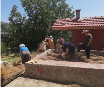
Fotoğraf 18. Ayancık Keten Evi (Kurtuluş İlköğretim Okulu), çürütme havuzu.