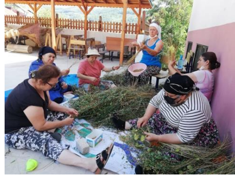
Fotoğraf 17. Ayancık Keten Evi (Kurtuluş İlköğretim Okulu), keten bitkisi işleme süreci