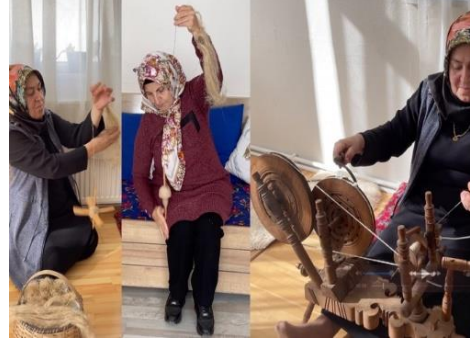
Fotoğraf 15. Ayancık Keten Evi (Kurtuluş İlköğretim Okulu), iplik eğirme atölyesi, 15/10/2022.