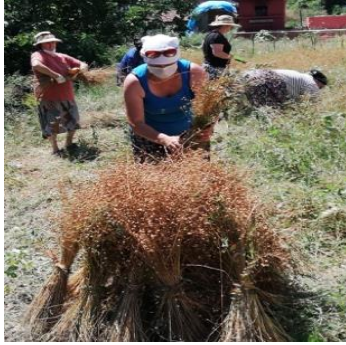
Fotoğraf 16. Ayancık Keten Evi (Kurtuluş İlköğretim Okulu), ekim alanı, hasat toplama.