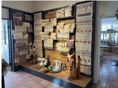
Fotoğraf 20. Ayancık Keten Evi sergileme alanı (Kurtuluş İlköğretim Okulu), 15/10/2022.