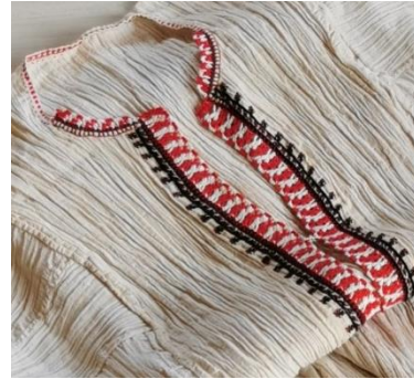
Fotoğraf 7. Sökme Yaka işleme örneği, Fotoğraf 8. Yörük Yaka ( Sökme ve Yüzlü Yaka desenleri birlikte kullanılır) işleme örneği, 17/10/2019.