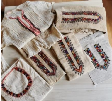
Fotoğraf 5. İşlenmiş farklı Göynek Yaka örnekleri, Fotoğraf 6. Oya Yaka işleme örneği, 17/10/2019.

Ayancık göynek yaka işlemlerinde renk, motif ve teknik farklılıkları dikkati çekerken, bazı işleme örneklerinde ise benzerlikler öne çıkmaktadır (fotoğraf 5). Genel olarak bordo ve siyah renk kullanımı yaygın olsa da işlemlerde pembe, mor, açık mavi, turuncu, kırmızı ve tonları sıklıkla kullanılmaktadır. Temel olarak, iğne oyası teknikleriyle hazırlanan üç ana yaka çeşidi bulunmaktadır. "Oya Yaka", ipliğin iğne üzerine yaklaşık sekiz defa sarılıp iğnenin çekilmesiyle yapılan zürefa tekniği ile hazırlanmaktadır (fotoğraf 6). "Sökme Yaka" ise kanava (çapraz iğne), verip hesap iğnesi ve iğne oyasından oluşan ajur tekniği ile işlemenin tersinden ve kasnak kullanılmadan yapılmaktadır (fotoğraf 7). "Yüzlü Yaka", yine kanava tekniği ile fakat işlemenin ön yüzünden uygulanmaktadır (fotoğraf 8). Yaka işleme çeşitleri farklı tekniklerle çeşitlendirilip isimlendirilmiştir. Bunların Harem Suyu, Gaytan, Dırnak, Eğri Yengil, Zarif Ayşe, Düz Oya, Hünkâr Merdiveni, Lenger Gıyısı, Gapton Paşa Gucaklaması, Maydonoz, Tekli Dik Gırma, Çift Dik Gırma, Mısgalı Gırma teknikleri olduğu yazılı kaynaklardan öğrenilmektedir (detaylı bilgi için bkz. Şentürk, 2003, s.71-73). Ayrıca farklı işleme tekniklerinin birlikte kullanımıyla oluşturulmuş kompozisyonlara Paralı Gırma ve Yörük Yaka örnek gösterilebilir (fotoğraf 9-10).