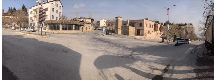
Şekil-4. Harputun girişindeki evlerin yeni hali (Elazığ Belediyesi, 2009)

Harput'ta 2015 yılında başlayan ve Belediyenin KUDEB birimi tarafından yürütülen çalışmalar da Harput'un geleceği ve sürdürülebilirliği açısından önem arz etmekte olup bu çalışmaların günümüzde de devam ettiği görülmektedir. Harput'un tarihi değerlerinin korunması amacıyla yapılan çalışmalar çevresel, sosyo-kültürel ve ekonomik açıdan fayda sağlarken, gelecek kuşaklara aktarılması açısından da önem taşımaktadır (Arslan, 2013).