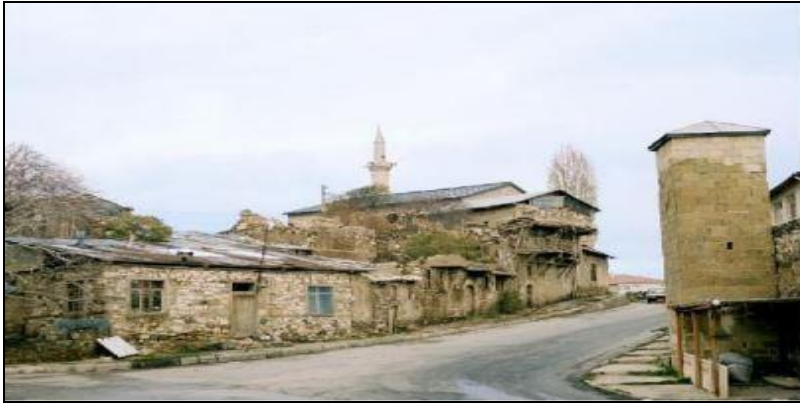
Şekil-3. Harputun girişindeki evlerin eski hali (Elazığ Belediyesi, 2009)

Harput'un önemli sorunlarından olan kanalizasyon, içme suyu ve yağmur sularının tahliye edilmesi gibi durumların düzenlenmesi yapılarak, imar planının gerektirdiği şekilde Harput sokakları doğal taşlarla döşenerek restore edilmiştir. Harput'a girişten itibaren aslına uygun şekilde sokak dokusu yenilenmiş, altyapı çalışmaları tamamlanmış ve sokaklar aydınlatılmıştır (Kültür ve Turizm Bakanlığı, 2022).