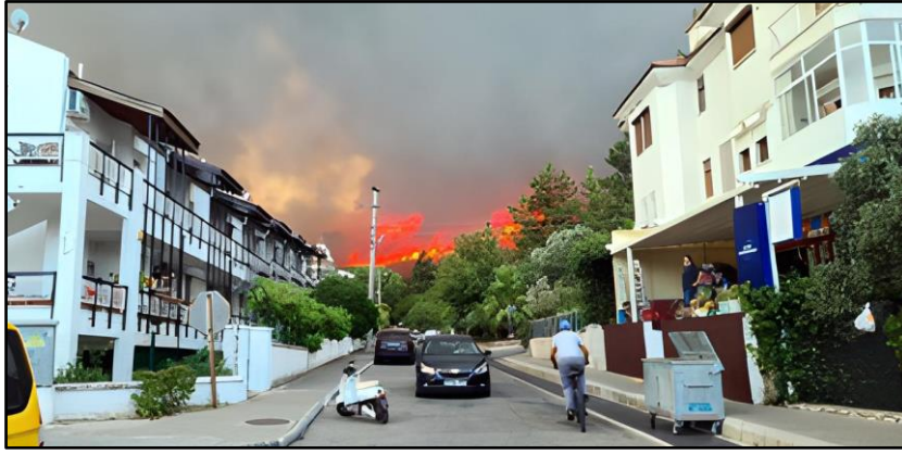
Şekil 2. Marmaris Orman Yangınlarının Yerleşim Yerlerinden Görüntüsü-1 (URL 10)