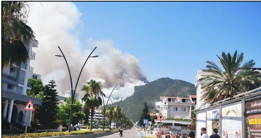
Şekil 3. Marmaris Orman Yangınlarının Yerleşim Yerlerinden Görüntüsü-2 (URL 11)