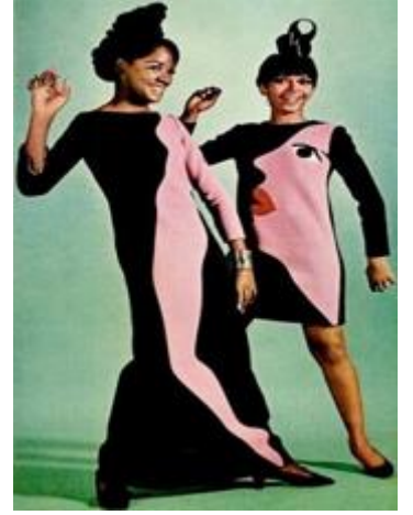
Resim 7. Yves Saint Laurent [24]

Yves Saint Laurent, tasarımlarını yaparken, Mondrian ve Picasso'nun tablolarından ilham almıştır. Ayrıca tasarımcı, Andy Warhol'un Pop Art tarzı desenlerinden ilhamla hazırladığı bir koleksiyonla popülerliğini arttırmıştır. Resim 5'de mavi, kırmızı, sarı, beyaz ve siyah renklerinin bulunduğu siyah kalın çizgili dikdörtgen desenli Mondrian koleksiyonu 1965 yılında oluşturmuştur. Resim 6'da Yuvarlak yaka, uzun kollu, üst bedeni pembe kalp baskılı olan mini elbiseyi ten rengi parlak çorap ve siyah kısa topuklu ayakkabıyla bütünleştirmiştir. Koleksiyonda yer alan bir diğer elbise ise, petrol mavisi, siyah ve sarı ve turuncu renklerden oluşan, ön bedeni daire şeklinde olan karikatür desenli elbiseyi ten rengi parlak çorapla tamamlamıştır. Resim 7'de ise tasarımcının kayık yaka, ges kollu zemin siyah üzerine pudra renkte silüet baskılı elbiseyi kısa topuklu sivri burunlu ayakkabı ile kombinlemiştir. Koleksiyondaki bir diğer tasarımda ise, kayık yaka, uzun kollu, zemin siyah pudra renkte silüet baskılı mini elbiseyi ten rengi çorap ve kısa topuklu yuvarlak burunlu ayakkabı ile tamamlamıştır.