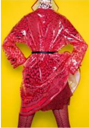
Resim 1. Christian Dior [18]

Fransa'da 1905 yılında dünyaya gelen tasarımcı, 10 yaşında iken 4 kardeşi ile birlikte Paris'e taşınmıştır. Siyasi bilimler eğitimi alan tasarımcı moda ve eskiz çizimlerine ilgi duymuştur. Christian Dior, 1946 yılında Paris Montaigne caddesinde bir modaevi açtığında 20. yüzyıla damgasını vurmuştur. 1947 yılında oluşturduğu koleksiyonu ile moda trendi kavramının ve tüm dünyada ilgi görecektir olan yeni bir giyim anlayışının oluşmasını sağlamıştır.