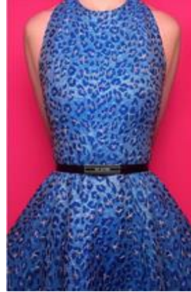
Resim 2. Christian Dior [19]

Pop Art akımından etkilenen Christian Dior Pre-Fall 2021 koleksiyonu yukardaki tabloda Resim 1 ve 2' de oluşturmuştur. Markanın Kreatif Direktörü Maria Graize Chiuri, bu koleksiyonda Christian Dior'un arşivlerinde yer alan Leopar desenli bir trençkottan ilham almıştır. Bu ceketin yeni halini göstermek için ceketin kumaşını