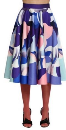
Resim 4. Emilio Pucci [21]

Ayakkabıdan eteğe koleksiyonun tüm parçalarında etkilenmiş olduğu Pop Art akımının izlerini Resim 3 ve 4’de görmek mümkündür. Geometrik desenlerden ve soyut biçimlerle bütünleştiği yuvarlak burunlu siyah, mor, pudra, yeşil, beyaz vb. gibi tonlardan oluşan topuklu ayakkabı ile beli kemerli mor, mavi, pudra ve mint yeşili, lila gibi renklerin bulunduğu kloş eteği siyah önü açık olan topuklu ayakkabı ile kombinleyerek sade ve şık bir tasarım ortaya koymuştur.