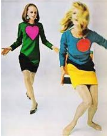
Resim 6. Yves Saint Laurent [23]