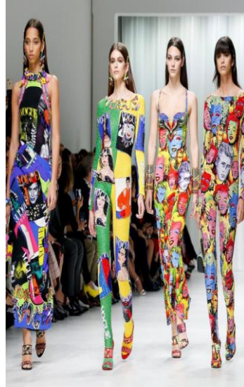
Resim 9. Gianni Versace [26]