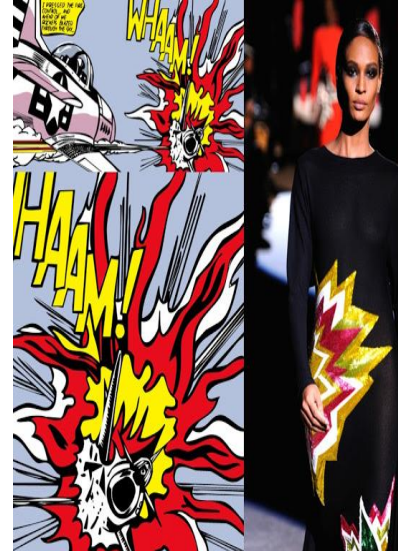
Resim 10. Gianni Versace [27]

Gianni Versace'nin 1990'da oluşturduğu gece elbisesi Resim 8'de askılı göğüs dekolteli vücudu saran etek boyu ayak bileği hizasında olan Marilyn Monroe ve Elvis Presley portre baskılı sarı, yeşil, mavi, turuncu gibi renklerin hâkim olduğu elbiseyi siyah çapraz bantlı önü açık topuklu ayakkabı ile kombinlemiştir. 1991 yılında ilkbahar-yaz giysileri olarak tasarladığı Resim 9'da portre baskılı elbiseler ile tulumlarda siyah, mavi, kırmızı, sarı, yeşil, pembe gibi renklerin hâkim olduğu görülmekte ve bu tasarımlar önü açık topuklu ayakkabılarla kombinlemiştir. Tasarımcı 1996 yılında Roy Lichtenstein' in 'Whaam!' adlı çalışmasından esinlenerek Resim 10'da siyah zemin üzerine sarı, beyaz, kırmızı, yeşil tonlarında 'whaam!' efekti baskılı, yuvarlak yaka, uzun kollu elbiseyi tasarlamıştır.