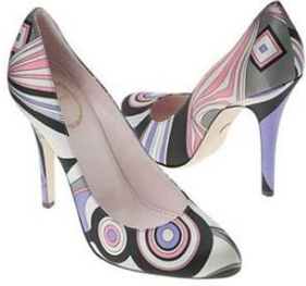
Resim 3. Emilio Pucci [20]

Floransa'nın en ünlü ailelerinin bir üyesi olarak 1914 yılında doğmuştur. Marquis Emilio Pucci Amerika’da eğitim alan, hava kuvvetleri pilotu, olimpiyat kayakçısı ve aynı zamanda aristokrattır. Tüm bu özelliklerinden dolayı “Rönesans adamı” diye anılmaktadır. Pop Art akımından etkilenen tasarımcıdır.