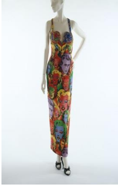
Resim 8. Gianni Versace [25]

Gianni Versace, 2 Aralık 1946 yılında İtalya'da Reggio Calabria şehrinde dünyaya gelmiştir. Santo Versace ve Donatella Versace adında 2 kardeşi vardır. Annesi terzi olan Gianni Versace, çıraklığa çok küçük yaşta başlamıştır. Mimarlık eğitimi alan 25 yaşındaki tasarımcı moda tasarımcılığı alanında çalışmak üzere Milano'ya taşınmıştır.